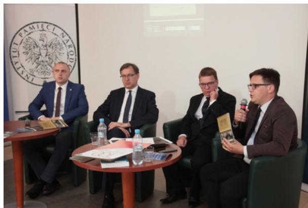
IPN przypominał 100. rocznicę plebiscytu na Warmii, Mazurach i Powiśiu – konferencja prasowa 9 lipca 2020.