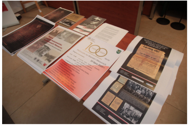
IPN przypomina: 100. rocznicę plebiscytu na Warmii, Mazurach i Powiślu – konferencja prasowa 9 lipca 2020.