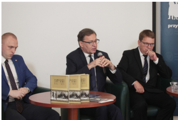
IPN przypomnieli 100. rocznicę plebiscytu na Warmii, Mazurach i Powiślu – konferencja prasowa 9 lipca 2020.

Dokładny program uroczystości w Lubstynku dostępny jest na stronie gdańskiego oddziału IPN.