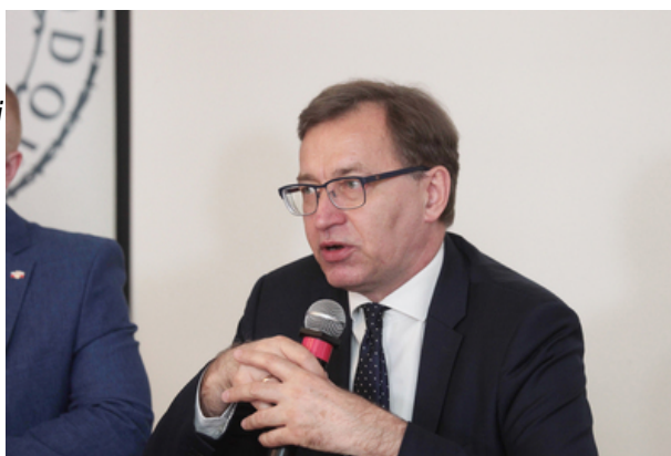
Dr Jarosław Szarek, prezes Instytutu Pamięci Narodowej.