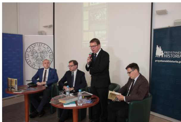
IPN przypomniał 100. rocznicę plebiscytu na Warmii, Mazurach i Powiślu – konferencja prasowa 9 lipca 2020.