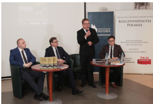
IPN przypomnieli 100. rocznicę plebiscytu na Warmii, Mazurach i Powiślu – konferencja prasowa 9 lipca 2020.