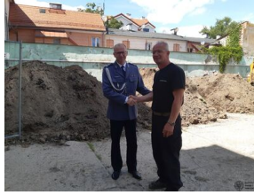
Prace poszukiwawcze w Puktusku #24