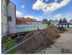
Prace poszukiwawcze w Puktusku #23