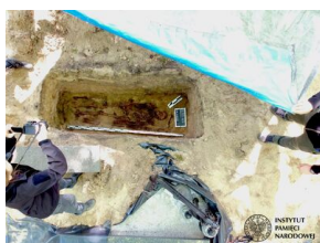
Szczecin. Poszukiwania szczątków Jana Szewczuka ps. „Nowy”.