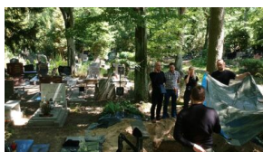
Szczecin. Poszukiwania szczątków Jana Szewczuka ps. „Nowy”.