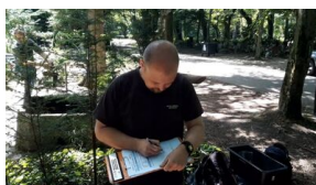
Szczecin. Poszukiwania szczątków Jana Szewczuka ps. „Nowy”.