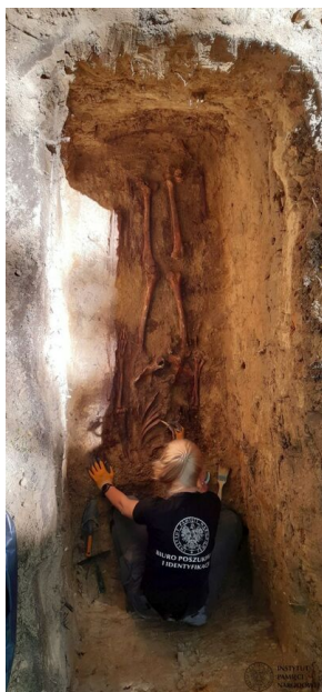
Szczecin. Poszukiwania szczątków Jana Szewczuka ps. „Nowy”.