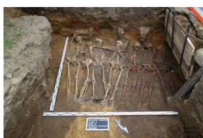
Prace Biura Poszukiwań i Identyfikacji IPN w Odolanowie - 15-19 czerwca 2020