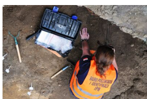
Prace Biura Poszukiwań i Identyfikacji IPN w Odolanowie - 15-19 czerwca 2020

Tegoroczne prace prowadzono w obrębie rzekomo symbolicznego Grobu Powstańców Wielkopolskich i Żołnierzy Podziemia Niepodległościowego. Podczas prac ujawniono szczątki ośmiu osób. Sposób ułożenia szkieletów w grobie i cechy biologiczne oraz charakter urazów wskazuje, że prawdopodobnie natrafiono na poszukiwanych żołnierzy. Odnaleziono przy nich liczne artefakty, tj. guziki wojskowe i inne fragmenty umundurowania, grzebień oraz łuski od amunicji typu Mauser. Szczątki zostaną poddane badaniom genetycznym.