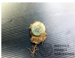
Prace Biura Poszukiwań i Identyfikacji IPN w Odolanowie - 15-19 czerwca 2020