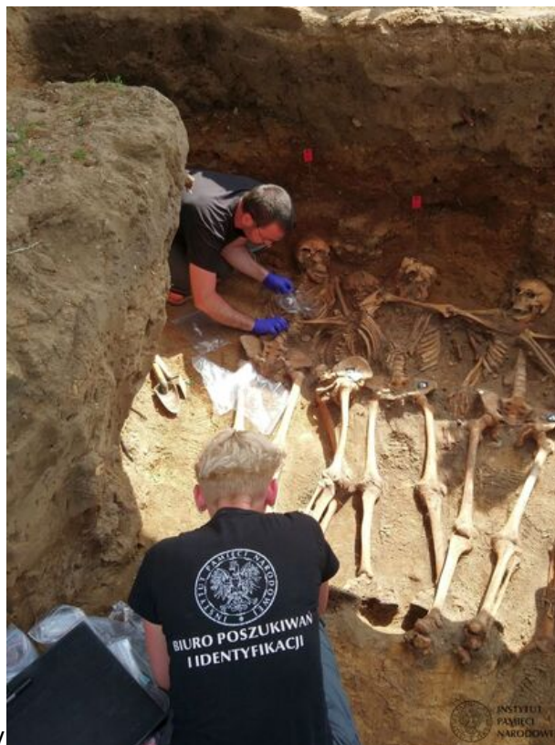
Prace Biura Poszukiwań i Identyfikacji IPN w Odolanowie – 15–19 czerwca 2020

Tego dnia oddział „Błyska” opanował Odolanów. W miasteczku rozbrojono posterunek MO, zajęto pomieszczenia ratusza, a pieniądze zabrane z miejskiej kasy zostały rozdane mieszkańcom na wiecu zorganizowanym na rynku miejskim. Podczas odwrotu, pod Odolanowem, doszło do półtoragodzinnej walki pomiędzy oddziałem a ścigającą go grupą operacyjną