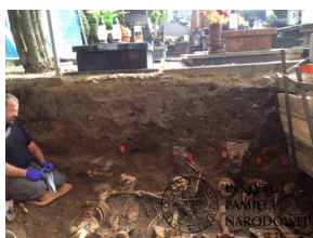
Prace Biura Poszukiwań i Identyfikacji IPN w Odolanowie - 15-19 czerwca 2020