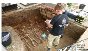
Prace Biura Poszukiwań i Identyfikacji IPN w Odolanowie - 15-19 czerwca 2020