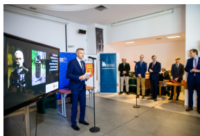
Konferencja prasowa dotycząca upamiętnienia gen. Bolesława Roja na terenie byłego niemieckiego obozu koncentracyjnego KL Sachsenhausen - Warszawa, 27 maja 2020.