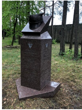
Pomnik gen. Bolesława Róli na terenie byłego niemieckiego obozu koncentracyjnego KL Sachsenhausen