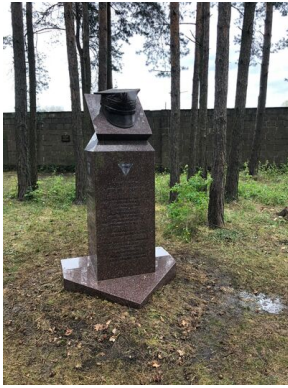
Pomnik gen. Bolesława Róli na terenie byłego niemieckiego obozu koncentracyjnego KL Sachsenhausen