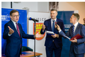
Prezes IPN przekazał prezydentowi Kielce, pochodzącemu ze Szpeęgawska, monografię IPN poświęconą zbrodni w Lesie Szpeęgawskim 1939-1940 - Warszawa, 27 maja 2020.