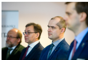
Konferencja prasowa dotycząca upamiętnienia gen. Bolesława Roja na terenie byłego niemieckiego obozu koncentracyjnego KL Sachsenhausen - Warszawa, 27 maja 2020.