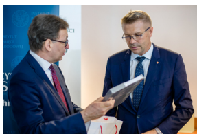
Konferencja prasowa dotycząca upamiętnienia gen. Bolesława Roja na terenie byłego niemieckiego obozu koncentracyjnego KL Sachsenhausen - Warszawa, 27 maja 2020.