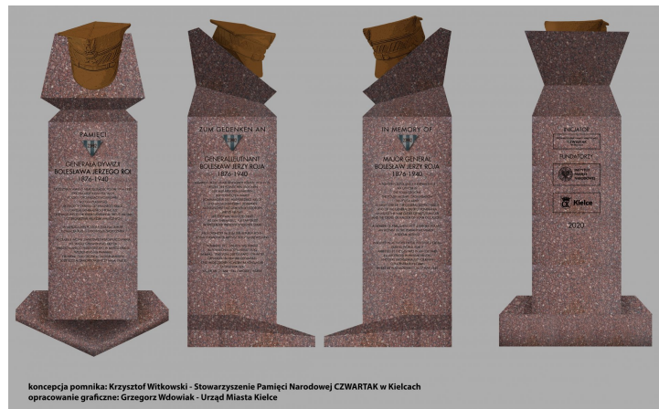
koncepcja pomnika: Krzysztof Witkowski - Stowarzyszenie Pamięci Narodowej CZWARTAK w Kielcach opracowanie graficzne: Grzegorz Wdowiak - Urząd Miasta Kielce