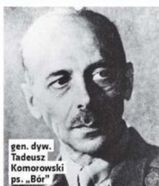
gen. dyw. Tadeusz Komorowski ps. „Bór”

G dyby ktoś mnie pytał o ważne daty z okresu 1939–1945, to uważam, że 14 lutego 1942 r. jest jedną z nich. Tego dnia Naczelny Wódz, gen. Władysław Sikorski, przekształcił Związek Walki Zbrojnej w Armię Krajową i mianował jej dowódcą gen. Stefana Roweckiego.