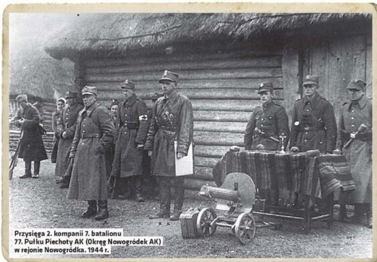
Przysięga 2. kompanii 7. batalionu 77. Pułku Piechoty AK (Okręg Nowogródek AK) w rejonie Nowogródka, 1944 r.

Żołnierze AK przygotowywali również powstanie powszechne w ramach akcji „Burza”, które miało pokazać nadciągającej Armii Czerwonej, że Polacy