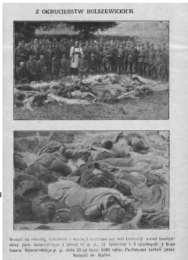
Reprodukcje zdjęć żołnierzy poległych pod Lemaniem opublikowane w „Tygodniku Ilustrowanym”, nr 39 z 25 IX 1920 r.