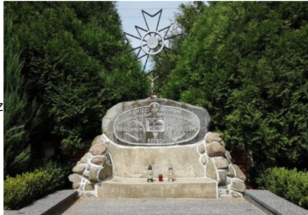
Pomnik żołnierzy zamordowanych i poległych pod Lemaniem na cmentarzu w Kolnie