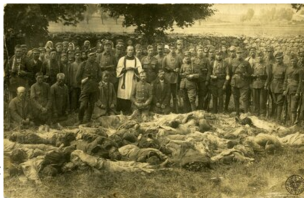
Ciała polskich żołnierzy zamordowanych i poległych pod Lemanem na cmentarzu w Kolnie, sierpień 1920 r. (autor: Stefan Mroczkowski, fot. z zasobu IPN)