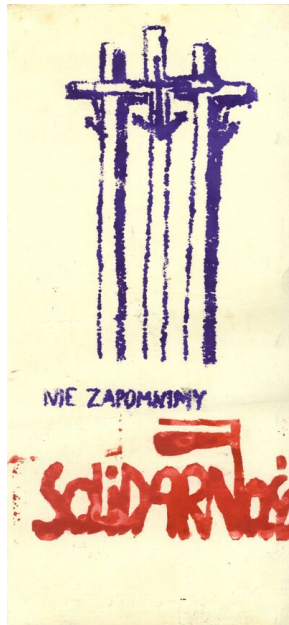
Plakat „Nie zapomniemy. Solidarność” z motywem pomnika Ofiar Grudnia 1970 r.