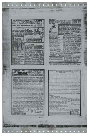
Matryca czasopism „Maj Wywrotowiec” i „Dwójka” z marca 1989 r.