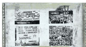
Błaszana matryca ze zdjęciami z wizyty papieża Jana Pawła II w Gdańsku w 1987 r.