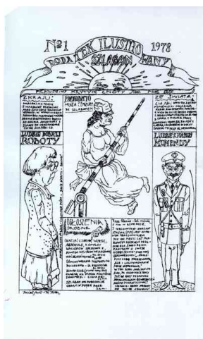
„Dodatek Ilustrowany: Sziaban”, czasopismo satyryczne z 1978 r.