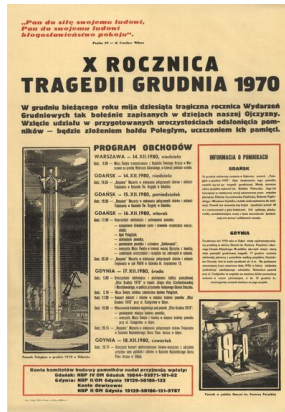
Program obchodów X rocznicy Grudnia 1970 (grudzień 1980 r.)