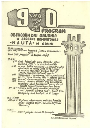
Program obchodów Dni Grudnia w Stoczni Remontowej „Nauta” w Gdyni (grudzień 1981 r.)