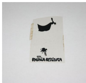
Znaczek poczty podziemnej