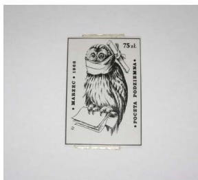
Znaczek poczty podziemnej