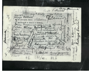
Podpisy więźniów, w prawym górnym rogu - Cyryl Ratajski, 9 maja 1940 r.