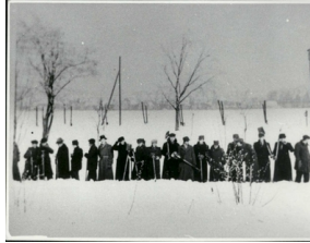
Prace obozowe przy odgarnianiu śniegu