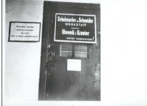
Warsztat rzemieślniczy w obozie