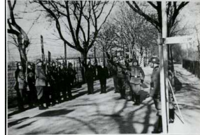
Obchody święta 1 Maja przez zarogę niemieckiego obozu przy ul. Głównej