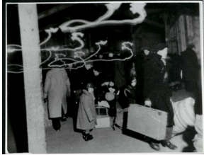
Przygotowanie do rewizji przybyłych więźniów