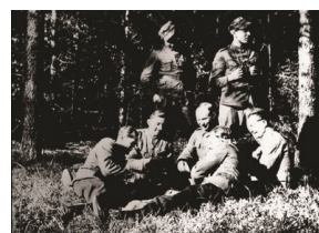
Prace ekshumacyjne w Gibacu, 1987 (zbiory)