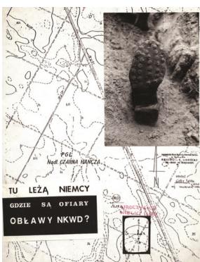
Ulotka, 1987 r. (zbiory IPN)

Inspektor Inspektoratu Suwalskiego AKO, 1945 r. (zbiory IPN)