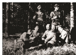
Prace ekshumacyjne w Gibach, 1987 (zbiory)