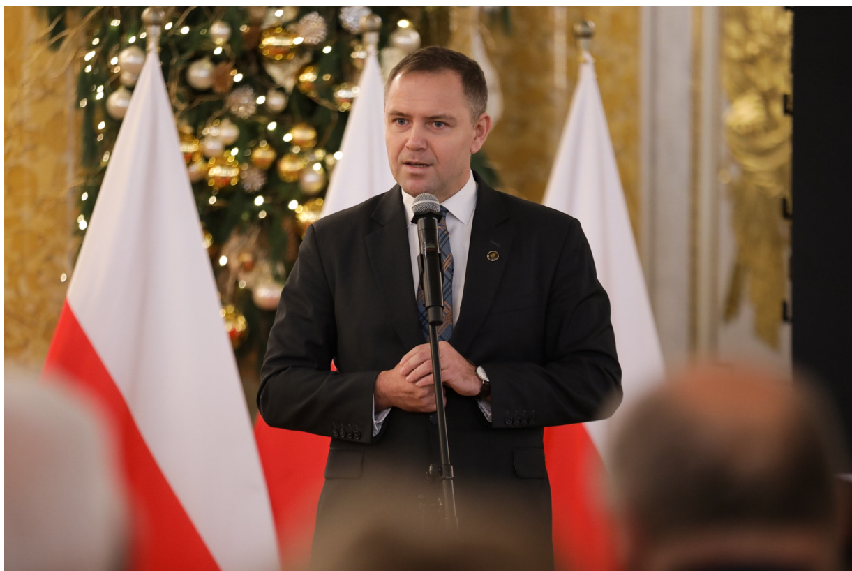
Prezes IPN dr Karol Nawrocki podczas gali wręczenia nagród Instytutu Pamięi Narodowej „Semper Fidelis” – Warszawa, 15 grudnia 2023.