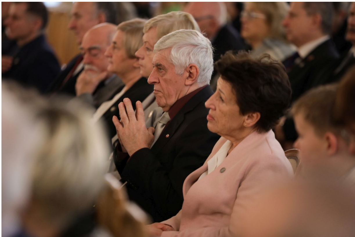
Uroczysta gala wręczenia nagród Instytutu Pamięi Narodowej „Semper Fidelis” – Warszawa, 15 grudnia 2023.