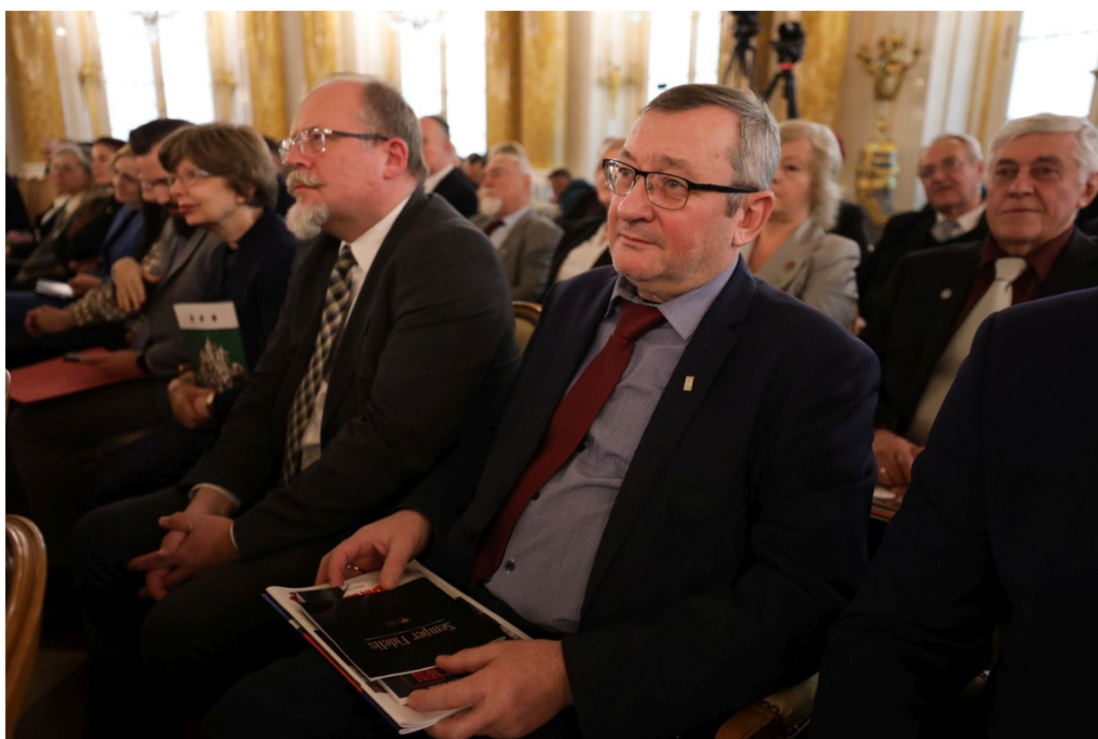
Uroczysta gala wręczenia nagród Instytutu Pamięi Narodowej „Semper Fidelis” – Warszawa, 15 grudnia 2023.