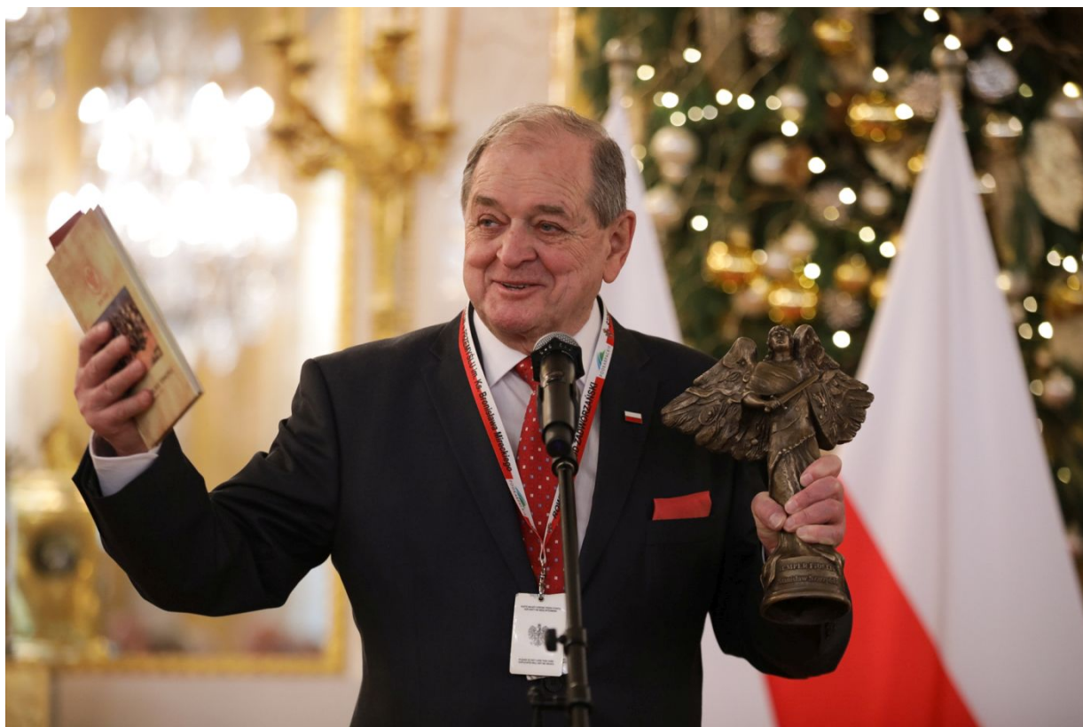
Uroczysta gala wręczenia nagród Instytutu Pamięi Narodowej „Semper Fidelis” – Warszawa, 15 grudnia 2023.