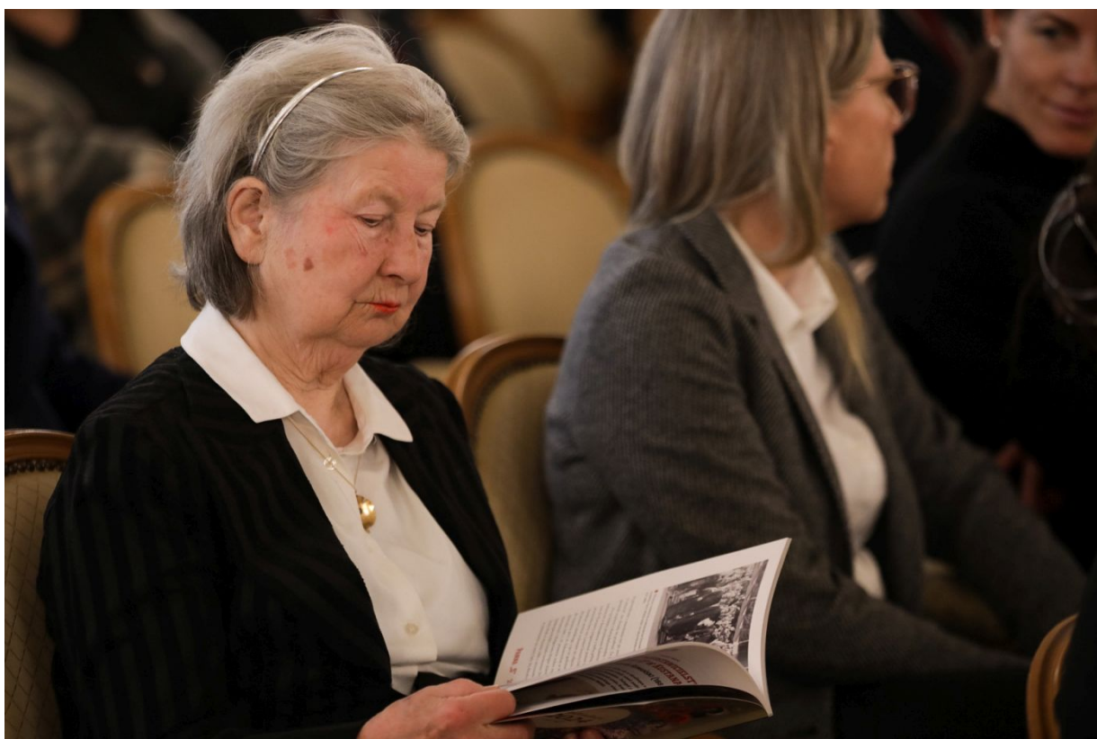
Uroczysta gala wręczenia nagród Instytutu Pamięi Narodowej „Semper Fidelis” – Warszawa, 15 grudnia 2023.