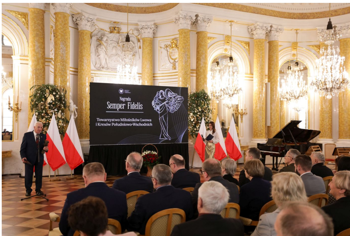
Uroczysta gala wręczenia nagród Instytutu Pamięci Narodowej „Semper Fidelis” – Warszawa, 15 grudnia 2023.

- Pamięć o Kresach Wschodnich buduje naszą dzisiejszą tożsamość i naszą narodową wspólnotę - powiedział dr Karol Nawrocki, prezes Instytutu Pamięci Narodowej, podczas gali wręczenia nagród „Semper Fidelis”, przyznawanych za prowadzenie działalności na rzecz upamiętniania dziedzictwa Kresów Wschodnich.