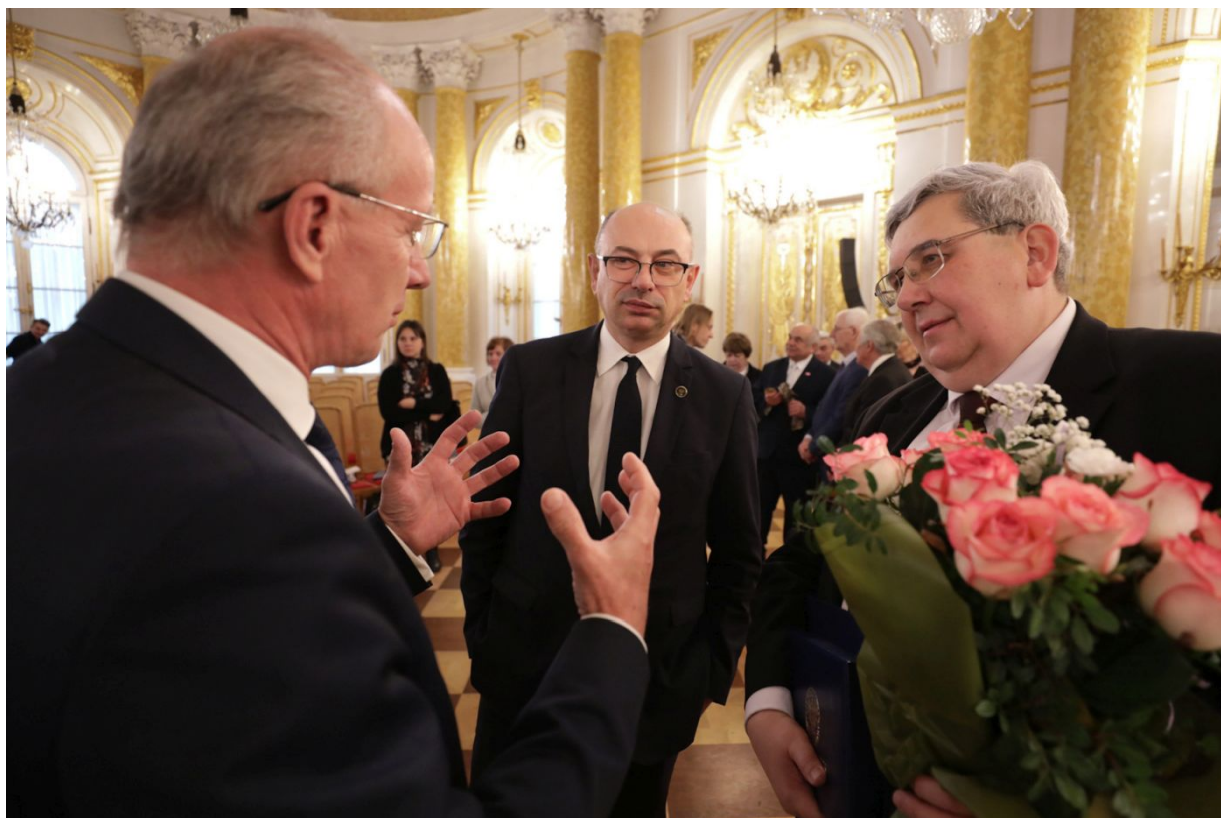
Uroczysta gala wręczenia nagród Instytutu Pamięi Narodowej „Semper Fidelis” – Warszawa, 15 grudnia 2023.