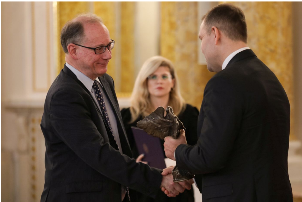
Uroczysta gala wręczenia nagród Instytutu Pamięi Narodowej „Semper Fidelis” – Warszawa, 15 grudnia 2023.