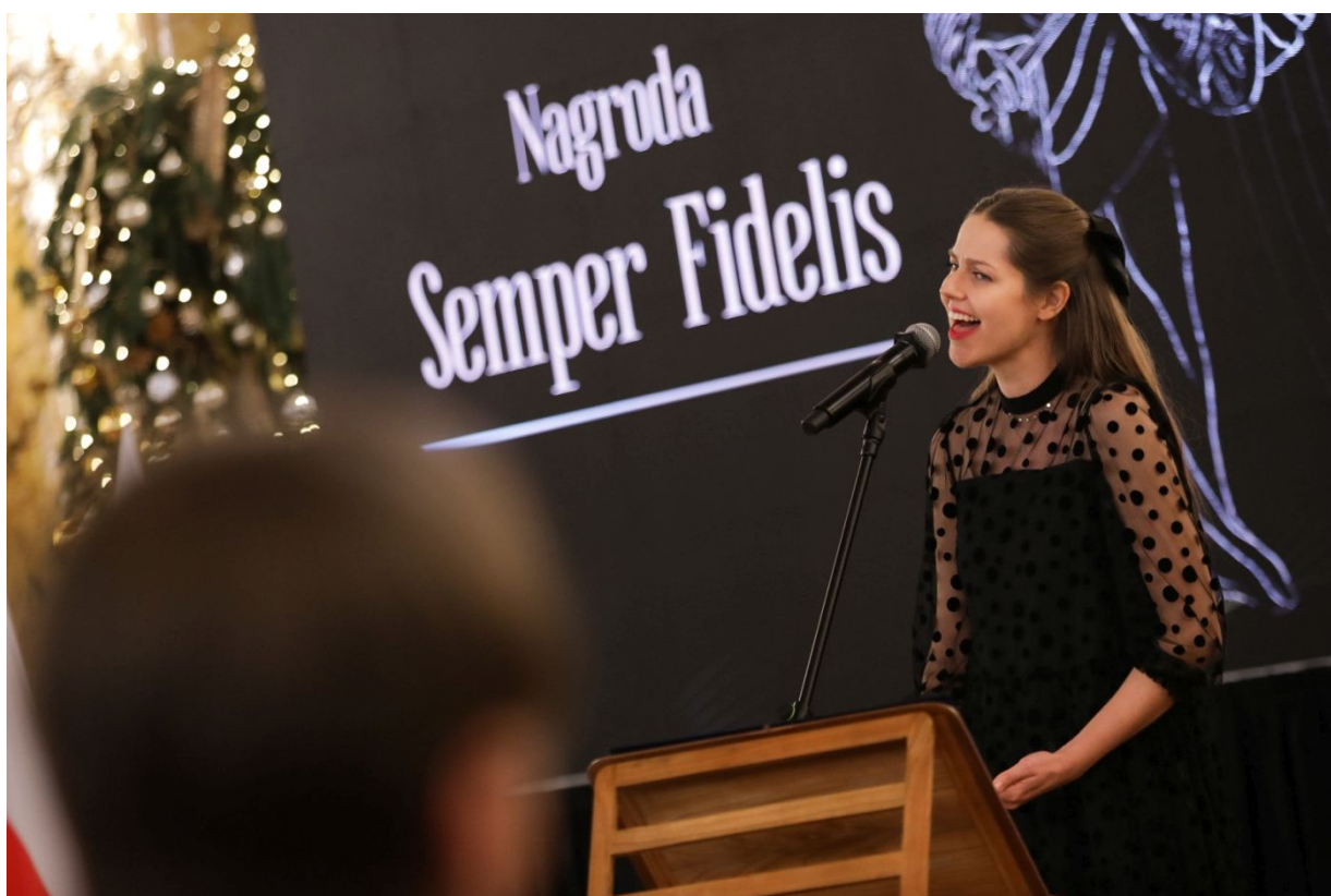
Uroczysta gala wręczenia nagród Instytutu Pamięi Narodowej „Semper Fidelis” – Warszawa, 15 grudnia 2023.