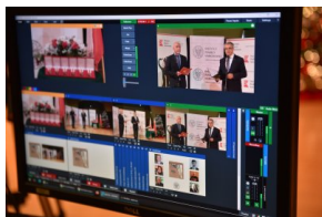
Ogłoszenie laureatów I edycji nagrody Świadek Historii w Katowicach.