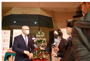
Ogłoszenie laureatów I edycji nagrody Świadek Historii w Katowicach.