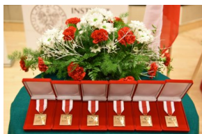
Ogłoszenie laureatów I edycji nagrody Świadek Historii w Katowicach.