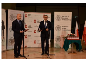
Ogłoszenie laureatów I edycji nagrody Świadek Historii w Katowicach.