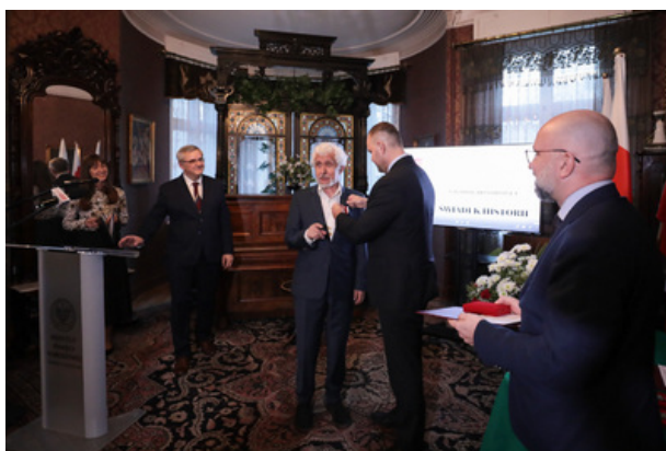
Uroczystość wręczenia Nagrody Honorowej IPN