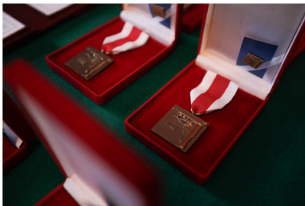
Uroczystość wręczenia Nagrody Honorowej IPN „Świadek Historii” w Katowicach.

Reprezentujecie tak różne środowiska – mówił dr Karol Nawrocki – Jest wśród Was doświadczona pedagog, działaczka społeczna, która buduje narodową wspólnotę poprzez wiedzę historyczną i pamięć.