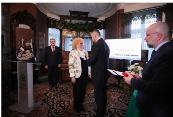
Uroczystość wręczenia Nagrody Honorowej IPN „Świadek Historii” w Katowicach.

W historii kultury, w historii cywilizacji świadek ma szczególne znaczenie. Świadek niesie moc autorytetu, ale także ogromne brzemie odpowiedzialności. Dokonuje przecież wiwisekcji świata, którego już nie ma. Dokonuje wiwisekcji świata historycznego i przeszłości. Podejmuje