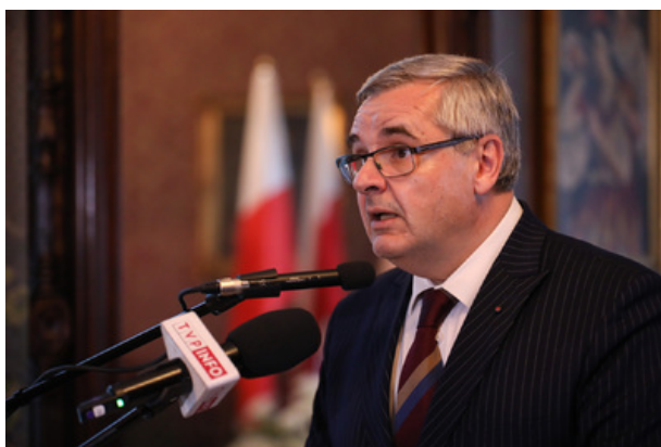
Uroczystość wręczenia Nagrody Honorowej IPN „Świadek Historii” w Katowicach.

Jest emerytowaną nauczycielką języka polskiego, byłym dyrektorem Zespołu Szkół Zawodowych i Ogólnokształcących nr 5 im. W. Pileckiego w Katowicach, prezesem Śląskiego Oddziału Towarzystwa Opieki nad Oświęcimiem w Katowicach oraz członkiem Komitetu Ochrony Pamięci Walki i Męczeństwa przy oddziale IPN w Katowicach. Z jej inicjatywy w ośmiu szkołach powstały klasy o profilu wojskowym. Była animatorem kilkunastu edycji Międzynarodowego Konkursu Plastycznego „Ludzie ludziom zgotowali ten los”.