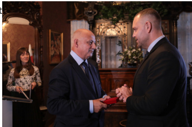
Uroczystość wręczenia Nagrody Honorowej IPN „Świadek Historii” w Katowicach.