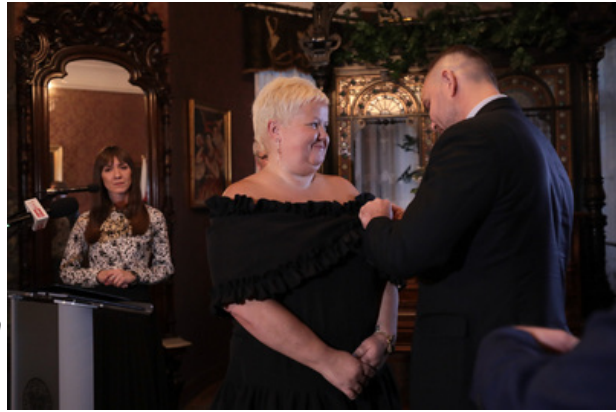
Uroczystość wręczenia Nagrody Honorowej IPN „Świadek Historii” w Katowicach. Fot. Mikołaj Bujak/IPN

„Świadek Historii” w Katowicach. Fot. Mikołaj Bujak/IPN