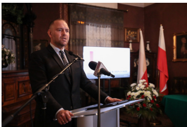
Uroczystość wręczenia Nagrody Honorowej IPN

Jest wśród Was artysta, malarz, który ma odwagę przekładać prawdę historyczną na język kultury, sztuki, pieśni i obrazu, co jest szalenie trudne i wymaga wielkiego kunsztu. W końcu dwie organizacje i