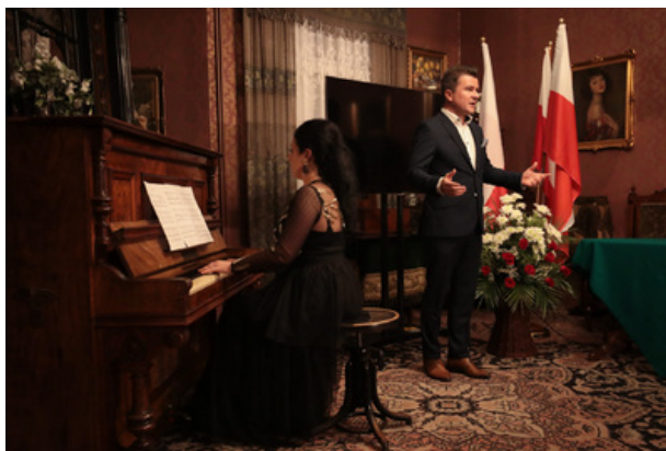
Uroczystość wręczenia Nagrody Honorowej IPN „Świadek Historii” w Katowicach. Fot. Mikołaj Bujak/IPN

„Świadek Historii” w Katowicach. Fot. Mikołaj Bujak/IPN