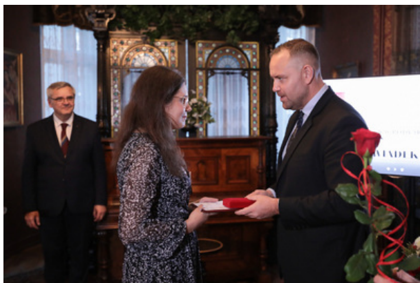
Uroczystość wręczenia Nagrody Honorowej IPN „Świadek Historii” w Katowicach.