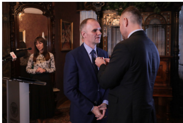
Uroczystość wręczenia Nagrody Honorowej IPN „Świadek Historii” w Katowicach.