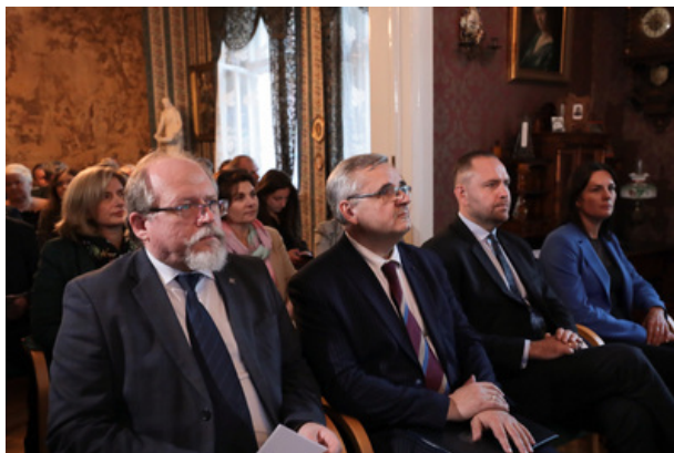
Uroczystość wręczenia Nagrody Honorowej IPN „Świadek Historii” w Katowicach.

„Świadek Historii” to wyjątkowe odznaczenie Instytutu Pamięci Narodowej skierowane do wyjątkowych osób, które w sposób szczególny pielęgnują pamięć o polskiej historii i wspierają Instytut Pamięci Narodowej w ustawowej działalności.