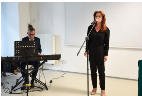
Uroczystość wręczenia nagrody honorowej „Świadek Historii” w Katowicach.