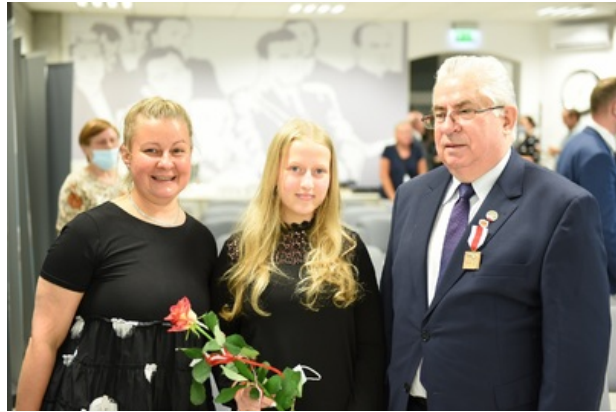
Uroczystość wręczenia nagrody honorowej „Świadek Historii” – Katowice, 5 lipca 2021