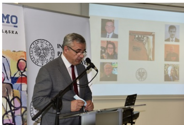
Uroczystość wręczenia nagrody honorowej „Świadek Historii” w Katowicach.