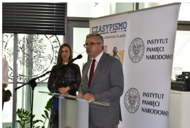
Uroczystość wręczenia nagrody honorowej „Świadek Historii” w Katowicach.