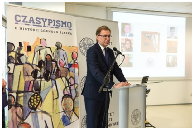
Uroczystość wręczenia nagrody honorowej „Świadek Historii” w Katowicach.