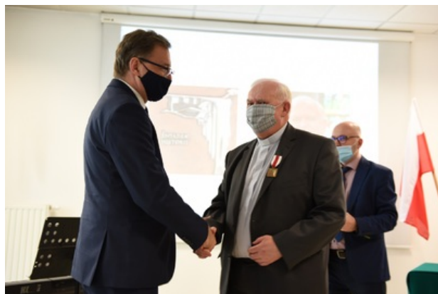
Uroczystość wręczenia nagrody honorowej „Świadek Historii” w Katowicach.