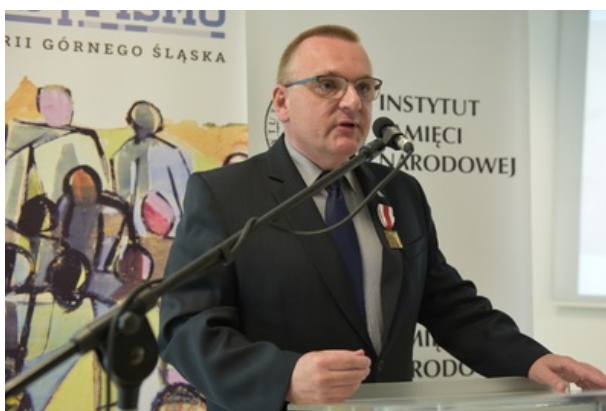
Uroczystość wręczenia nagrody honorowej „Świadek Historii” w Katowicach.