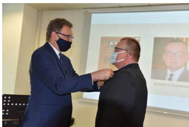
Uroczystość wręczenia nagrody honorowej „Świadek Historii” w Katowicach.