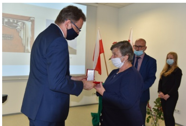
Uroczystość wręczenia nagrody honorowej „Świadek Historii” w Katowicach.