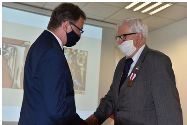
Uroczystość wręczenia nagrody honorowej „Świadek Historii” w Katowicach.