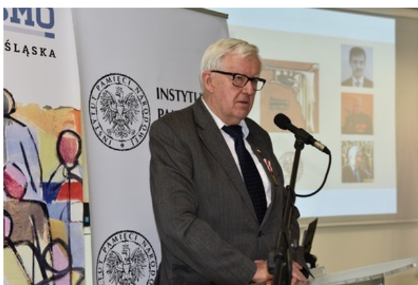
Uroczystość wręczenia nagrody honorowej „Świadek Historii” w Katowicach.