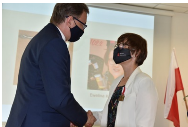
Uroczystość wręczenia nagrody honorowej „Świadek Historii” w Katowicach.