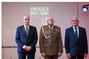
Laureaci honorowego tytułu Instytutu Pamięci Narodowej