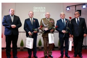
Świadkowie Historii - Laureaci honorowych tytułów Instytutu Pamięci Narodowej