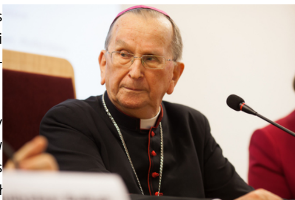
Prymas Polski abp prof. Henryk Muszyński przybliżył znaczenie listu - lub jak sam na konferencji prasowej zaznaczył - orędzia biskupów dla obustronnych relacji.