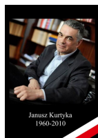
Janusz Kurtyka 1960-2010

Urodził się 13 sierpnia 1960 r. w Krakowie. Absolwent Wydziału Historyczno-Filozoficznego Uniwersytetu Jagiellońskiego. Ukończył studia doktoranckie w Instytucie Historii PAN, gdzie w 1995 r. obronił rozprawę doktorską z zakresu nauk humanistycznych. W 2000 r. uzyskał stopień doktora habilitowanego.