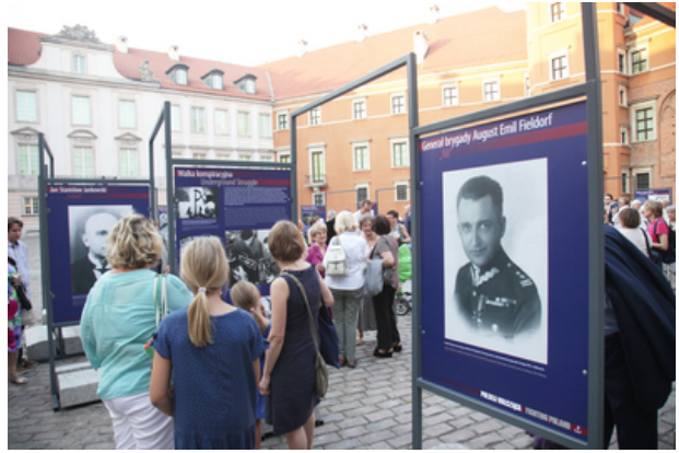
Zwiedzanie wystawy na dziedzińcu Zamku Królewskiego w Warszawie