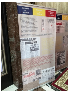
Wystawa towarzysząca promocji książki „Solidarni z Rumunią. Grudzień 1989 - styczeń 1990” - Bukareszt, 19 grudnia 2019