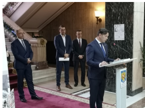
Mihai Cătălin Necula - wiceminister, sekretarz stanu w MSW Rumunii - Bukareszt, 19 grudnia 2019