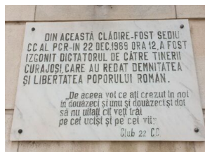
Tablica na budynku Ministerstwa Spraw Wewnętrznych (byłej siedzibie partii)

Podkreślając wagę wspólnych działań IPN i archiwów rumuńskich, dr Szpytma powiedział: - Nasza współpraca trwa już jedenaście lat, w jej trakcie opublikowano dwukrotnie wspomniany album, zorganizowano wystawę, którą dzisiaj mamy możliwość zobaczyć, ale także wydano dwutomową publikację źródłową dotyczącą polskich uchodźców w Rumunii po wrześniu 1939 r. Organizujemy wspólnie konferencje naukowe, planujemy wydanie kolejnych książek dotyczących stosunków polsko-rumuńskich.