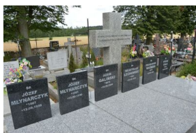
Grób zamordowanych przez Niemców mieszkańców wsi Zubki Małe – po remoncie