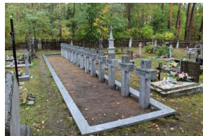
Cmentarz parafialny w Górecku Kościelnym - mogiła zbiorowa żołnierzy Wojska Polskiego, poległych we wrześniu 1939 r.