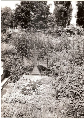
Najwcześniejsze zachowane zdjęcie grobu Emila Walesy