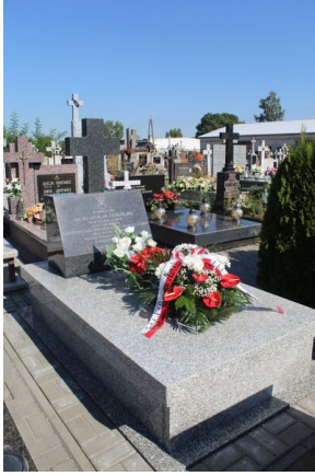
Nowy nagrobek mjr. Władysława Jaskólskiego w Terespolu