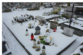
Grób zamordowanych przez Niemców mieszkańców wsi Zubki Małe – przed remontem