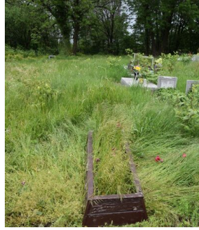
Grób Emila Walesy przed remontem