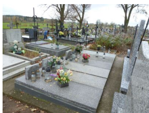
Grób zamordowanych przez Niemców mieszkańców wsi Zubki Małe – przed remontem

Instytut Pamięci Narodowej wykonał prace remontowe przy grobie wojennym mieszkańców wsi Zubki Małe, zamordowanych przez Niemców we wrześniu 1939 r. znajdującym się na cmentarzu parafialnym w Krzemienicy (gm. Czerniewice, pow. tomaszowski, woj. łódzkie). Zdemontowano zniszczony nagrobek wraz z fundamentem i w jego miejsce wykonano nowy – z krzyżem i inskrypcją oraz nazwiskami pomordowanych.