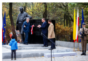
Odsłonięcie pomnika Wojciecha Korfante w Warszawie – 25 października 2019.