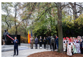
Odsłonięcie pomnika Wojciecha Korfante w Warszawie – 25 października 2019.