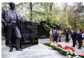
Odsłonięcie pomnika Wojciecha Korfante w Warszawie – 25 października 2019.

Monument stanął u zbiegu ul. Agrykola i Alej Ujazdowskich, w pobliżu pomników innych ojców polskiej niepodległości – Józefa Piłsudskiego, Wincentego Witosa, Ignacego Jana Paderewskiego, Romana Dmowskiego i Ignacego Daszyńskiego.