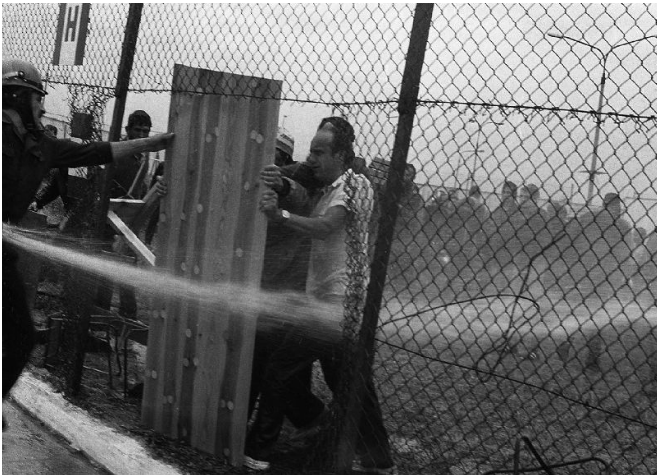
Pacyfikacja protestu internowanych w Kwidzynie 14 sierpnia 1982 roku. W jej wyniku 81 osób zostało dotkliwie pobitych.