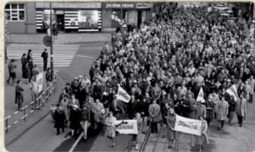
Manifestacja Bąsko-Głębokiej „Solidarność”, Katowice, 11 listopada 1980 r.

Strajki 1980 r. i podpisanie porozumień sierpniowych dały początek Niezależnemu Samorządному Związkowi Zawodowemu „Solidarność”, który szybko stał się wielomilionowym ruchem społecznym. W 1980 r. zaowocowały doświadczenia zgromadzone podczas poprzednich „polskich miesięcy”: Czerwca i Października 1956, Marca 1968, Grudnia 1970 i Czerwca 1976 oraz przeżycie wspólnoty i solidarności w czasie pierwszej pielgrzymki Jana Pawła II do Ojczyzny. Dzięki temu Polska stała się na kilkanaście miesięcy enklawą wolności w całym bloku wschodnim.