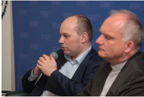
Prezentacja książki „Sprawy, które toczą się w Polsce mają znaczenie światowe” – Warszawa, 7 czerwca 2019.