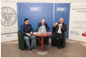
Prezentacja książki „Sprawy, które toczą się w Polsce mają znaczenie światowe” – Warszawa, 7 czerwca 2019.