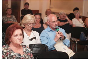
Prezentacja książki „Sprawy, które toczą się w Polsce mają znaczenie światowe” – Warszawa, 7 czerwca 2019.