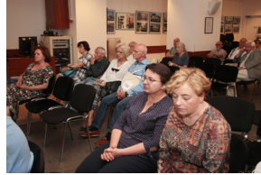
Prezentacja książki „Sprawy, które toczą się w Polsce mają znaczenie światowe” – Warszawa, 7 czerwca 2019.