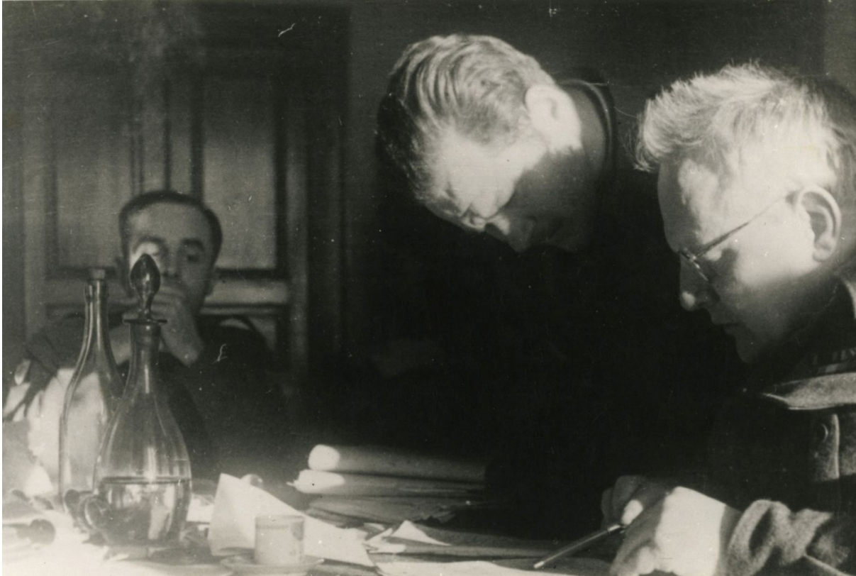
Jerzy Giedroyc, Gustaw Herling-Grudziński i Melchior Wańkowicz, Rzym 1945 r.

Ze zbiorów Instytutu Literackiego Kultura