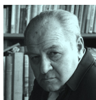
Gustaw Herling-Grudziński i.

pisarz, eseista, krytyk literacki, więzień Gułagu, żołnierz Armii gen. Władysława Andersa - urodził się 20 maja w Kielcach, w spolonizowanej, ale wyznającej judaizm rodzinie żydowskiej, jako Gecel (vel Gustaw) Herling (vel Grudziński), syn Doroty (Dobrysi) z Bryczkowskich i Jakuba (Joska) Herlinga vel Grudzińskiego. Dzieciństwo i młodość spędził w majątku rodzinnym w Suchedniowie i w Kielcach. Ukończył Gimnazjum im. M. Reja w Kielcach, do którego uczęszczał wcześniej Stefan Żeromski.