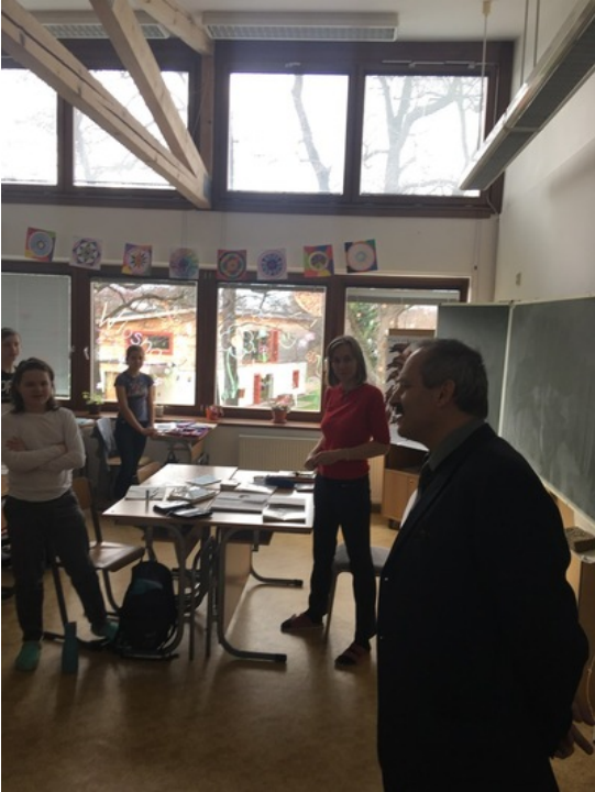
27 marca 2019 r. w Szkole Podstawowej i Przedszkolu im. Jana Kubisza w Gnojniku w