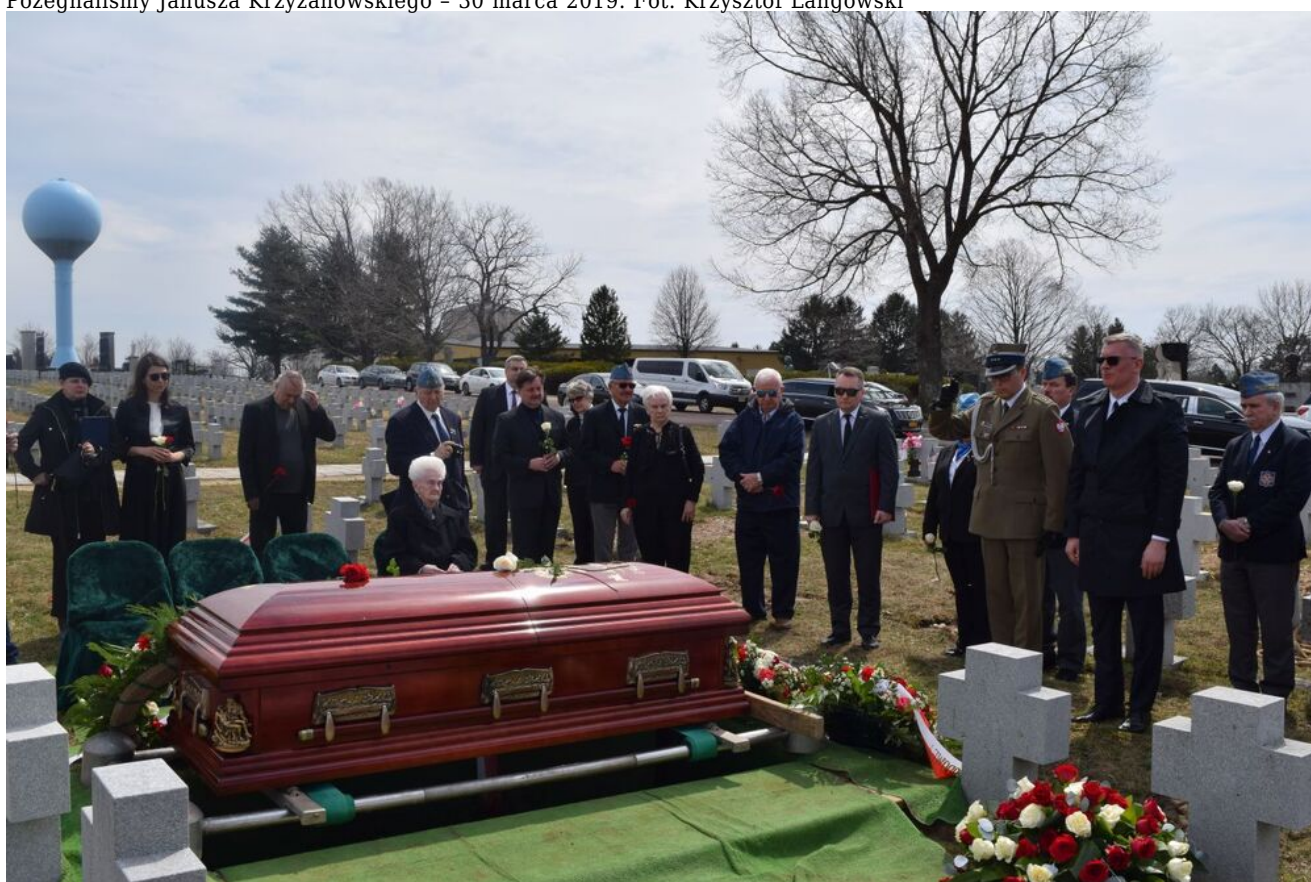
Pożegnaliśmy Janusza Krzyżanowskiego - 30 marca 2019.