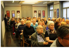
Wykład prof. Krzysztofa Szwagrzyka w Muzeum „Dom Terroru” w Budapeszcie - 7 marca 2019