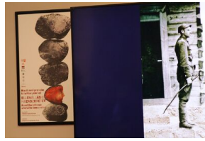
Wykład prof. Krzysztofa Szwagrzyka w Muzeum „Dom Terroru” w Budapeszcie - 7 marca 2019