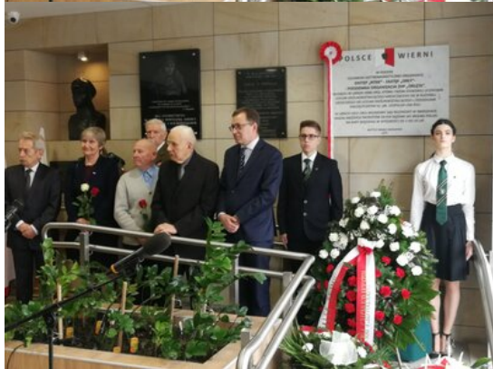
W piątek 1 marca 2019 r. w XIII Liceum Ogólnokształcącym z Oddziałami Dwujęzycznymi im. płk. Leopolda Lisa-Kuli przy ul. Oszmiańskiej 23/25 w Warszawie odbyło się uroczyste odsłonięcie tablicy w hołdzie członkom antykomunistycznej organizacji Zastęp „Rysie” - Zastęp „Orły” - Podziemna