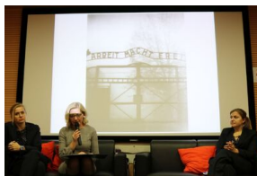
IPN na uroczystościach poświęconych ofiarom obozów koncentracyjnych – Bari, 21 stycznia 2019.

Instytut Pamięci Narodowej w październiku 2019 planuje kolejną wspólną inicjatywę z