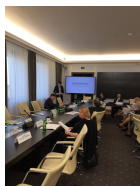
Konferencja popularnonaukowa „Odbudowa państwa polskiego - prawo i polityka historyczna po 1918 roku” w Senacie RP - Warszawa, 6 listopada 2018