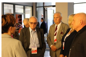
Przedstawiciele organizacji polonijnych biorący udział w Światowym Zjeździe Polonii i Polaków z Zagranicy odwiedzili Archiwum IPN.

Archiwiści zaprezentowali cenne dokumenty przejęte do zasobu IPN w ramach projektu Archiwum Pełne Pamięci i przechowywane w Instytucie materiały fotograficzne. Goście wzięli także udział w warsztatach z wykorzystaniem dokumentów Centrum Udzielania Informacji o Ofiarach II Wojny Światowej .