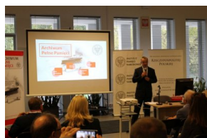
Przedstawiciele organizacji polonijnych biorący udział w Światowym Zjeździe Polonii i Polaków z Zagranicy odwiedzili Archiwum IPN.