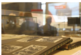
Przedstawiciele organizacji polonijnych biorący udział w Światowym Zjeździe Polonii i Polaków z Zagranicy odwiedzili Archiwum IPN.