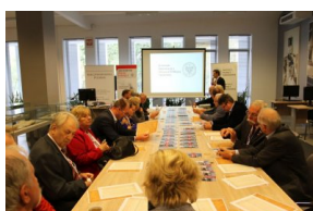
Przedstawiciele organizacji polonijnych biorący udział w Światowym Zjeździe Polonii i Polaków z Zagranicy odwiedzili Archiwum IPN.