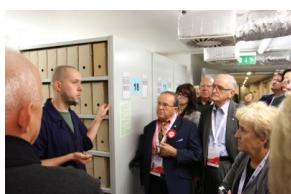
Przedstawiciele organizacji polonijnych biorący udział w Światowym Zjeździe Polonii i Polaków z Zagranicy odwiedzili Archiwum IPN.