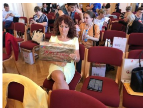
Uczestnicy Zjazdu otrzymali materiały edukacyjne IPN.

Od dwunastu lat Biuro Edukacji Narodowej IPN realizuje „Program Polonijny” , którego odbiorcami są Polacy i Polonia mieszkający poza granicami kraju. Naszym głównym celem jest upowszechnianie wiedzy na temat najnowszej historii Polski. W ramach „Programu Polonijnego” BEN IPN nawiązujemy kontakty z polonijnymi placówkami oświatowymi, prezentując ofertę edukacyjną, prowadząc lekcje i warsztaty dla uczniów oraz szkolenia dla nauczycieli, organizując prezentacje wystaw historycznych. Zachęcamy także środowiska polonijne do udziału w przedsięwzięciach edukacyjnych IPN, takich jak programy edukacyjne, konkursy czy akcje rocznicowe. Wspieramy działania organizacji i instytucji zajmujących się współpracą z Polonią i Polakami poza granicami kraju, m.in. Stowarzyszenia Wspólnota Polska, Fundacji Pomoc Polakom na Wschodzie, Ośrodka Rozwoju Polskiej Edukacji za Granicą, udostępniając bezpłatnie nasze publikacje i wystawy – chociażby na V Światowy Zjazd Polonii i Polaków z Zagranicy, który właśnie odbywa się w Warszawie.