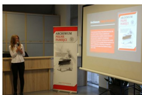
Przedstawiciele organizacji polonijnych biorący udział w Światowym Zjeździe Polonii i Polaków z Zagranicy odwiedzili Archiwum IPN.