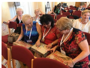
Uczestnicy Zjazdu otrzymali materiały edukacyjne IPN.