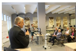
Przedstawiciele organizacji polonijnych biorący udział w Światowym Zjeździe Polonii i Polaków z Zagranicy odwiedzili Archiwum IPN.