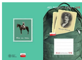
Mój pierwszy zeszyt