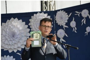
„Mój pierwszy zeszyt”. Inauguracja projektu IPN dla pierwszoklasistów – Szkoła Podstawowa w Czartajewie, 3 września 2018