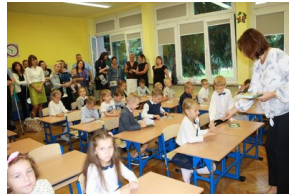
Akcja „Mój pierwszy zeszyt” w Szkole Podstawowej nr 31 im. Kazimierza Pułaskiego w Rzeszowie – 3 września 2018