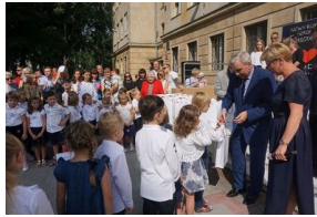
„Mój pierwszy zeszyt”. Inauguracja projektu IPN dla pierwszoklasistów – Szkoła Podstawowa nr 158 im. Jana Kilińskiego w Warszawie, 3 września 2018