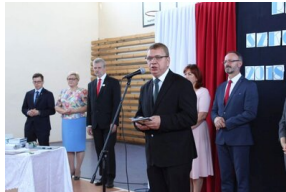
„Mój pierwszy zeszyt”. Inauguracja projektu IPN dla pierwszoklasistów – Szkoła Podstawowa – Krokowa, 3 września 2018