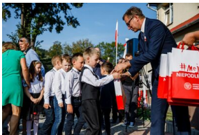
Inauguracja roku szkolnego w Stróżu (powiat limanowski) z uczestnictwem Prezesa IPN Jarosława Szarka – 3 września 2018.