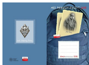
Mój pierwszy zeszyt