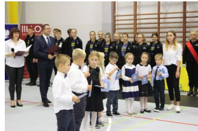
„Mój pierwszy zeszyt”. Inauguracja projektu IPN dla pierwszoklasistów – Gniezno, 3 września 2018