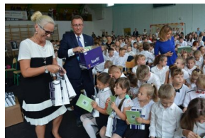
Wojewódzka inauguracja roku szkolnego w Wolborzu – 3 września 2018

Akcję zorganizowały oddziały IPN w całej Polsce. Na Dolnym Śląsku i Opolszczyźnie uczniowie otrzymali zeszyt do języka polskiego z wizerunkiem Ignacego Jana Paderewskiego. Zeszyty w najbliższym czasie otrzyma blisko 40 tysięcy pierwszoklasistów. Przedstawiciele oddziału wrocławskiego wzięli udział w inauguracji roku szkolnego w Lutyni, Wałbrzychu, Głuszycy, Borowej, Świętej Katarzynie, Oleśnicy, Wrocławiu, Nysie i Opolu.