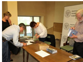
„Mój pierwszy zeszyt”. Inauguracja projektu IPN dla pierwszoklasistów – Bielesko-Błota, 28 sierpnia 2018