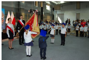
„Mój pierwszy zeszyt”. Inauguracja projektu IPN dla pierwszoklasistów – Lutynia, 3 września 2018