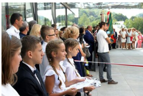
„Mój pierwszy zeszyt”. Inauguracja projektu IPN dla pierwszoklasistów – Kazimierz Dolny, 3 września 2018