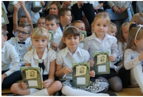
„Mój pierwszy zeszyt”. Inauguracja projektu IPN dla pierwszoklasistów – Dębno, 3 września 2018