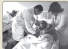
Pozbawieni w wyniku rozpylenia gazu, październik 1981 r.

Jesienią 1981 r. w rejonie miłej miejscowości wymierzone w „Solidarność”, 20 października po likwidacji przez milicję punktu sprzedaży prasy związkowej na Rynku w Katowicach wybuchły zamieszki, w których uczestniczyło około 3 tys. osób. Siedem dni później „nieznani sprawcy” rozpylili gaz przed kopalnią „Sosnowiec” w Sosnowcu, w wyniku czego do szpitala z objawami zatrucia trafiło kilkadziesiąt osób.