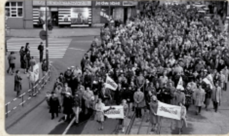
Manifestacja w hucie „Solidarność”, Katowice, 11 listopada 1980 r.

Strajki 1980 r. i podpisanie porozumień sierpniowych dały początek Niezależnemu Samorządnemu Związkowi Zawodowemu „Solidarność”, który szybko stał się wielomilionowym ruchem społecznym. W 1980 r. zainicjowały doświadczenia zgromadzone podczas poprzednich „półkich miesięcy”: Czerwca i Października 1966, Marca 1968, Grudnia 1970 i Czerwca 1976 oraz przeżycie wspólnoty i solidarności w czasie pierwszej pielgrzymki Jana Pawła II do Ojczyzny. Dzięki temu Polska stała się na kilkanaście miesięcy enklawą wolności w całym bloku wschodnim.