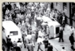
Okolice kopalni „Sosnowiec” po szczepieniu gazu, październik 1981 r.