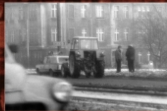
Strajki organizowane przez MNZ na rolniczych wsiach miały zapobiegać wyparciu chłopów z obszarów rolniczych