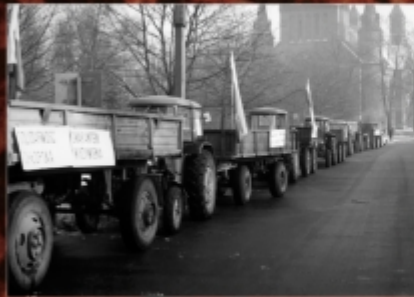
Strajki obywatelskie rolników organizowane przez rolników z oblaty Inowrocławia w lutym 1981 r.