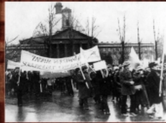
Manifestacja rolników indywidualnych Bydgoszczy (ulica Zamkowa, Pałac pał. kr. Władysława a Pałacu - Stary Rynek w Bydgoszczy), 8 II 1981 r.