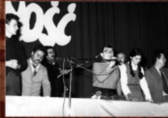
Prezesa Anna Walentynowicz