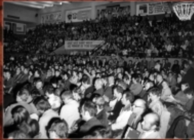
Wielki wiec w hali „Astoria”