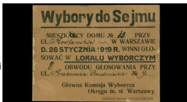
Ulotka informacyjna z 1919 r.