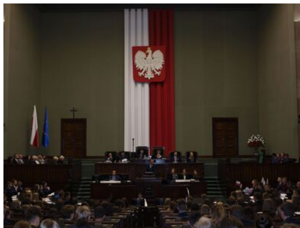
Obrady XXIII Sesji Sejmu Dzieci i Młodzieży, przemawia prezes IPN dr Jarosław Szarek

Głównym celem projektu jest przekazanie jego uczestnikom wiedzy na temat zasad funkcjonowania Sejmu Rzeczypospolitej Polskiej oraz procesu legislacyjnego. Tegoroczna sesja ma też za zadanie przybliżyć młodzieży historię polskiego parlamentaryzmu w czasach II RP. Dodatkowo intencją organizatorów jest promowanie wśród młodych ludzi