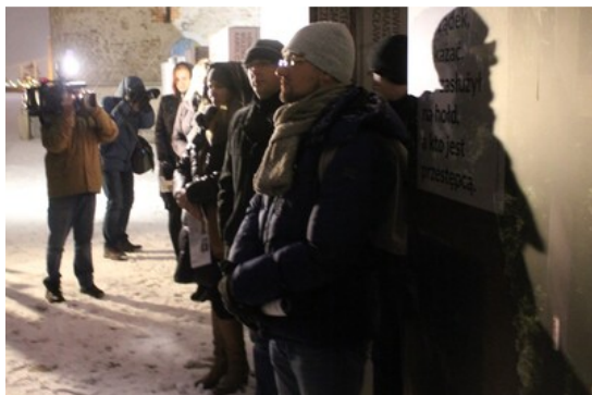
4 cichoemnych 13 uczestnikow wojny polsko-bolszewickiej 1920 r.