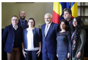
Spotkanie polsko-rumuńskiej grupy roboczej Archiwum IPN i Narodowych Archiwów Rumunii - Bukareszt, 5 grudnia 2017