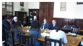
Spotkanie polsko-rumuńskiej grupy roboczej Archiwum IPN i Narodowych Archiwów Rumunii - Bukareszt, 5 grudnia 2017