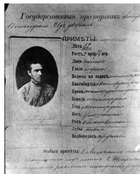
List gończy za Józefem Piłsudskim, wystawiony przez carską policję, 1887.