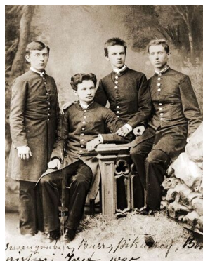
Józef Piłsudski (trzeci od lewej), 1885. Kółko samokształceniowe "Spójnia" w gimnazjum wileńskim