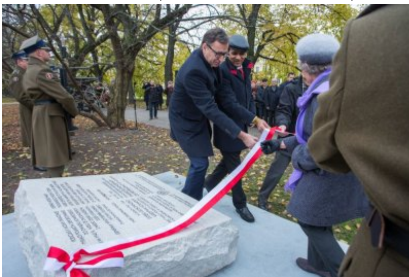
Odślonięcie tablicy wdzięczności wobec władz i mieszkańców księstwa Kolhapur w Indiach - Warszawa, 10 listopada 2017.