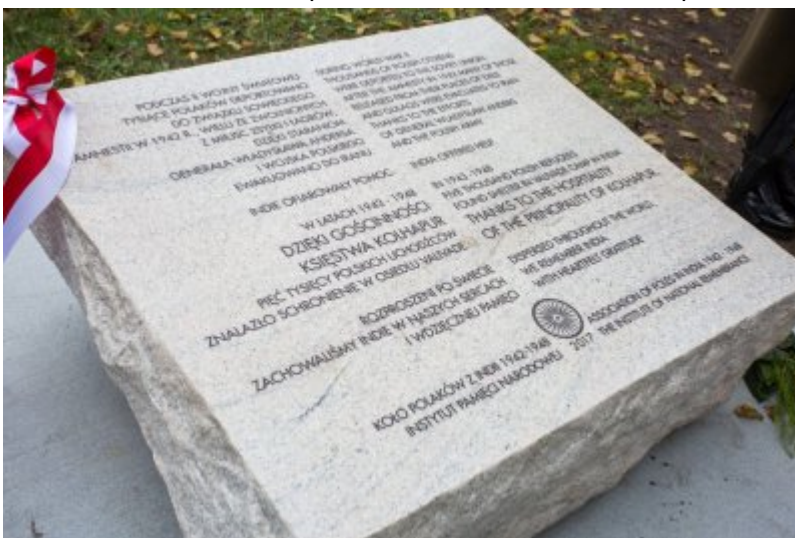
Odśnięcie tablicy wdzięczności wobec władz i mieszkańców księstwa Kolhapur w Indiach – Warszawa, 10 listopada 2017.