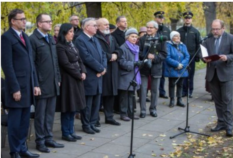
Odślonięcie tablicy wdzięczności wobec władz i mieszkańców księstwa Kolhapur w Indiach – Warszawa, 10 listopada 2017.