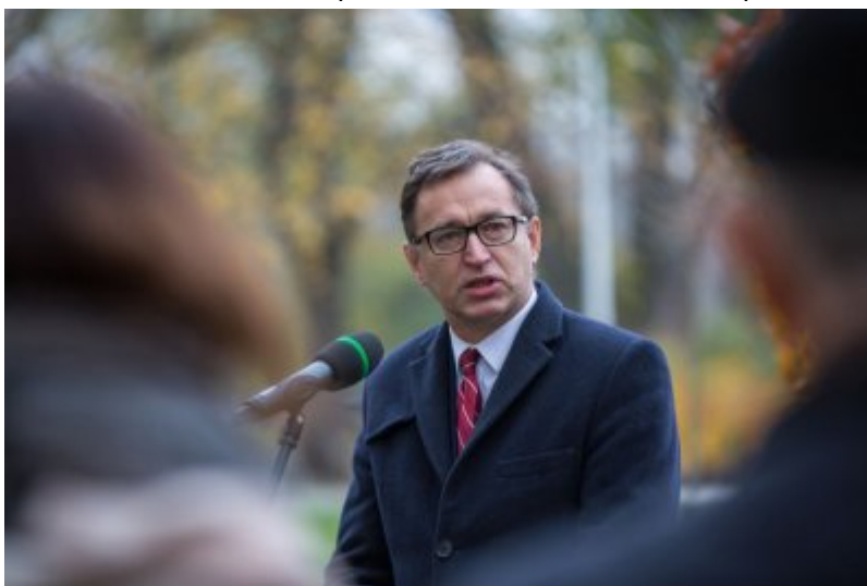
Odślonięcie tablicy wdzięczności wobec władz i mieszkańców księstwa Kolhapur w Indiach - Warszawa, 10 listopada 2017.