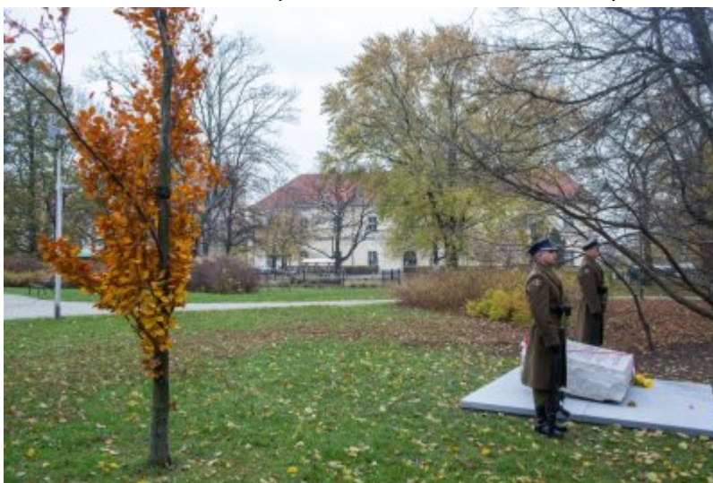
Odślonienie tablicy wdzięczności wobec władz i mieszkańców księstwa Kolhapur w Indiach – Warszawa, 10 listopada 2017.