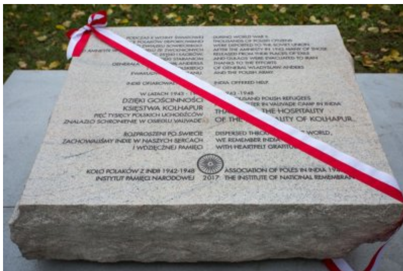
Odsłonięcie tablicy wdzięczności wobec władz i mieszkańców księstwa Kolhapur w Indiach – Warszawa, 10 listopada 2017.