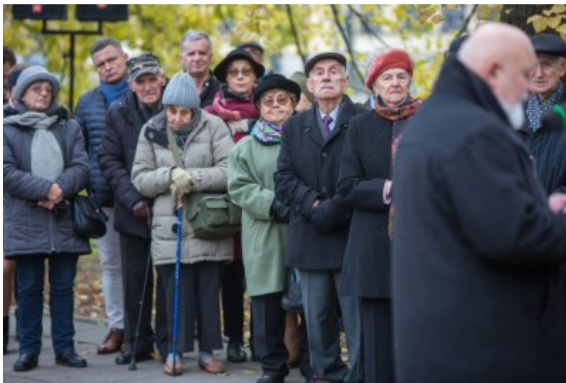
Odślonięcie tablicy wdzięczności wobec władz i mieszkańców księstwa Kolhapur w Indiach - Warszawa, 10 listopada 2017.