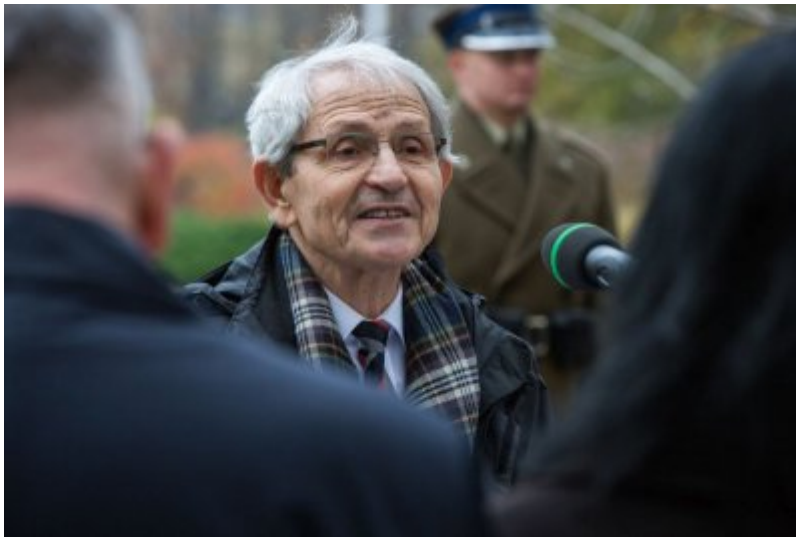
Odślonięcie tablicy wdzięczności wobec władz i mieszkańców księstwa Kolhapur w Indiach - Warszawa, 10 listopada 2017.