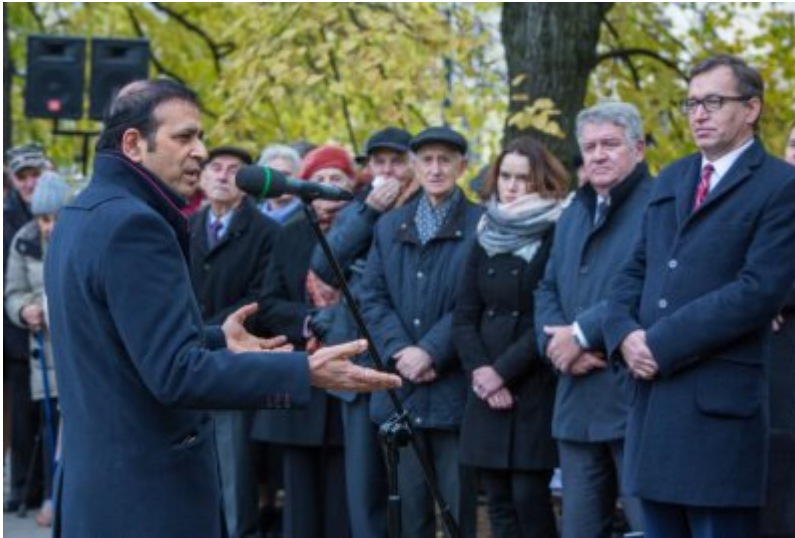
Odśnięcie tablicy wdzięczności wobec władz i mieszkańców księstwa Kolhapur w Indiach – Warszawa, 10 listopada 2017.