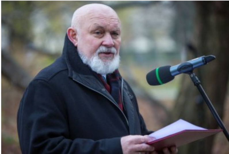
Odślonięcie tablicy wdzięczności wobec władz i mieszkańców księstwa Kolhapur w Indiach - Warszawa, 10 listopada 2017.