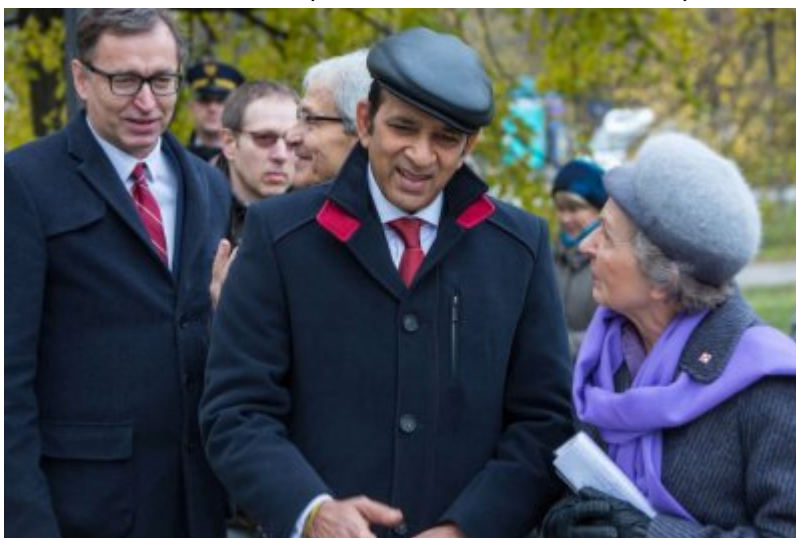
Odślonięcie tablicy wdzięczności wobec władz i mieszkańców księstwa Kolhapur w Indiach - Warszawa, 10 listopada 2017.