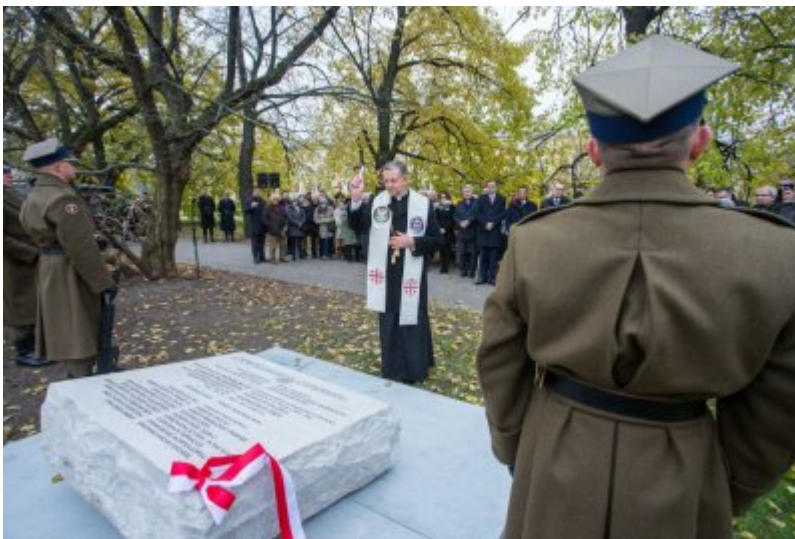
Odśnięcie tablicy wdzięczności wobec władz i mieszkańców księstwa Kolhapur w Indiach – Warszawa, 10 listopada 2017.