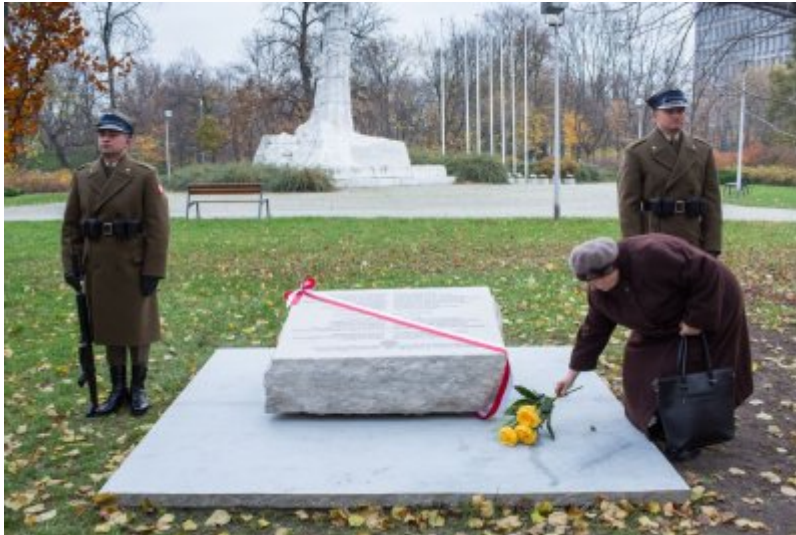
Odślonienie tablicy wdzięczności wobec władz i mieszkańców księstwa Kolhapur w Indiach – Warszawa, 10 listopada 2017.