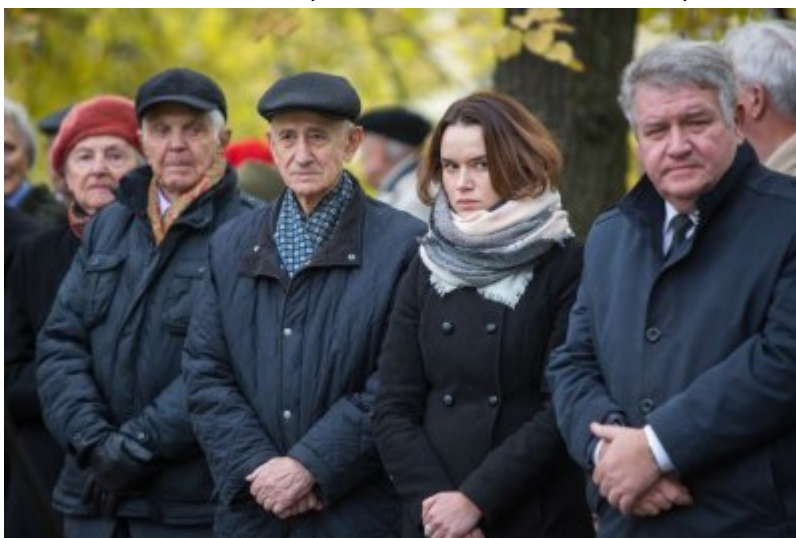
Odślonienie tablicy wdzięczności wobec władz i mieszkańców księstwa Kolhapur w Indiach – Warszawa, 10 listopada 2017.