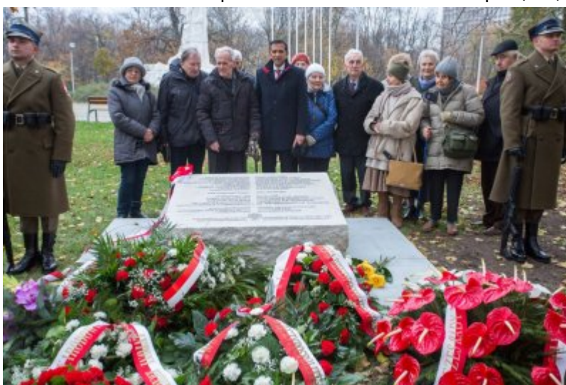
Odślonięcie tablicy wdzięczności wobec władz i mieszkańców księstwa Kolhapur w Indiach – Warszawa, 10 listopada 2017.