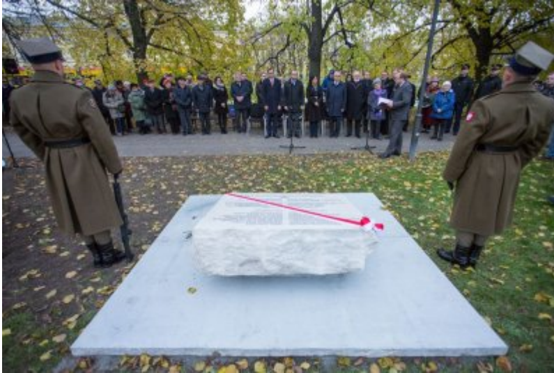
Odślonięcie tablicy wdzięczności wobec władz i mieszkańców księstwa Kolhapur w Indiach – Warszawa, 10 listopada 2017.