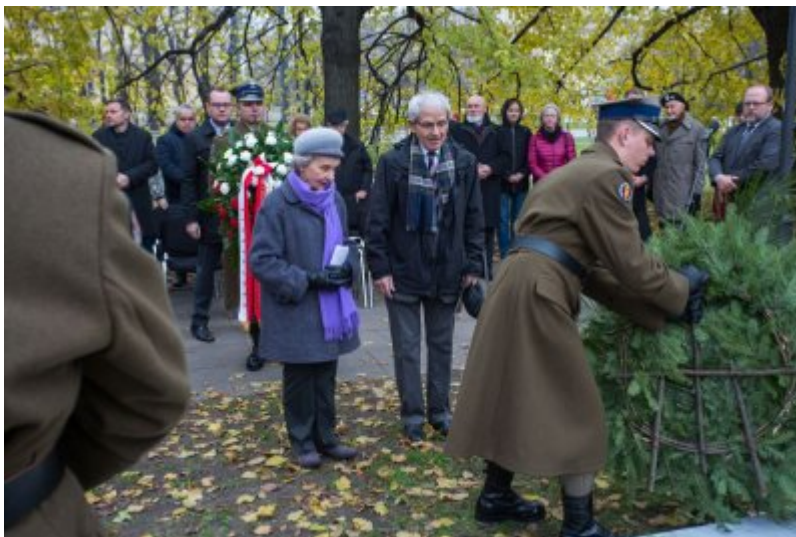
Odślonięcie tablicy wdzięczności wobec władz i mieszkańców księstwa Kolhapur w Indiach – Warszawa, 10 listopada 2017.