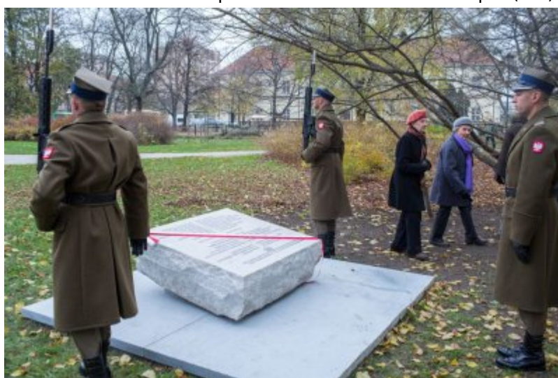
Odsłonięcie tablicy wdzięczności wobec władz i mieszkańców księstwa Kolhapur w Indiach – Warszawa, 10 listopada 2017.