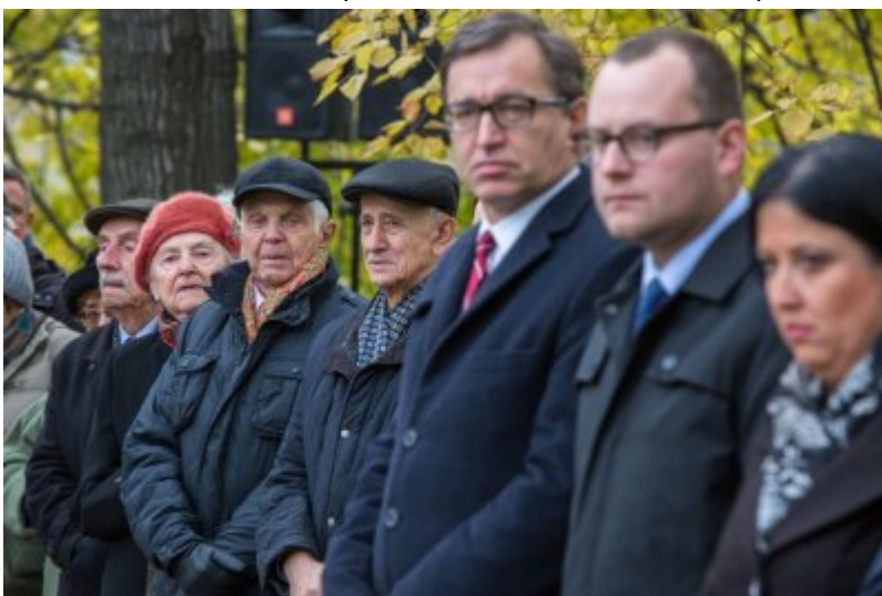
Odślonięcie tablicy wdzięczności wobec władz i mieszkańców księstwa Kolhapur w Indiach – Warszawa, 10 listopada 2017.