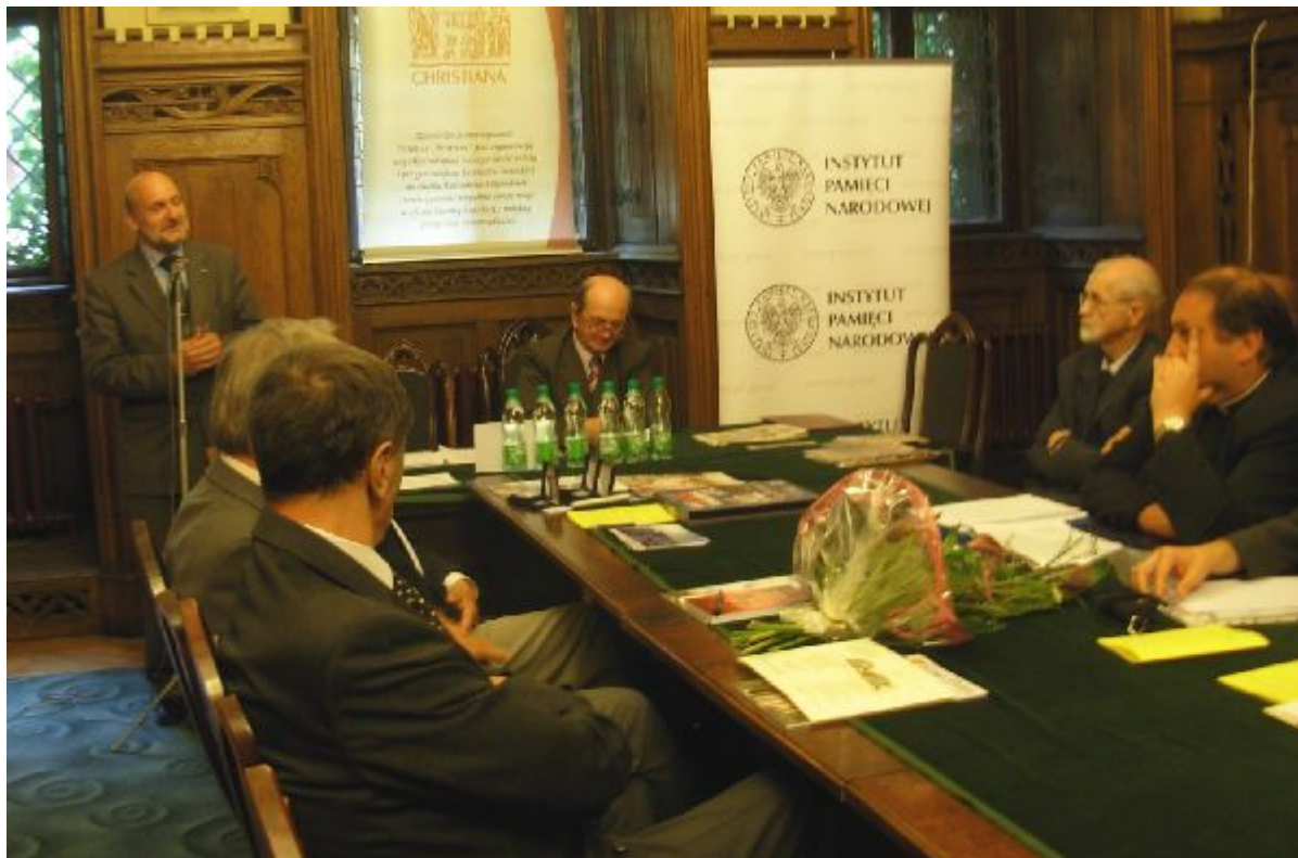
Konferencja odbyła się w Muzeum Archidiecezjalnym we Wrocławiu