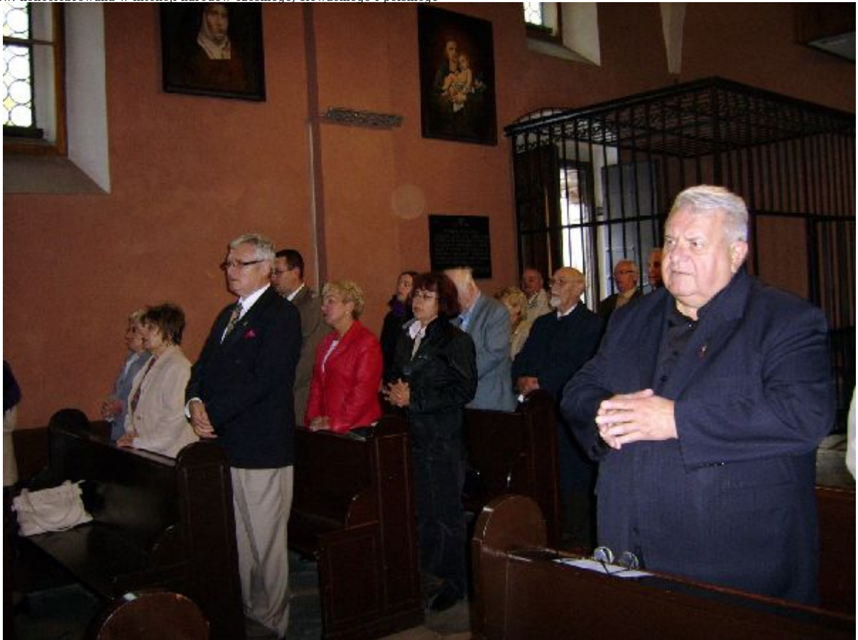
Kościół św. Idziego