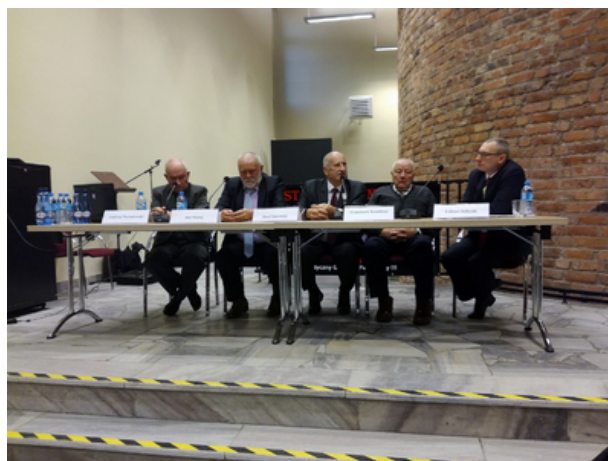
Panel dyskusyjny z udziałem przywódców strajków w