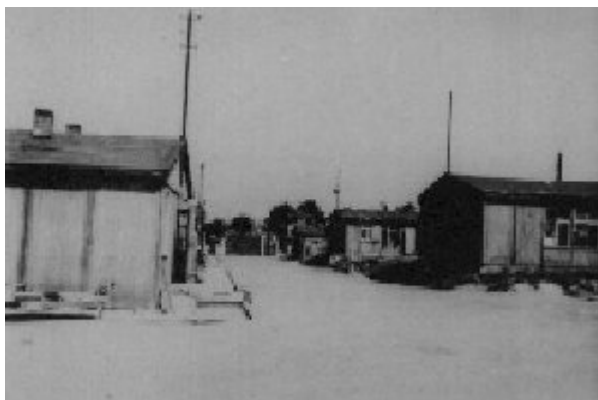
lekcje na temat "Zbrojne Podziemie Niepodległościowe na Mazowszu i Podlasiu 1944-1954". 4