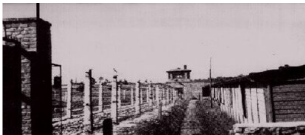
lekcje na temat "Zbrojne Podziemie Niepodległościowe na Mazowszu i Podlasiu 1944-1954". 3