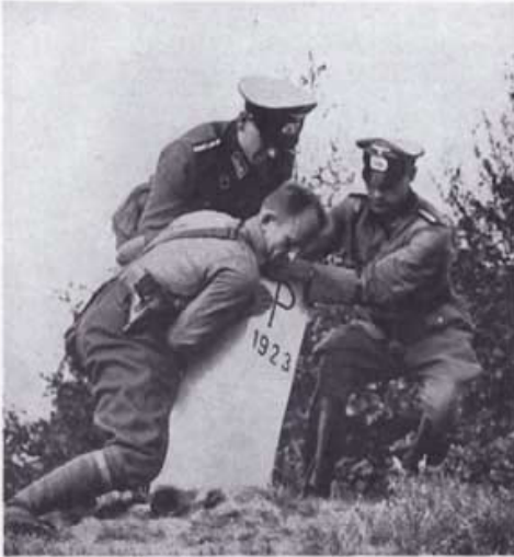
Usuwanie polskich słupów granicznych, wrzesień 1939 r.