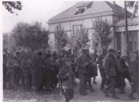
Żołnierze polscy w niewoli niemieckiej, Poznań 1939 r.