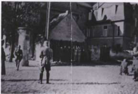
Egzekucja 15 mieszkańców, Kórnik, 20 X 1939 r.