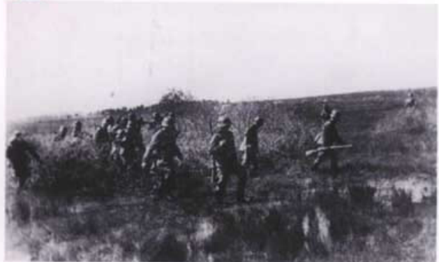
Einsatzkommando w akcji