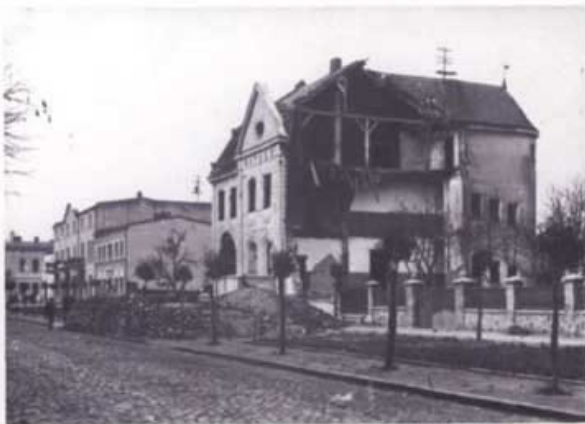
Ratusz w Wągrowcu zniszczony we wrześniu 1939 r.

Wielkopolska pozostała na uboczu głównego uderzenia sił niemieckich. Armia „Poznań” wycofała się w głąb kraju. W ślad za nią ewakuowały się władze cywilne. Dla zapewnienia porządku mieszkańcy samodzielnie powoływali komitety obywatelskie. Organizowały one oddziały straży obywatelskiej, które stawiły opór wkraczającym wojskom niemieckim. Wielu Polaków zginęło w beznadziejnej walce.