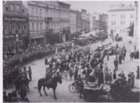
Wkroczenie wojsk niemieckich do Leszna, wrzesień 1939 r.