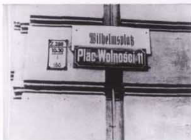
Smiana narwy Placu Wolności, Poznań, wrzesień 1939 r.