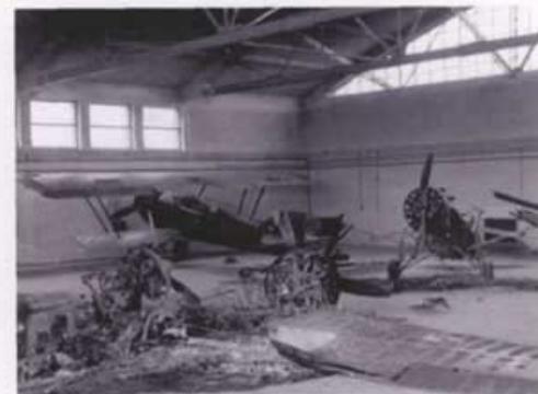
Zniszczone polskie samoloty na lotnisku Ławica w Poznaniu, wrzesień 1939 r.