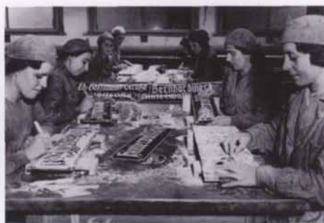
Wyrób tablic z niemieckimi nazwami ulic, Poznań, październik 1939 r.