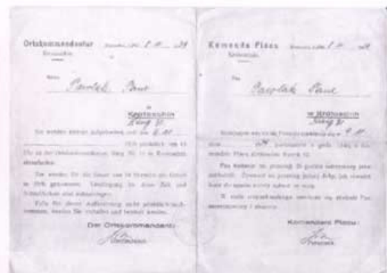
Werwanie zakładnika, Krotoszyn, listopad 1939 r.