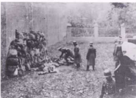
Egzekucja Polaków przy murze więziennym, Leszno, październik 1939 r.

Grabież polskiego mienia przybrała tak znaczne rozmiary, że niemiecki dowódca poznańskiego okręgu wojskowego już we wrześniu 1939 r. wydał zakaz rekwizycji bez pozwolenia władz.