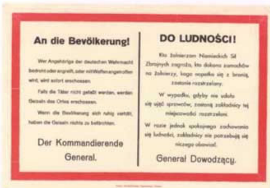
Obwieszczenie władz okupacyjnych, wrzesień 1939 r.