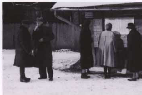
Polacy czytają obwieszczenie, Leszno