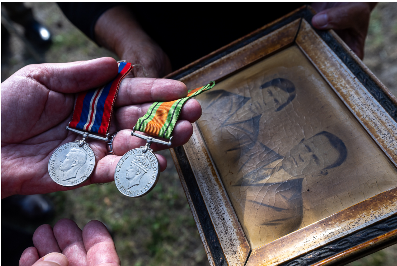
Upamiętnienie żołnierzy 2 Korpusu Polskiego gen. Władysława Andersa - Kolbark, 4 lipca 2026 r.