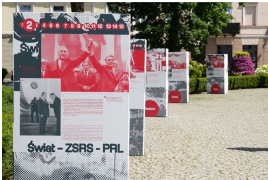
Wystawa „Polski protest 1976” w Radomiu