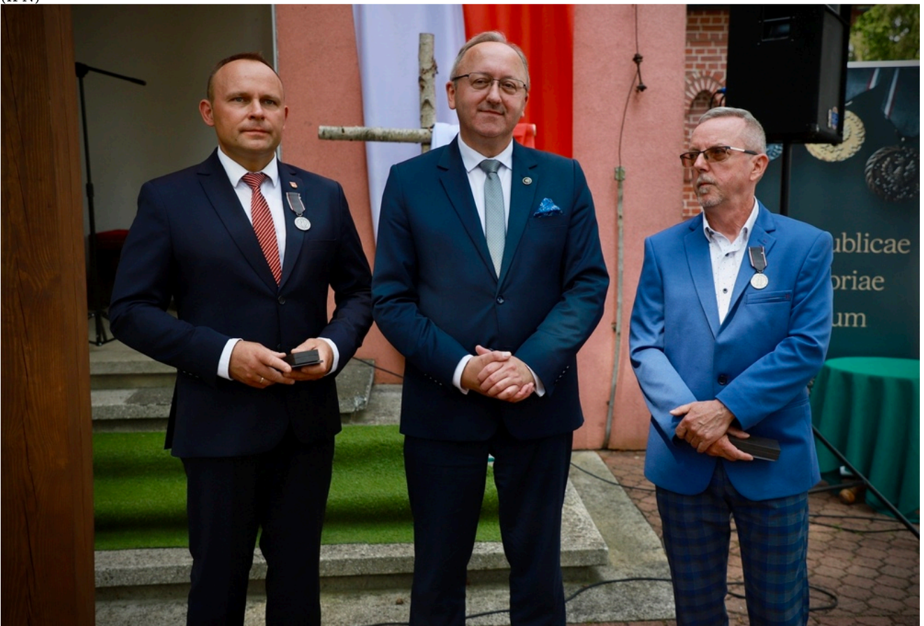
Uroczystości w hołdzie poległym w bitwie pod Czerwonym Borem - Wygoda, 21 czerwca 2026.