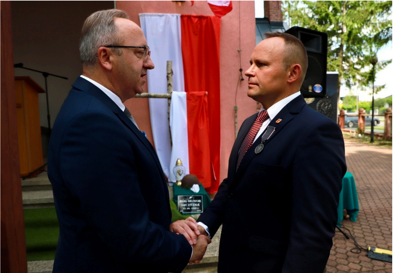
Uroczystości w hołdzie poległym w bitwie pod Czerwonym Borem - Wygoda, 21 czerwca 2026.