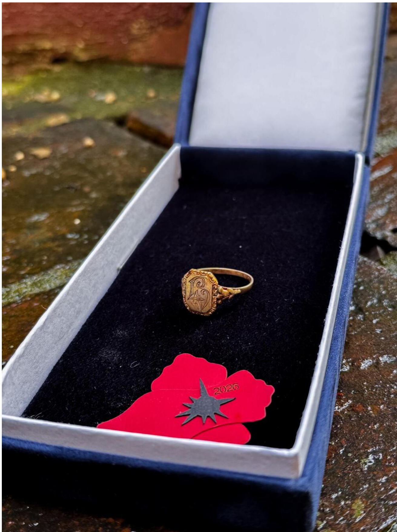
Uroczystości pogrzebowe czechosłowackiego żandarma Viléma Lehera - Vrbno, 16 czerwca 2026.