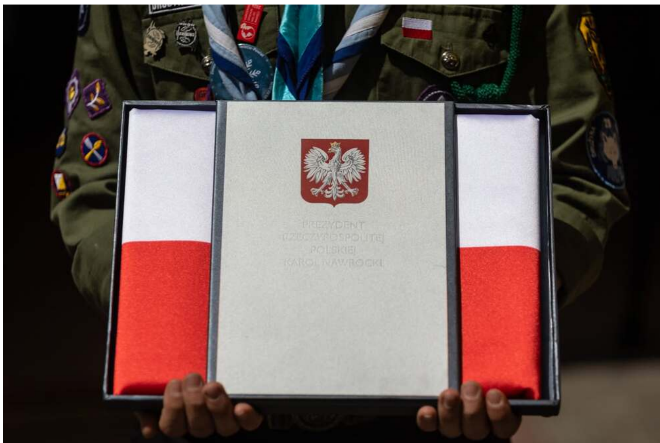
Bieg Pamięci w Lipinkach, 13 czerwca 2026