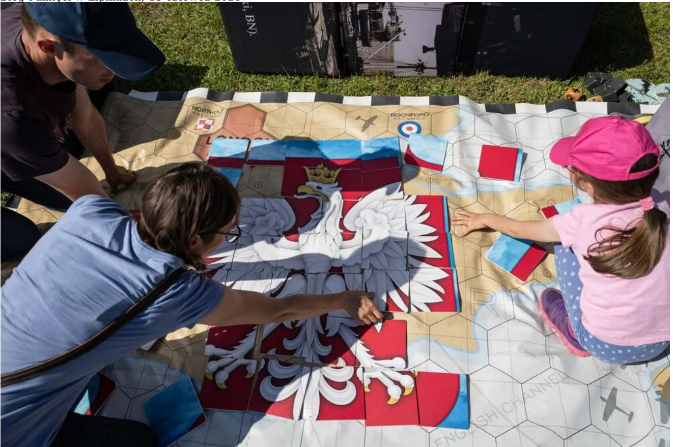
Bieg Pamięci w Lipinkach, 13 czerwca 2026