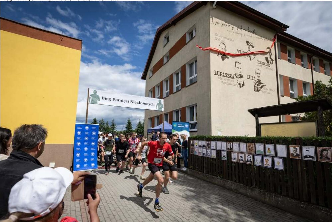
Bieg Pamięci w Lipinkach, 13 czerwca 2026