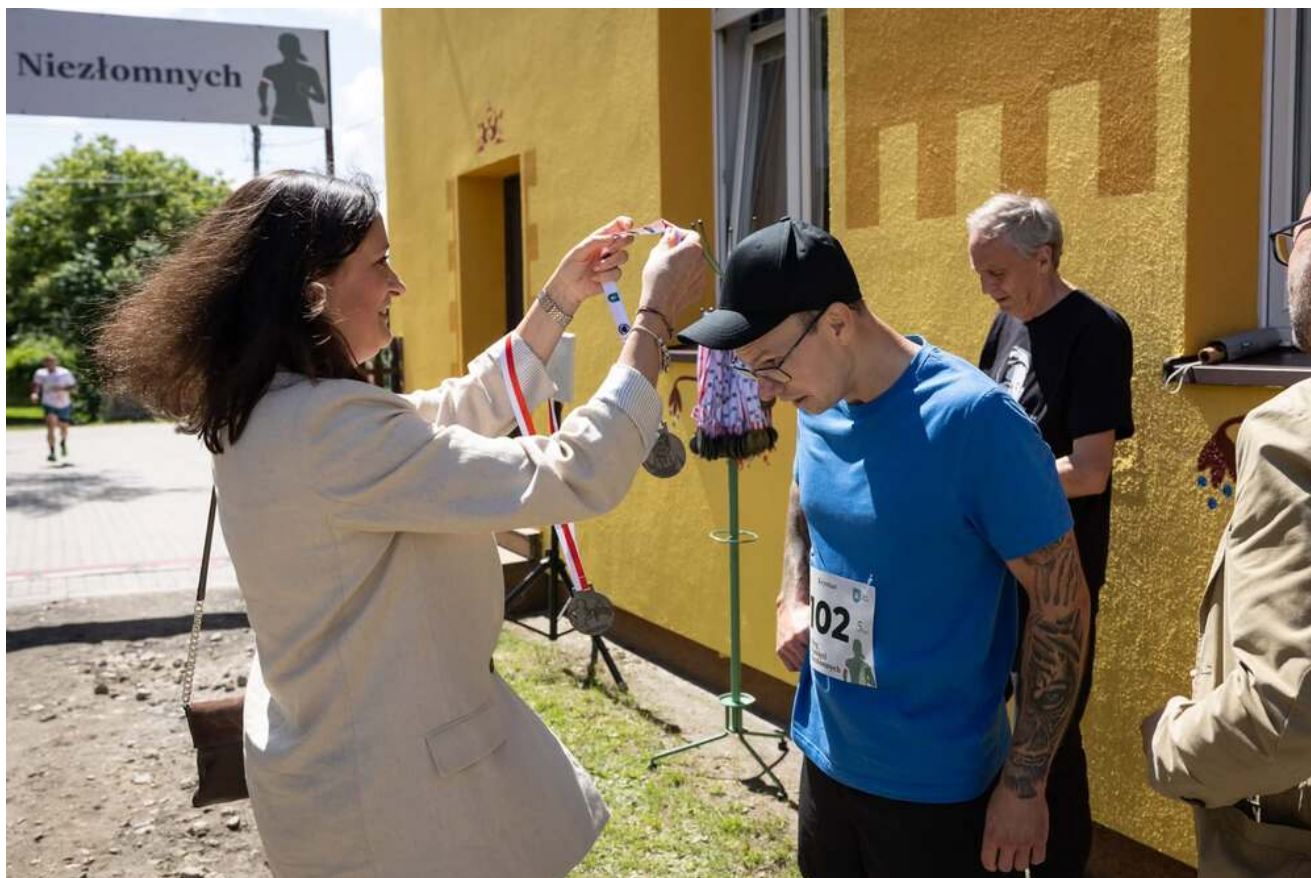
Bieg Pamięci w Lipinkach, 13 czerwca 2026