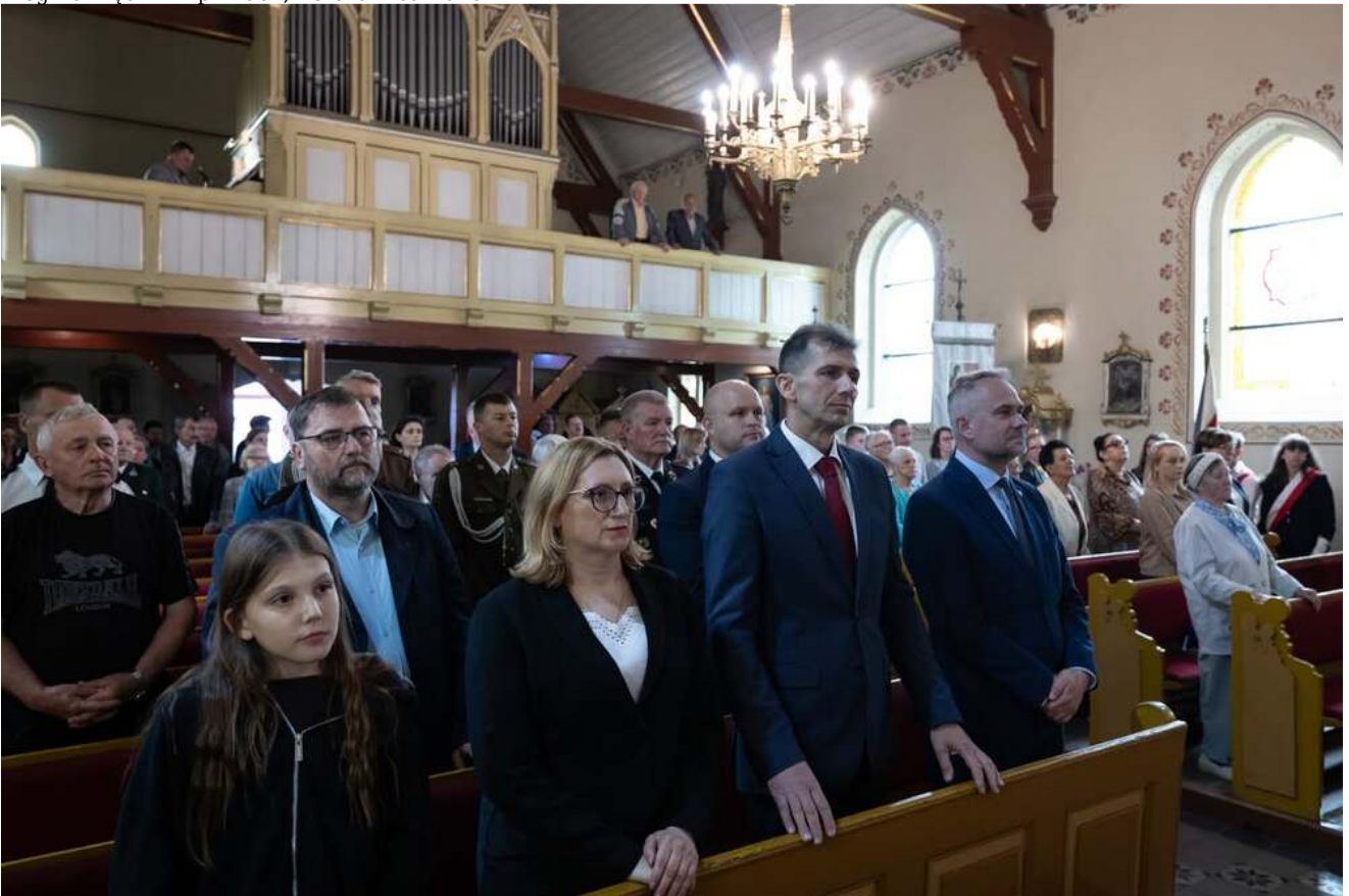
Bieg Pamięci w Lipinkach, 13 czerwca 2026