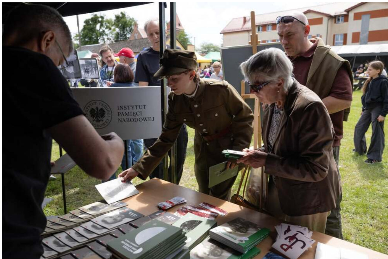
Bieg Pamięci w Lipinkach, 13 czerwca 2026