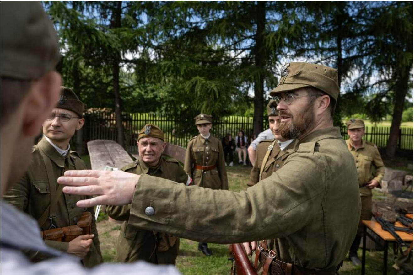
Bieg Pamięci w Lipinkach, 13 czerwca 2026