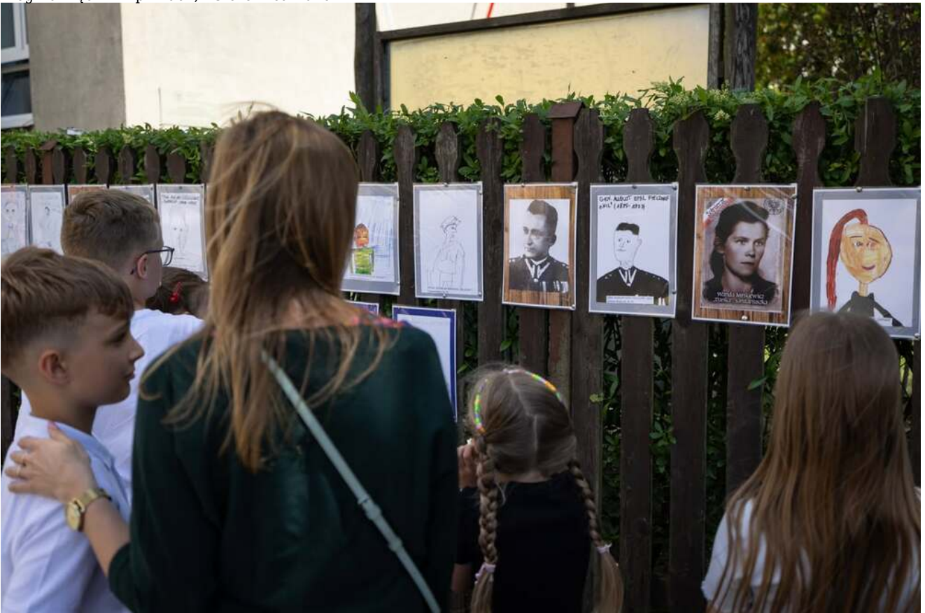
Bieg Pamięci w Lipinkach, 13 czerwca 2026