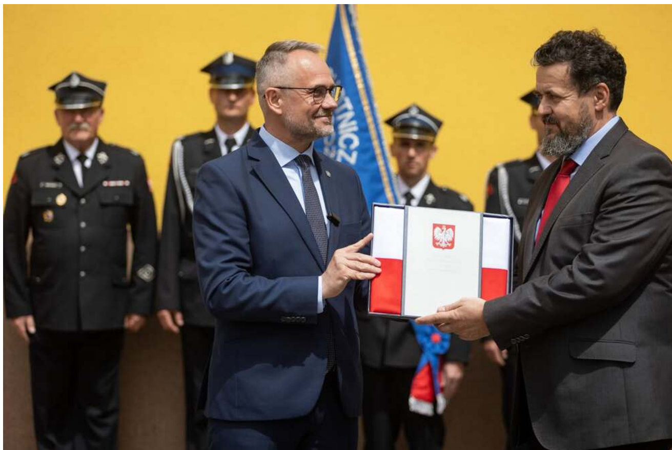
Bieg Pamięci w Lipinkach, 13 czerwca 2026