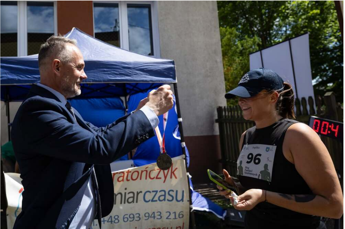
Bieg Pamięci w Lipinkach, 13 czerwca 2026