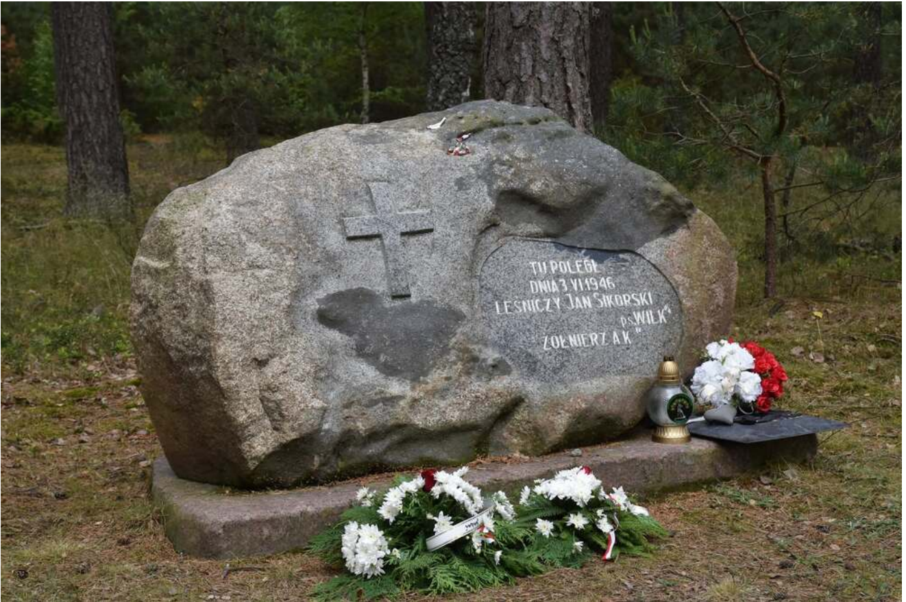
Bieg Pamięci w Lipinkach, 13 czerwca 2026