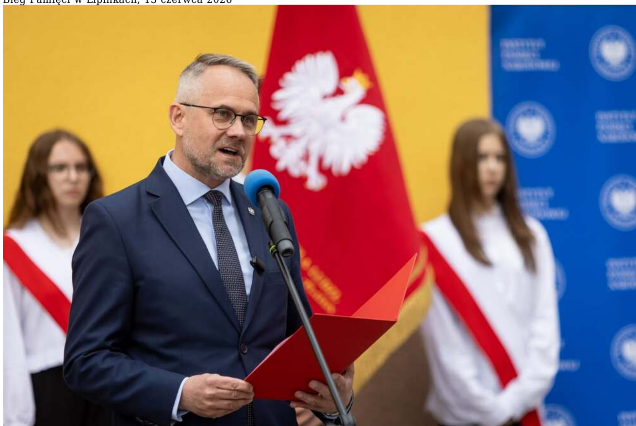
Bieg Pamięci w Lipinkach, 13 czerwca 2026