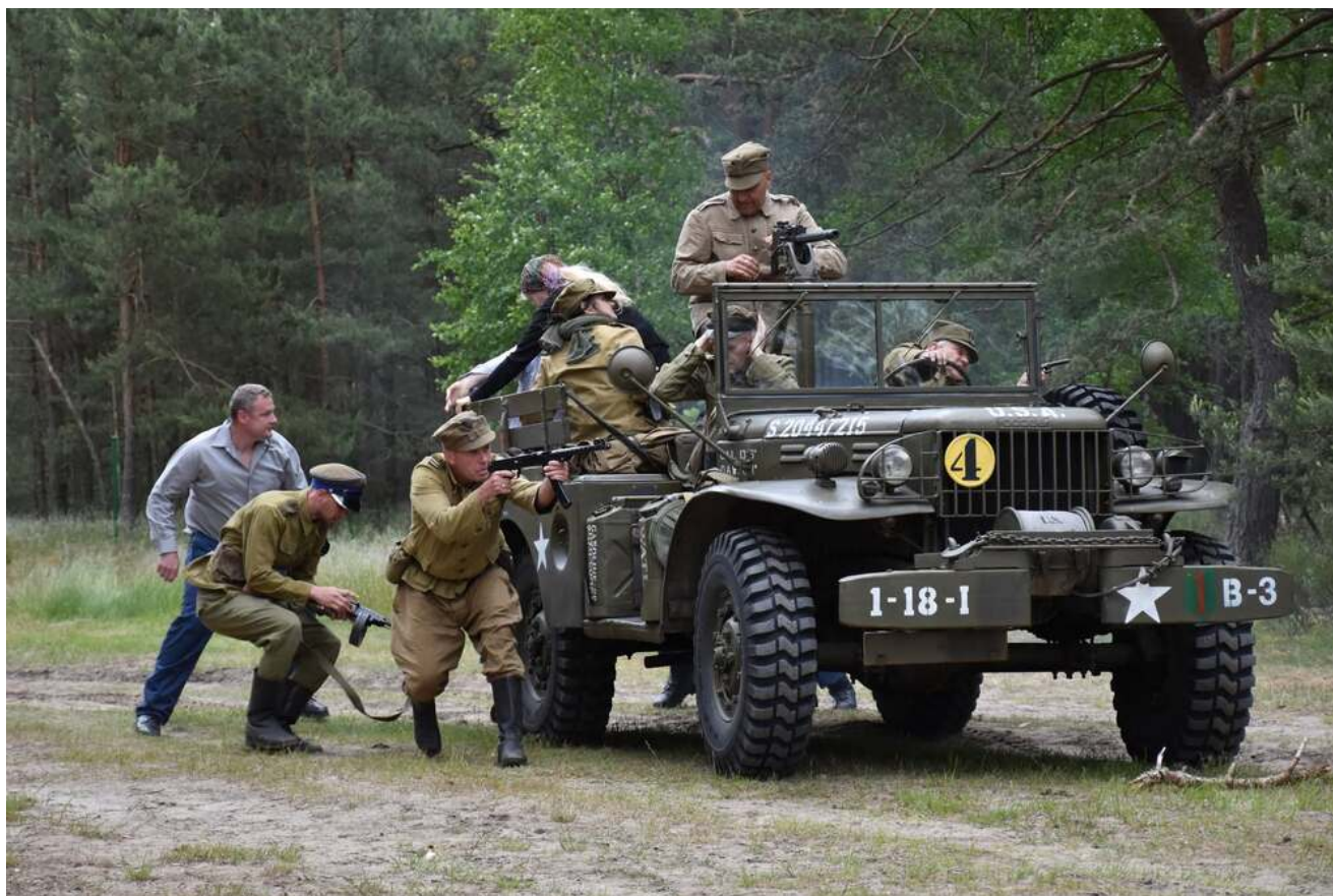
Bieg Pamięci w Lipinkach, 13 czerwca 2026