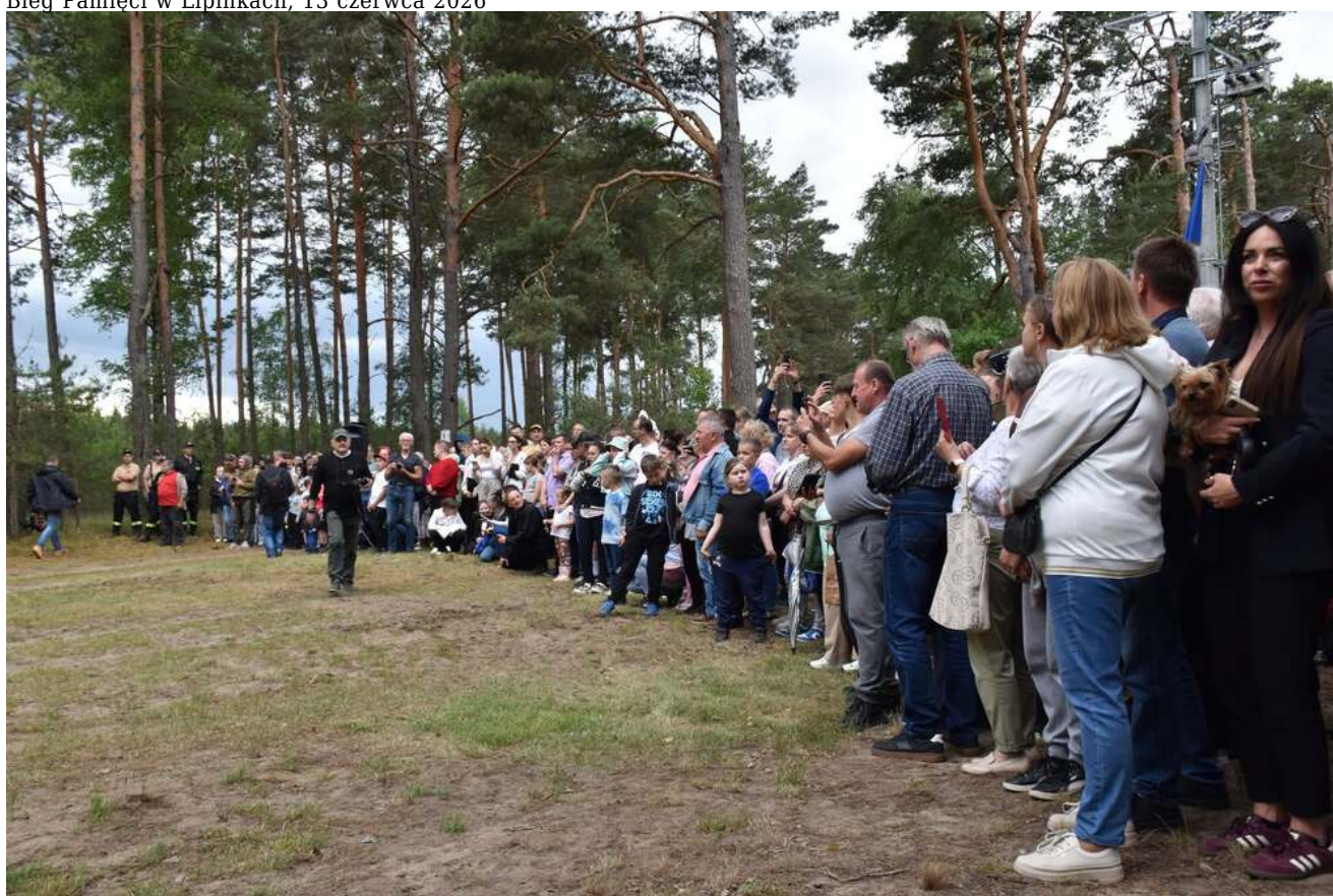
Bieg Pamięci w Lipinkach, 13 czerwca 2026