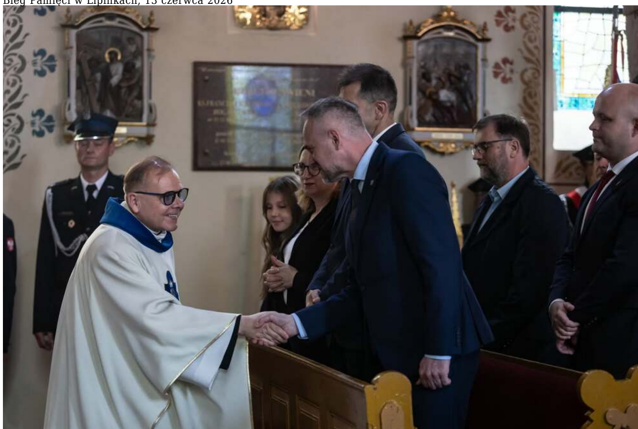
Bieg Pamięci w Lipinkach, 13 czerwca 2026