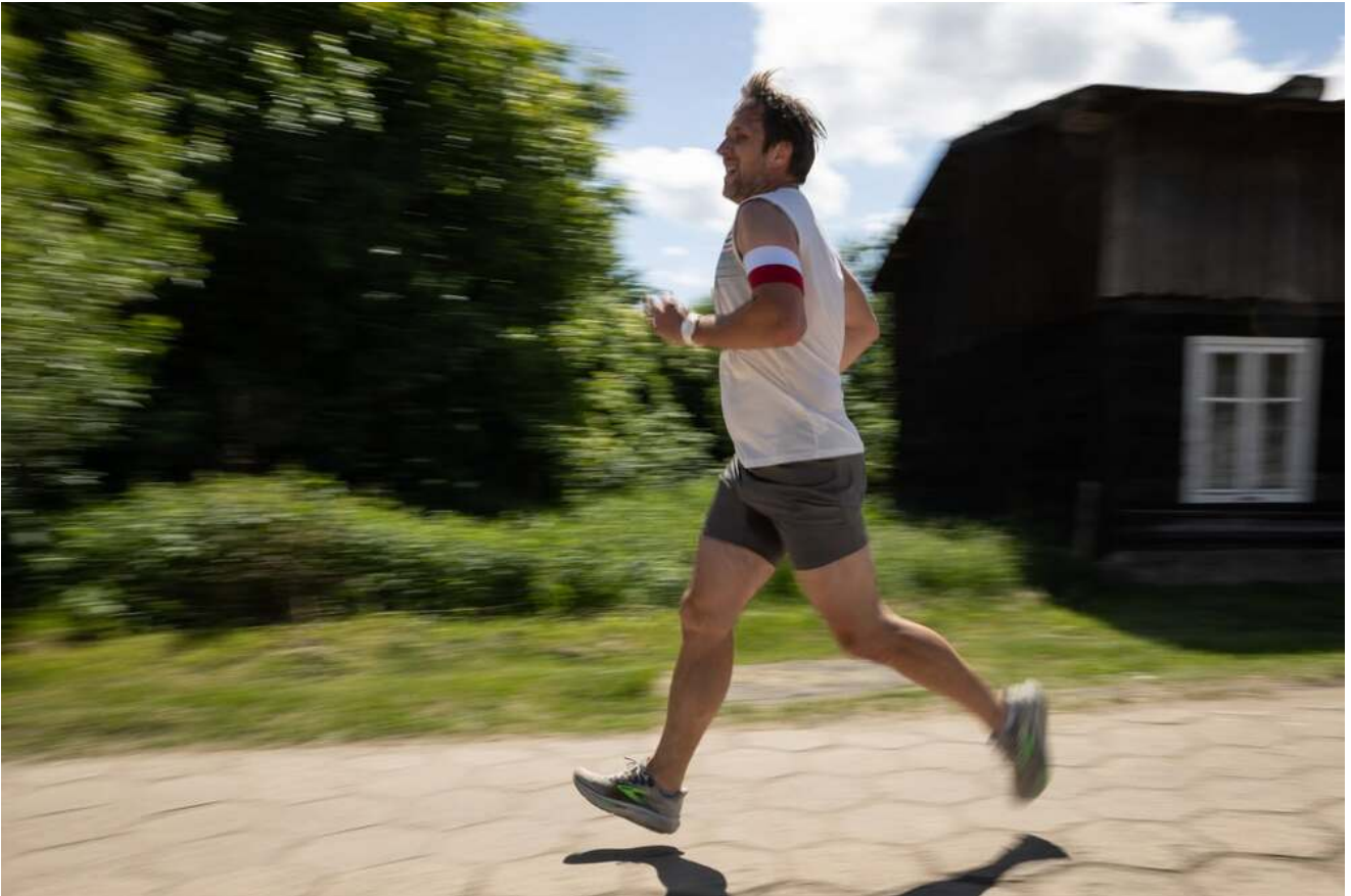
Bieg Pamięci w Lipinkach, 13 czerwca 2026