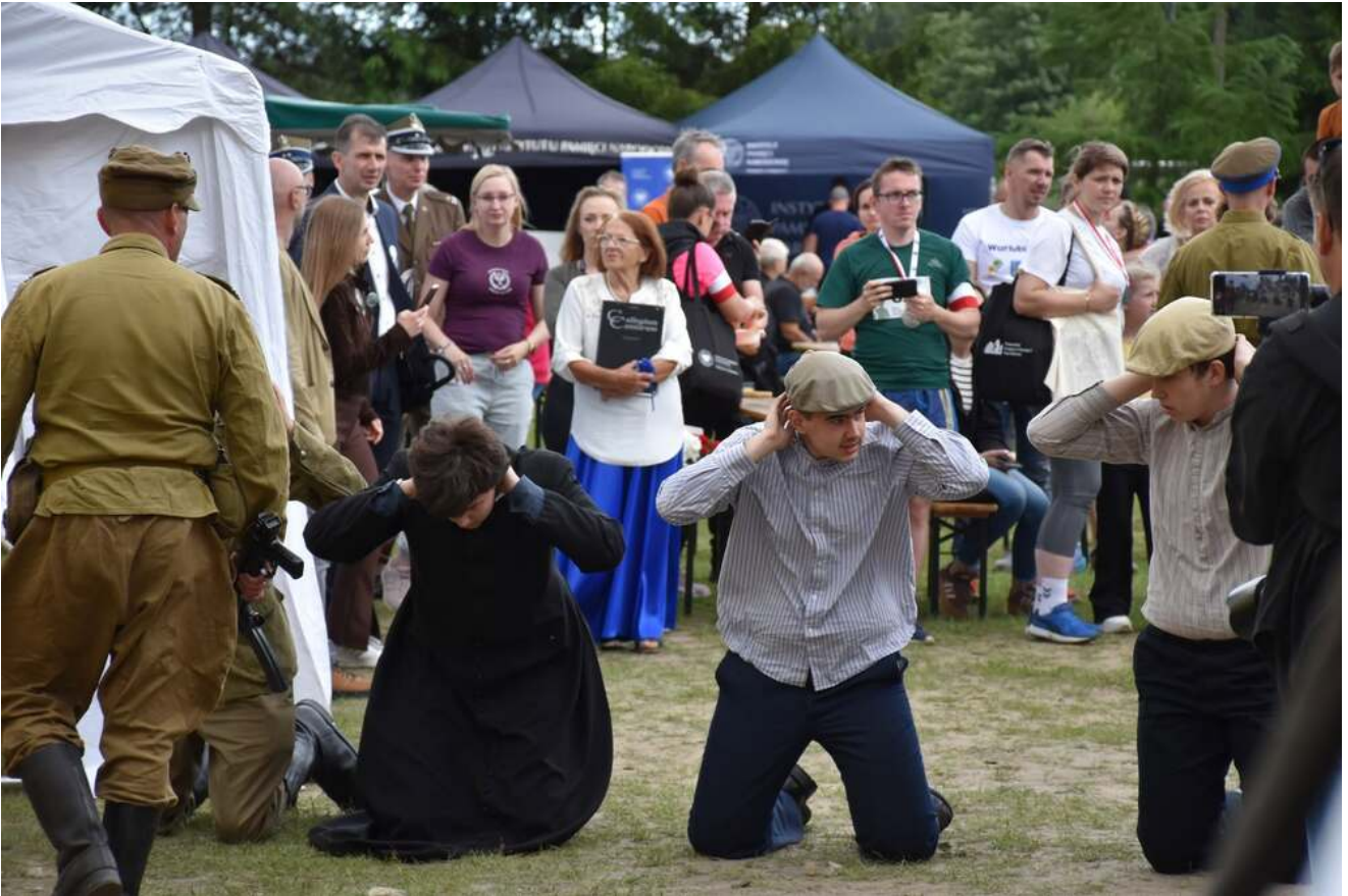
Bieg Pamięci w Lipinkach, 13 czerwca 2026