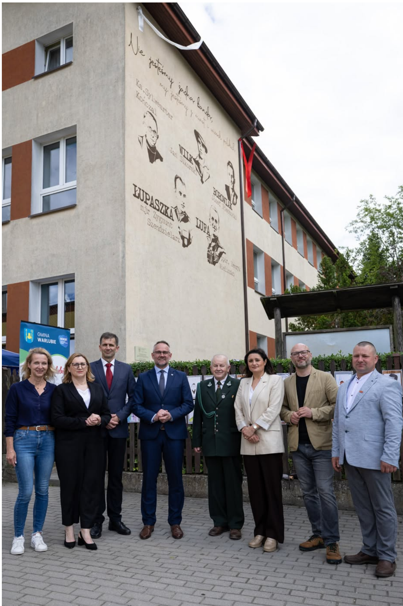
Bieg Pamięci w Lipinkach, 13 czerwca 2026