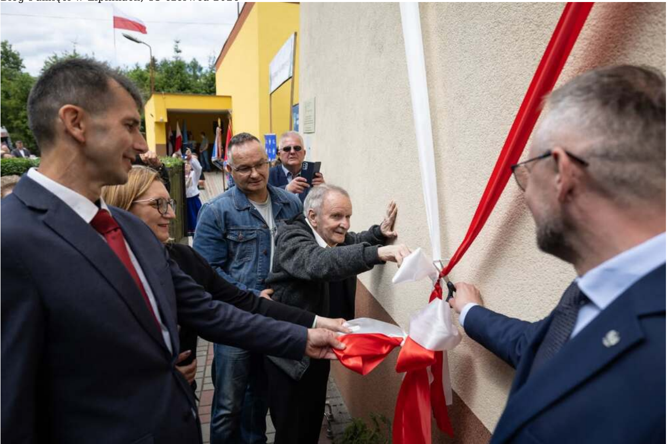
Bieg Pamięci w Lipinkach, 13 czerwca 2026