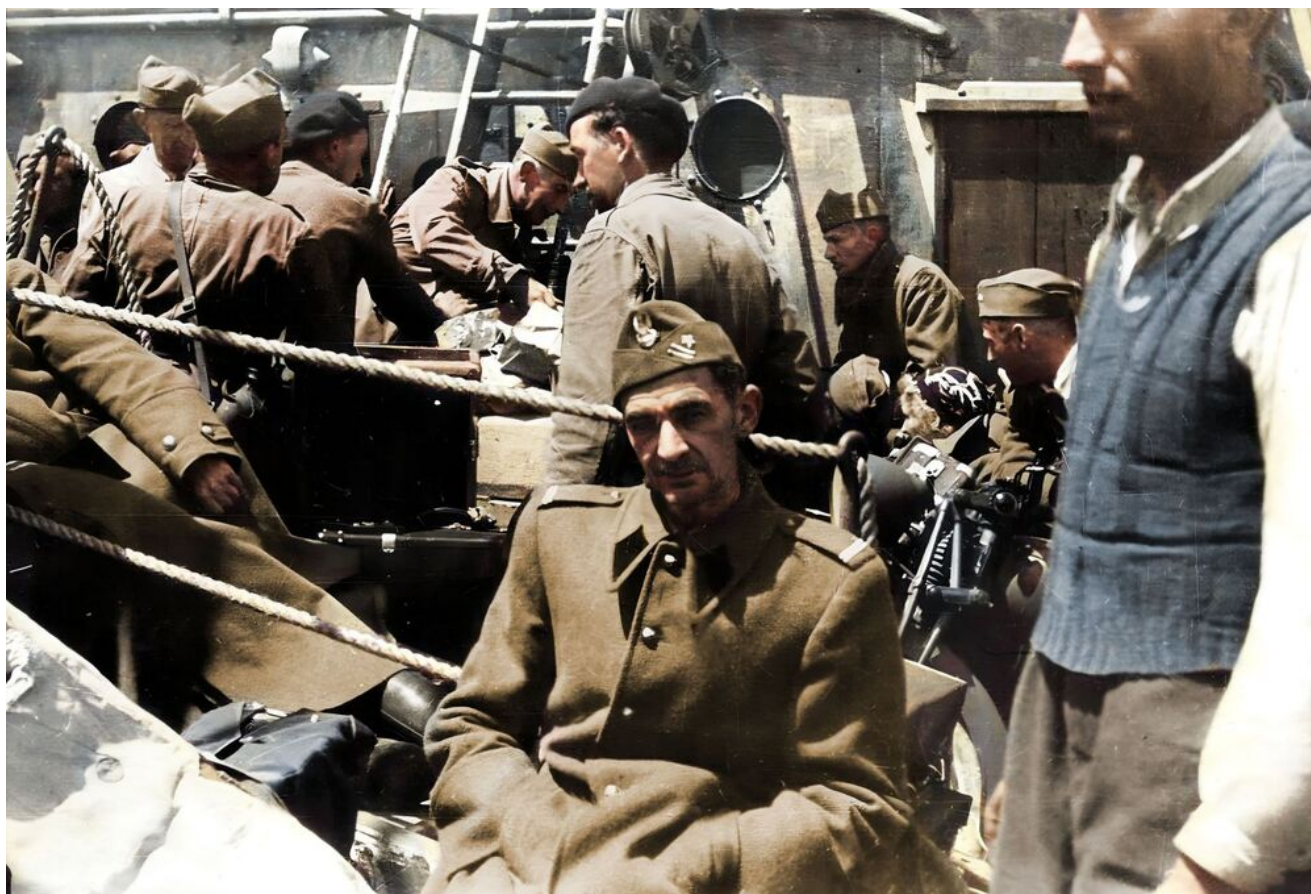
Polscy żołnierze na okręcie podczas ewakuacji do Wielkiej Brytanii, czerwiec 1940 r.