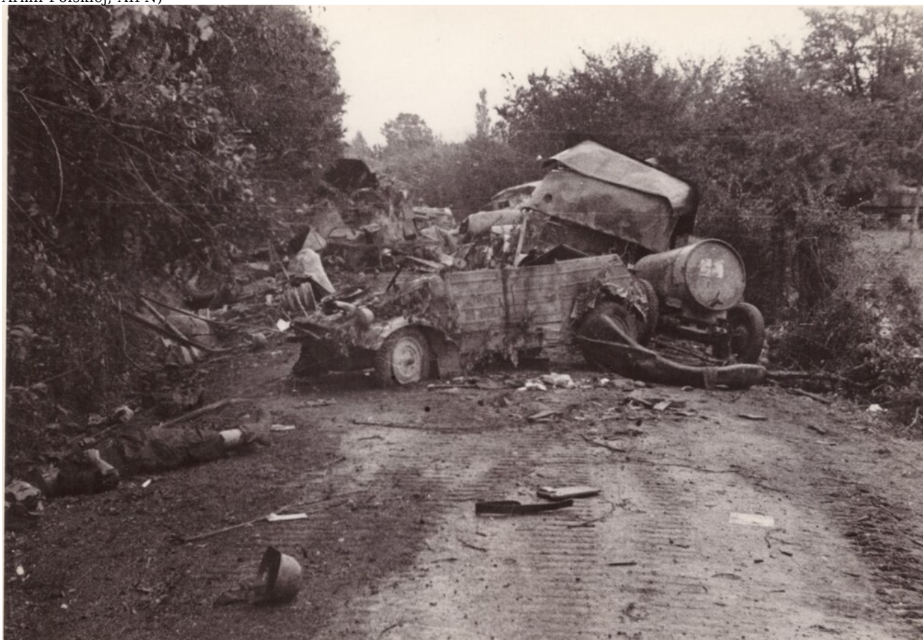
Na drodze w korytarzu śmierci po bitwie pod Falaise, Francja, 1944 r.