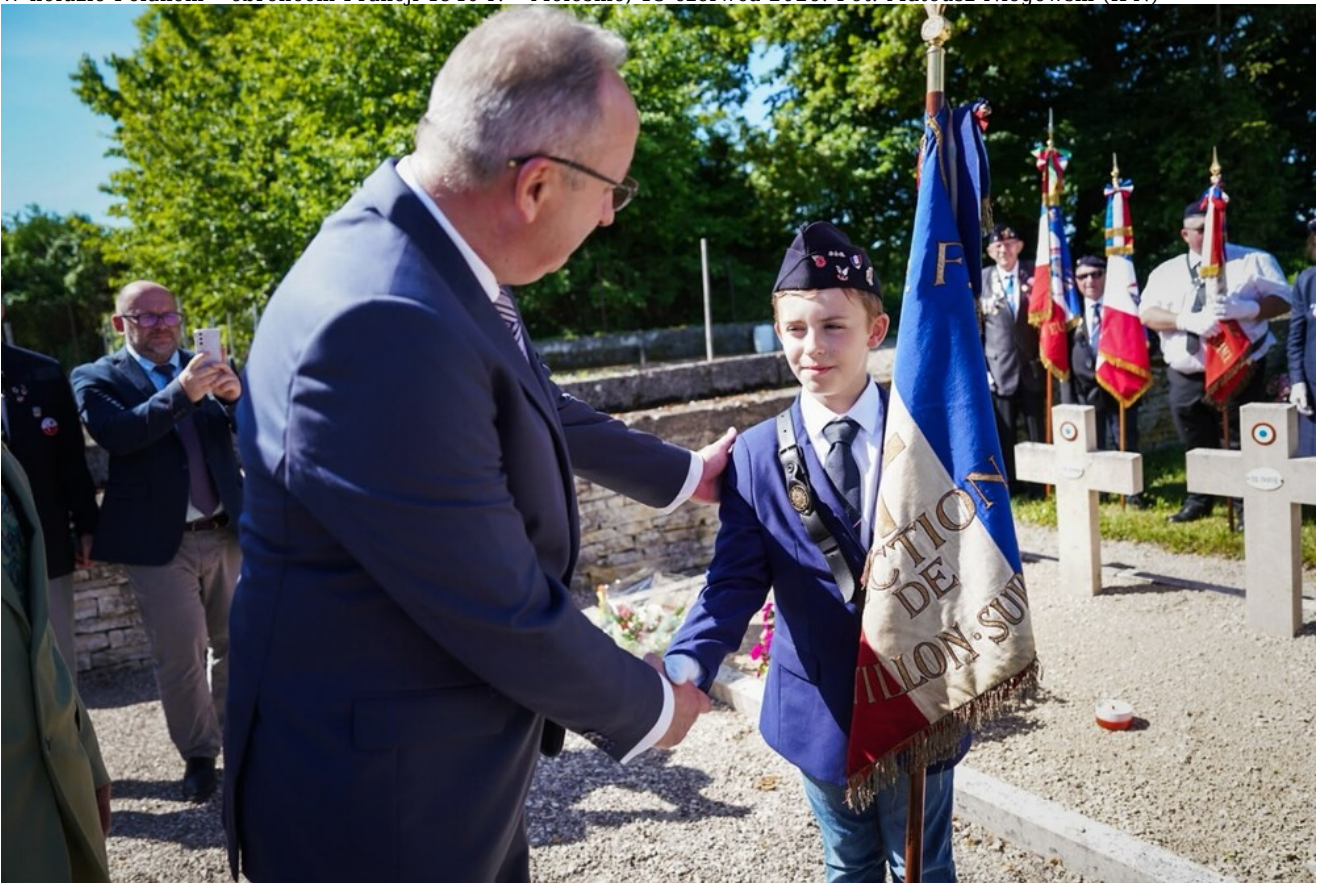
W hołdzie Polakom - obrońcom Francji 1940 r. - Molesme, 13 czerwca 2026.