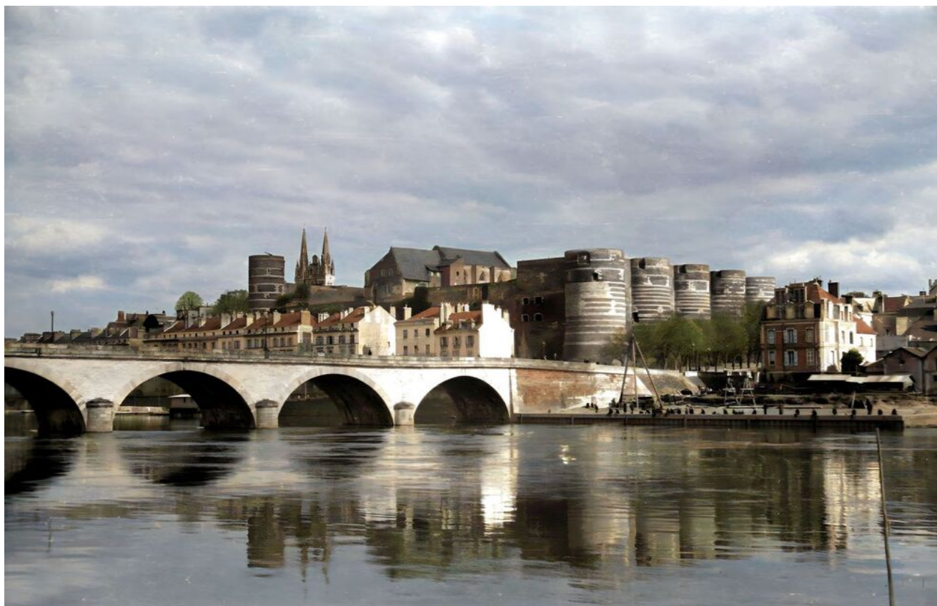
Miasto Angers w Kraju Loary było siedzibą polskich władz na uchodźctwie w latach 1939-1940, Francja