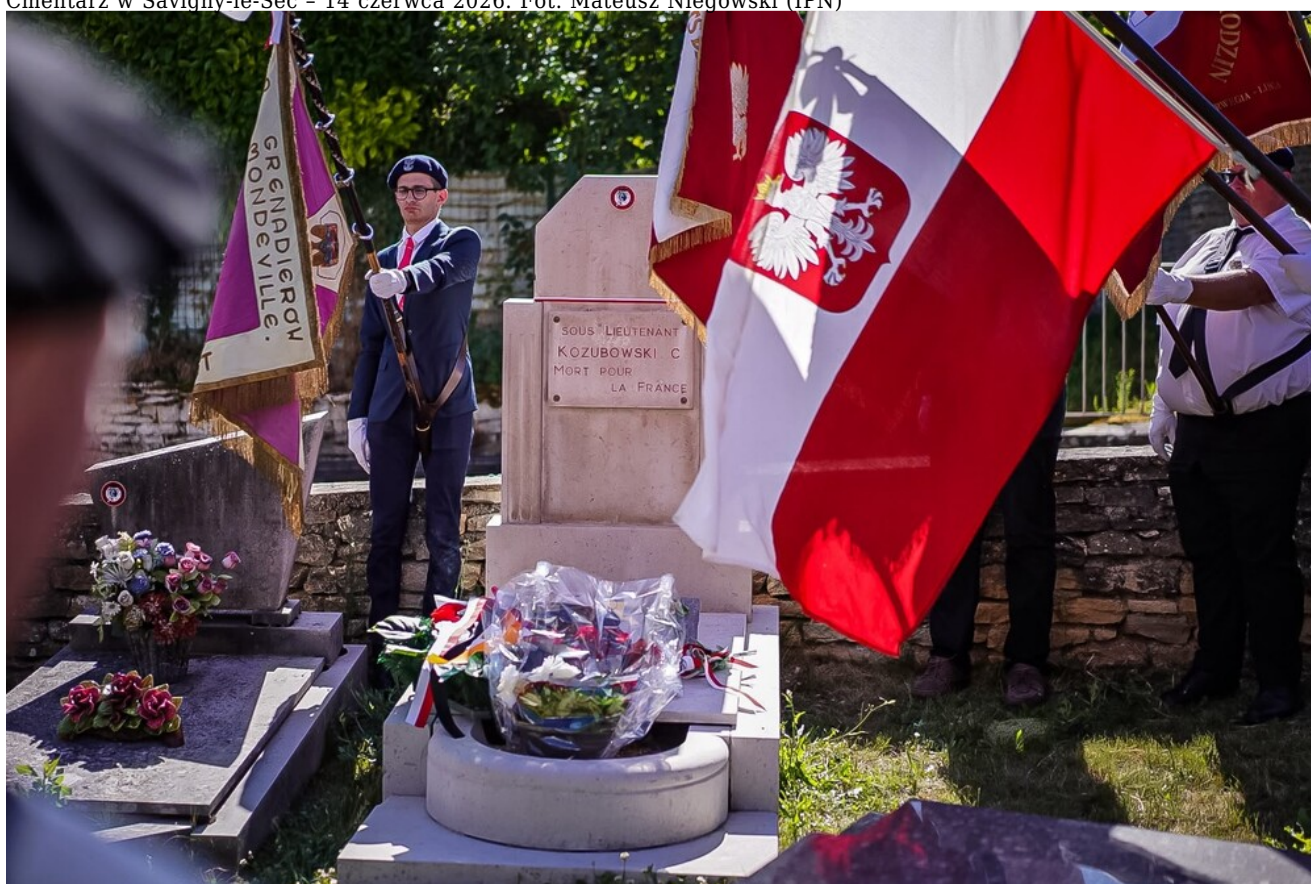
Cmentarz w Ahuy - 14 czerwca 2026.