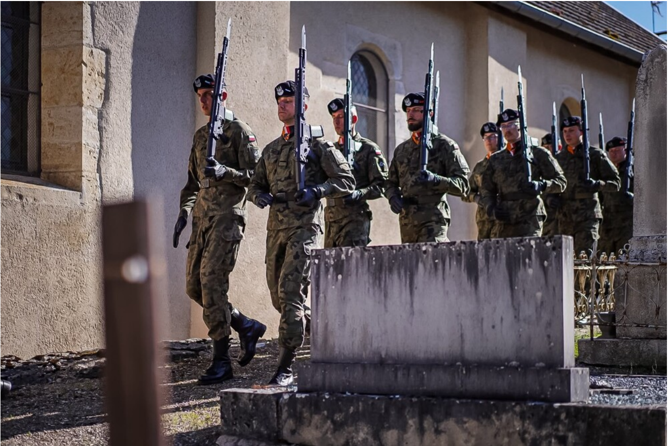
Cmentarz w Saint-Martin-du-Mont - 14 czerwca 2026.