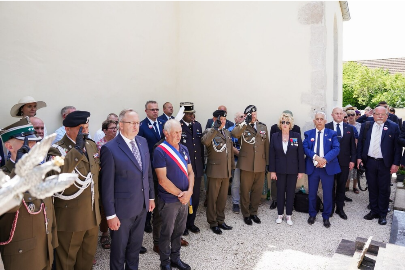
W hołdzie Polakom - obrońcom Francji 1940 r. - Fontaines-les-Sèches, 13 czerwca 2026.