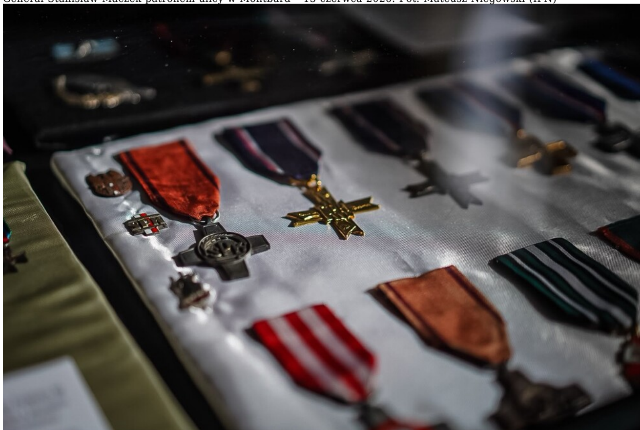
Generał Stanisław Maczek patronem ulicy w Montbard - 13 czerwca 2026.