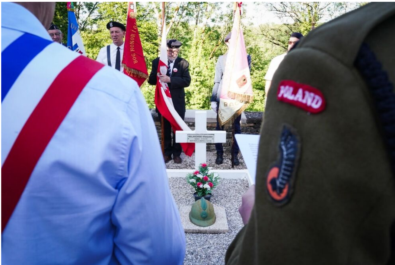
Cmentarz w Saint-Martin-du-Mont – 14 czerwca 2026.