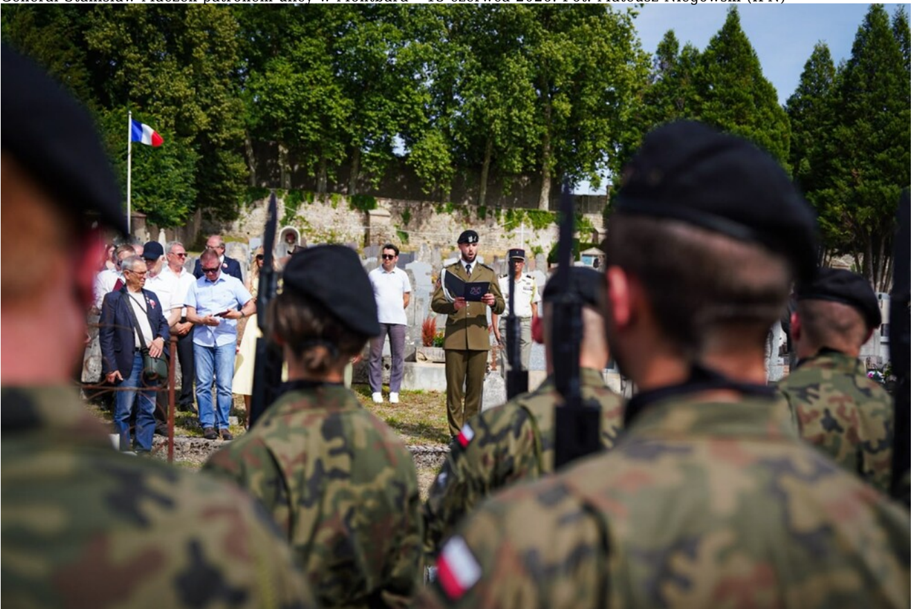
General Stanisław Maczek patronem ulicy w Montbard – 13 czerwca 2026.