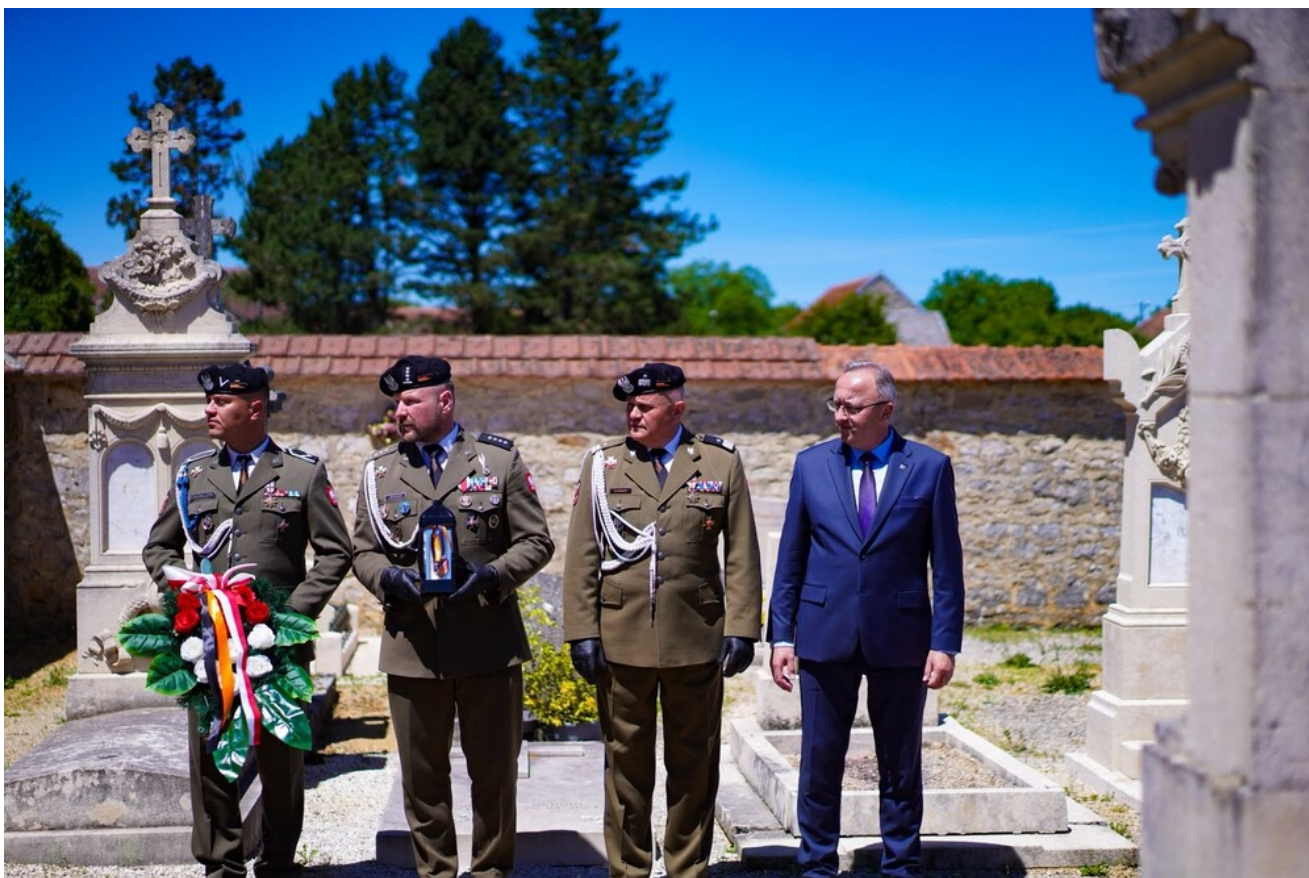
Cmentarz Savoisy - 14 czerwca 2026.