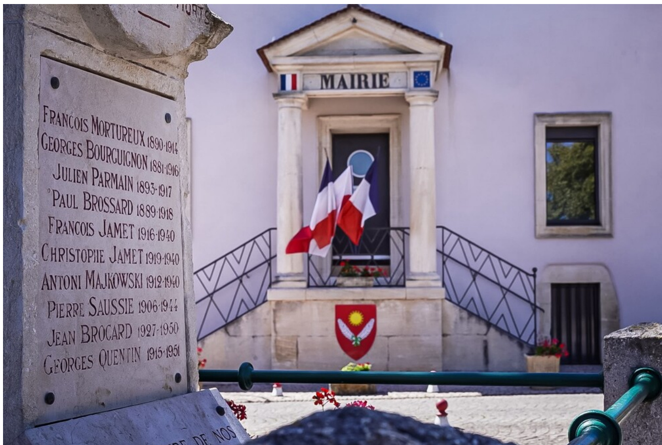
Cmentarz w Savigny-le-Sec - 14 czerwca 2026.