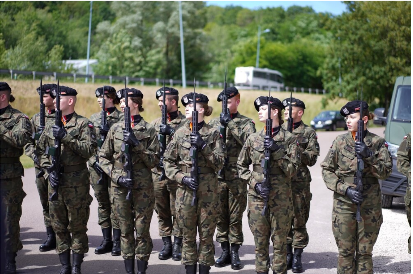
Generał Stanisław Maczek patronem ulicy w Montbard – 13 czerwca 2026.

Po ceremonii nadania ulicy imienia gen. Stanisława Maczka uczestnicy obchodów udali się na cmentarz Parc w Montbard. Przy grobach polskich żołnierzy złożyli kwiaty i oddali hołd poległym.