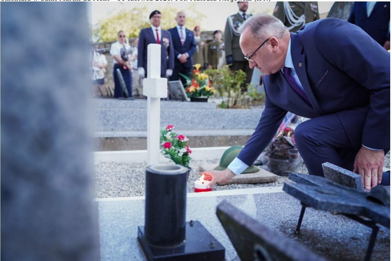
Cmentarz w Saint-Martin-du-Mont - 14 czerwca 2026.