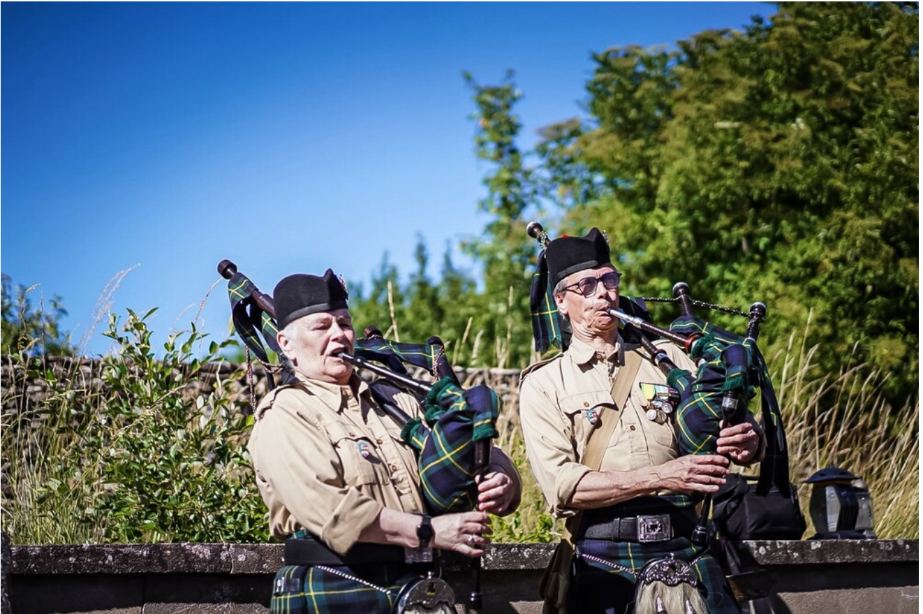
Cmentarz w Ahuy - 14 czerwca 2026.