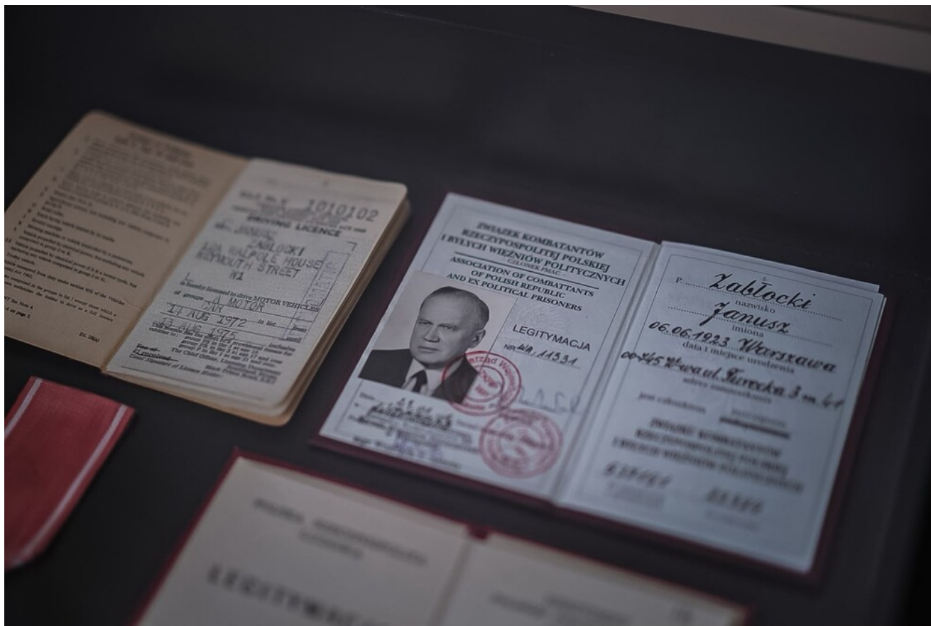
Generał Stanisław Maczek patronem ulicy w Montbard - 13 czerwca 2026.

- W krwawym boju o Montbard w 1940 roku poległo kilkunastu polskich żołnierzy. W Normandii, cztery lata później, życie oddało kolejnych kilkuset. Była to tylko część ofiary, złożonej na ołtarzu wolności Europy przez cały Naród i społeczeństwo II Rzeczypospolitej, w walce z totalitaryzmem. Niech dziś pamięć o tej ofierze przypomina nam o cenie, jaką Polacy gotowi byli zapłacić za „wolność naszą i waszą”.