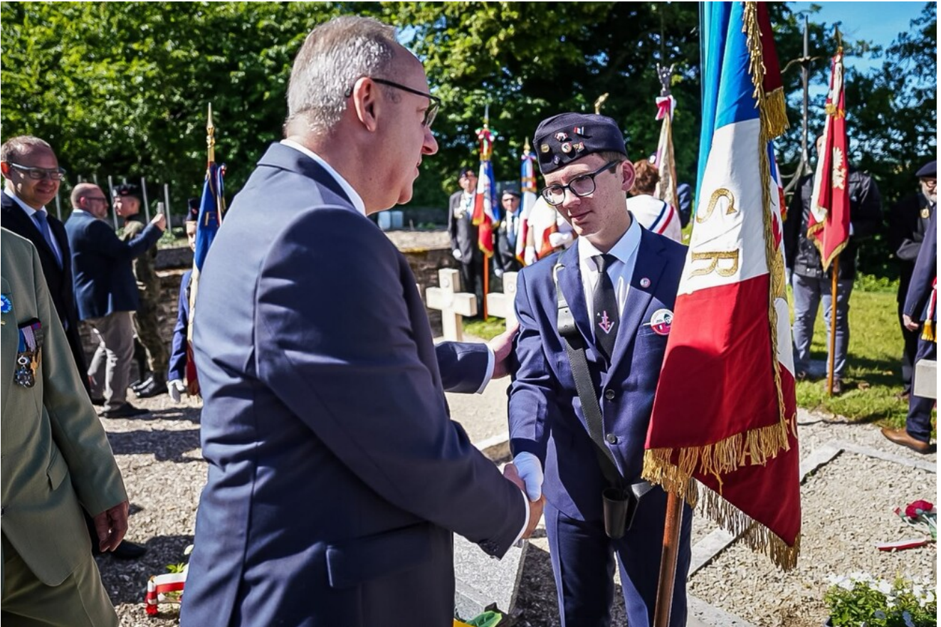
W hołdzie Polakom - obrońcom Francji 1940 r. - Molesme, 13 czerwca 2026.