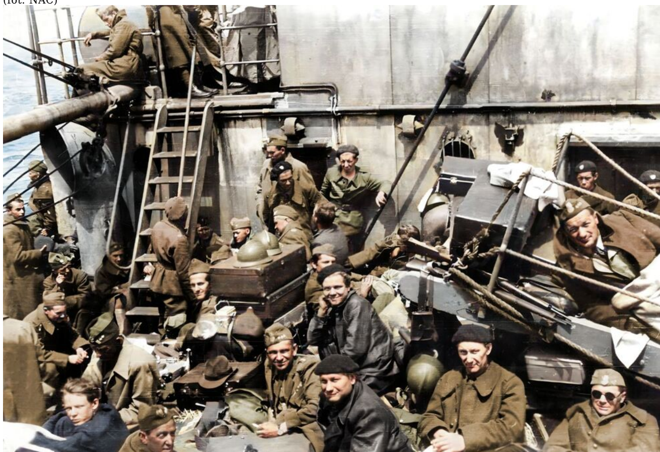
Polscy żołnierze na okręcie podczas ewakuacji do Wielkiej Brytanii, czerwiec 1940 r.