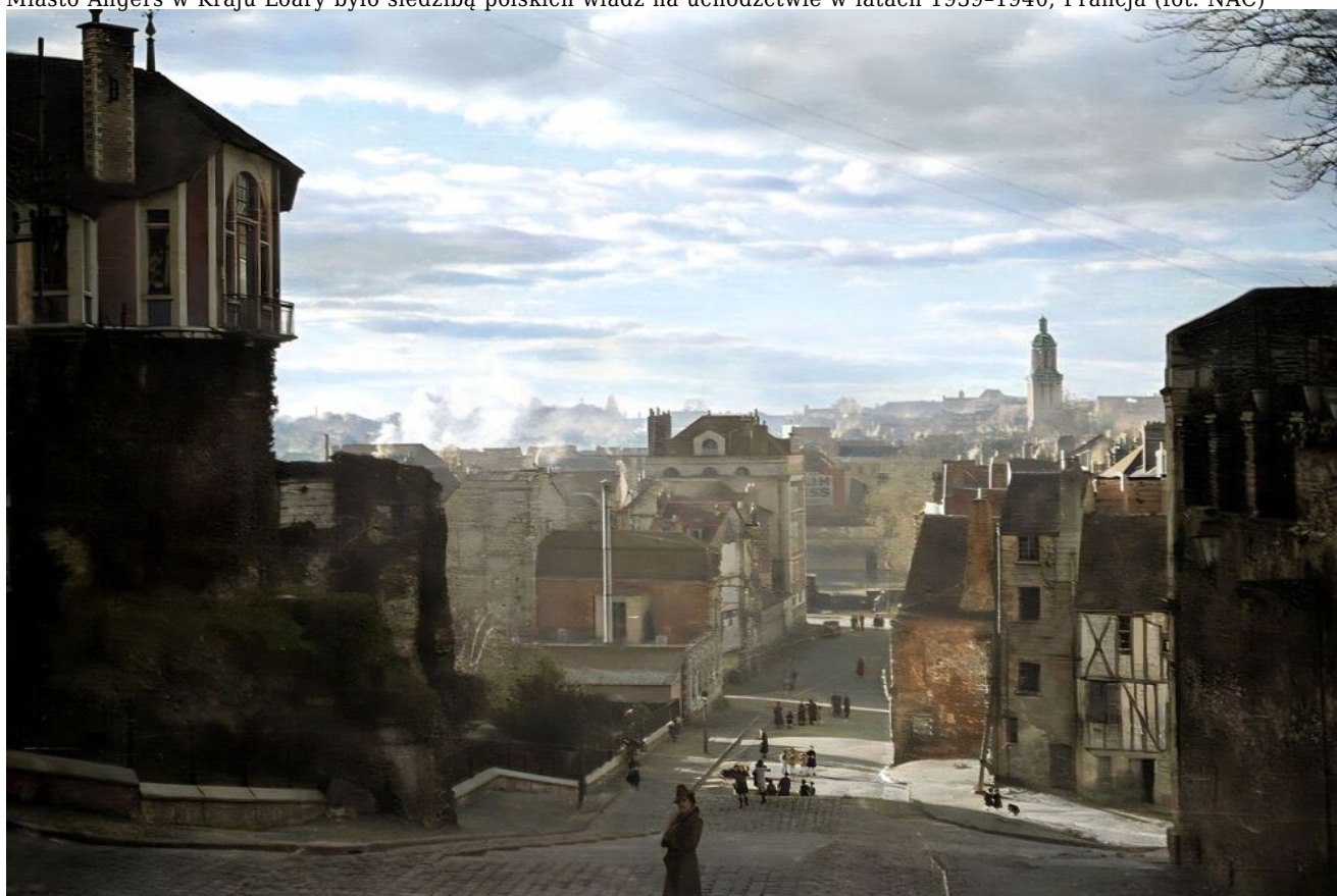
Angers, lata 1939-1940