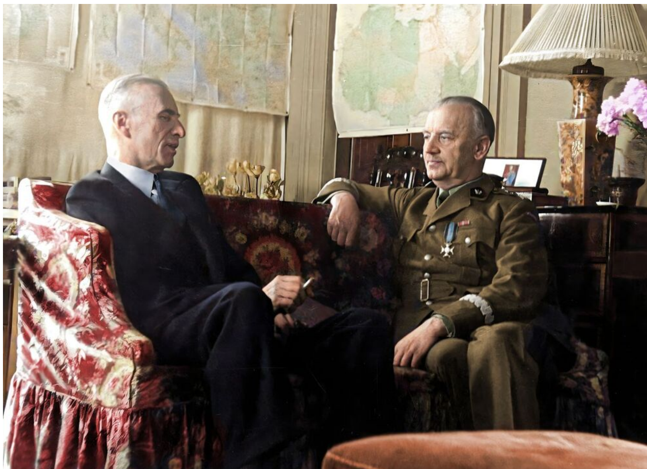
Prezydent RP Władysław Raczkiewicz (z lewej) i premier RP gen. Władysław Sikorski podczas rozmowy, lata 1940-1943