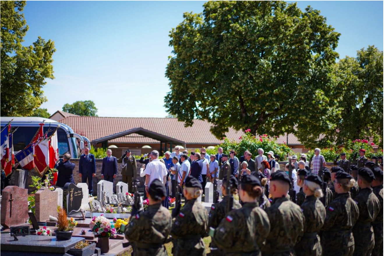
Cmentarz w Savigny-le-Sec - 14 czerwca 2026.