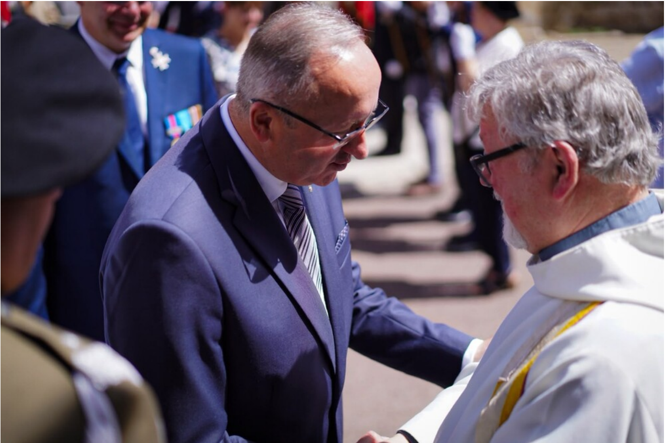
W hołdzie Polakom - obrońcom Francji 1940 r. - Molesme, 13 czerwca 2026.

Na cmentarzu w Fontaines-les-Sèches delegacja IPN złożyła kwiaty i uczciła pamięć polskich żołnierzy, którzy walczyli na tej ziemi w czerwcu 1940 r.