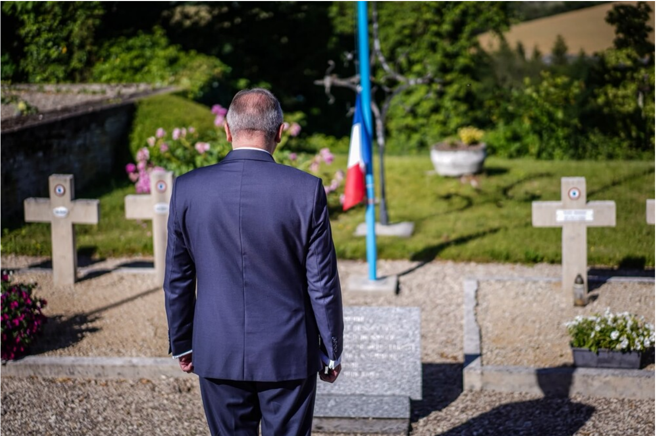
W hołdzie Polakom - obrońcom Francji 1940 r. - Molesme, 13 czerwca 2026.