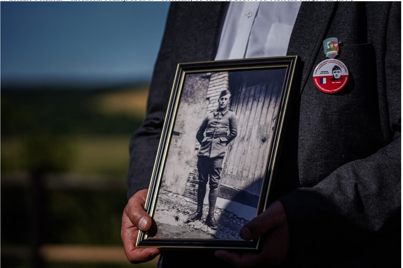
W hołdzie Polakom - obrońcom Francji 1940 r. - Molesme, 13 czerwca 2026.