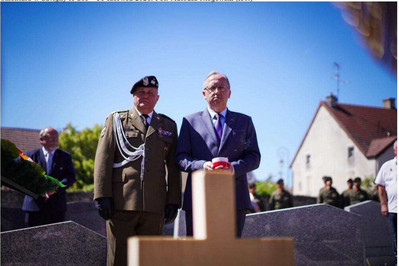
Cmentarz w Savigny-le-Sec - 14 czerwca 2026.