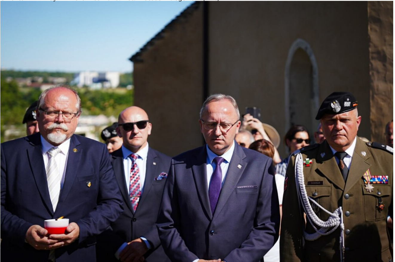
Cmentarz w Ahuy - 14 czerwca 2026.