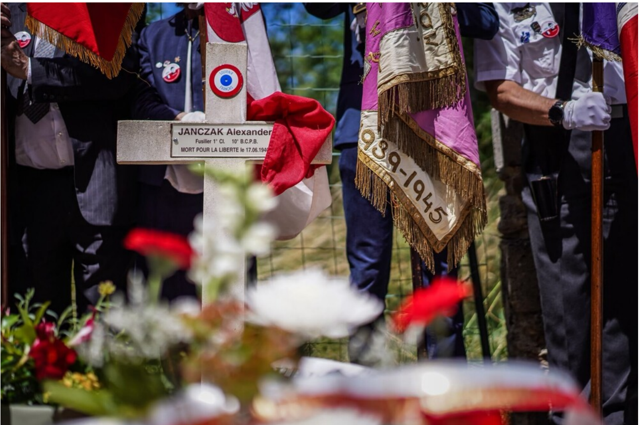
W hołdzie Polakom - obrońcom Francji 1940 r. - Fontaines-les-Sèches, 13 czerwca 2026.

Na cmentarzu w Fontaines-les-Sèches delegacja IPN złożyła kwiaty i uczciła pamięć polskich żołnierzy, którzy walczyli na tej ziemi w czerwcu 1940 r.