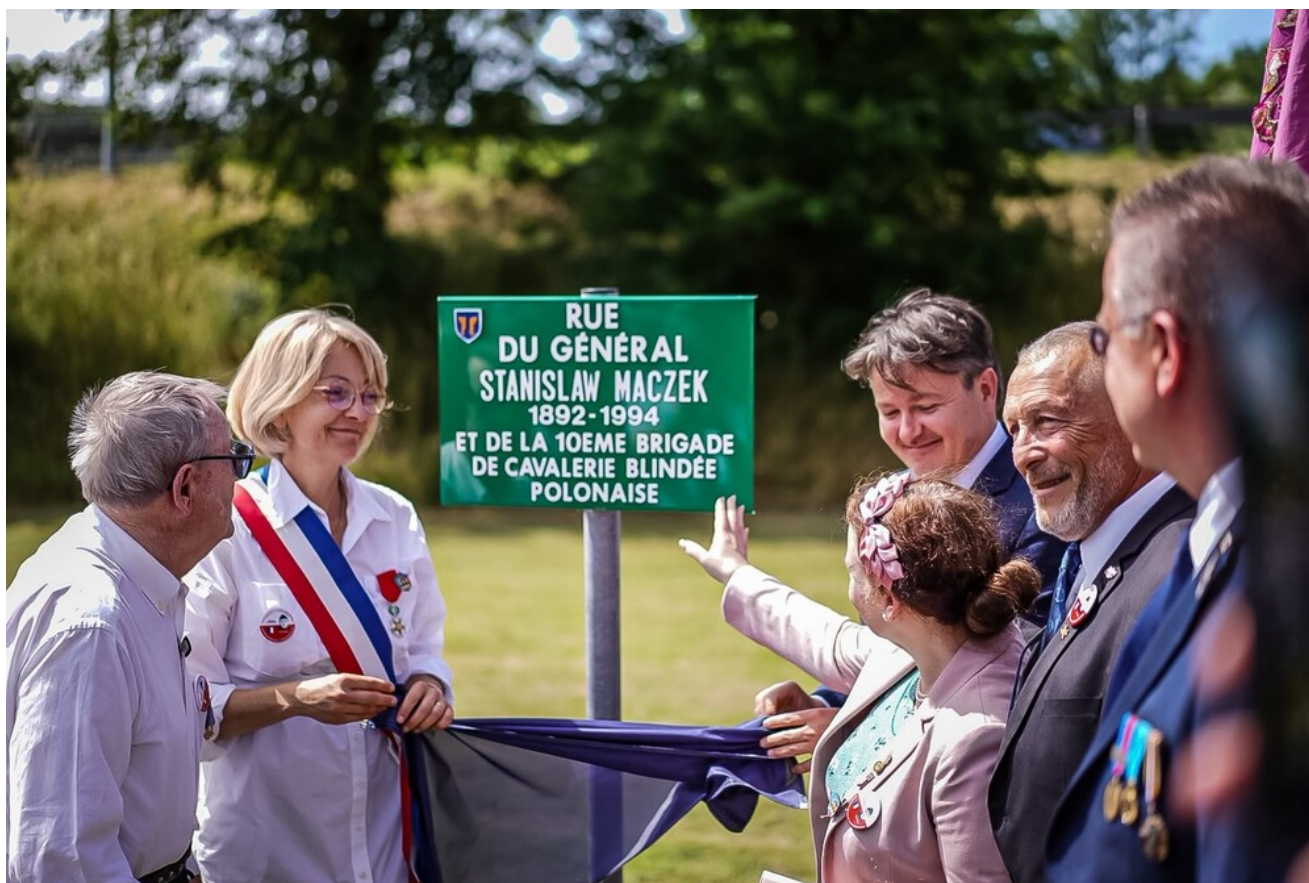
Generał Stanisław Maczek patronem ulicy w Montbard - 13 czerwca 2026.