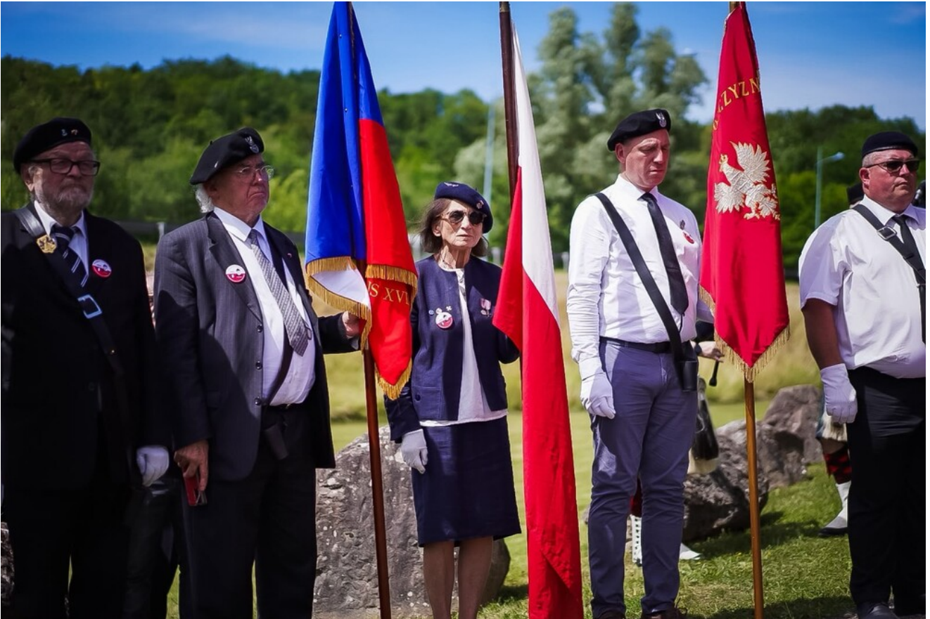
General Stanisław Maczek patronem ulicy w Montbard - 13 czerwca 2026.