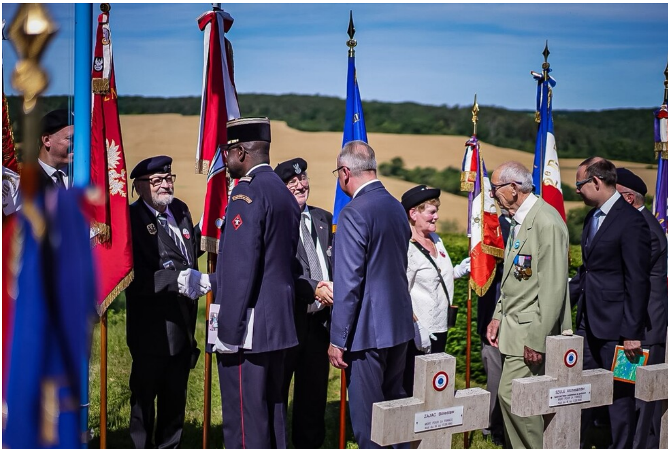
W hołdzie Polakom - obrońcom Francji 1940 r. - Molesme, 13 czerwca 2026.