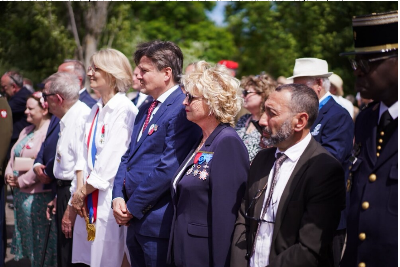
General Stanisław Maczek patronem ulicy w Montbard - 13 czerwca 2026.