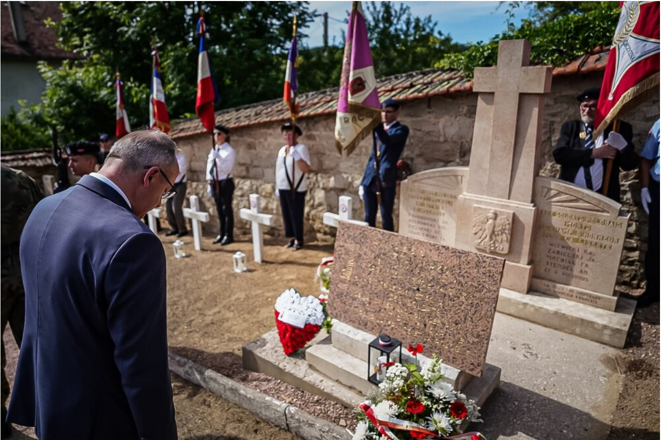
General Stanisław Maczek patronem ulicy w Montbard – 13 czerwca 2026.