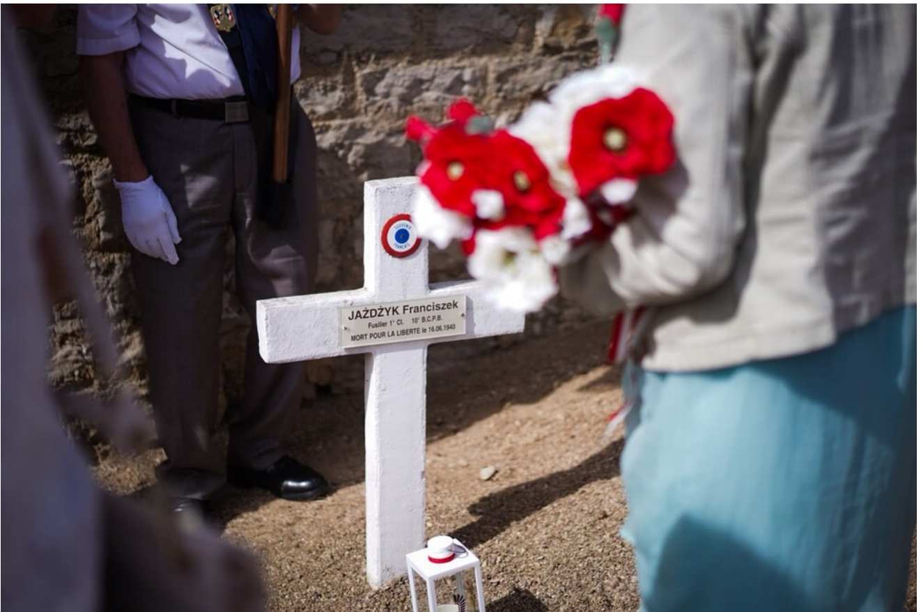
Generał Stanisław Maczek patronem ulicy w Montbard – 13 czerwca 2026.

Po ceremonii nadania ulicy imienia gen. Stanisława Maczka uczestnicy obchodów udali się na cmentarz Parc w Montbard. Przy grobach polskich żołnierzy złożyli kwiaty i oddali hołd poległym.