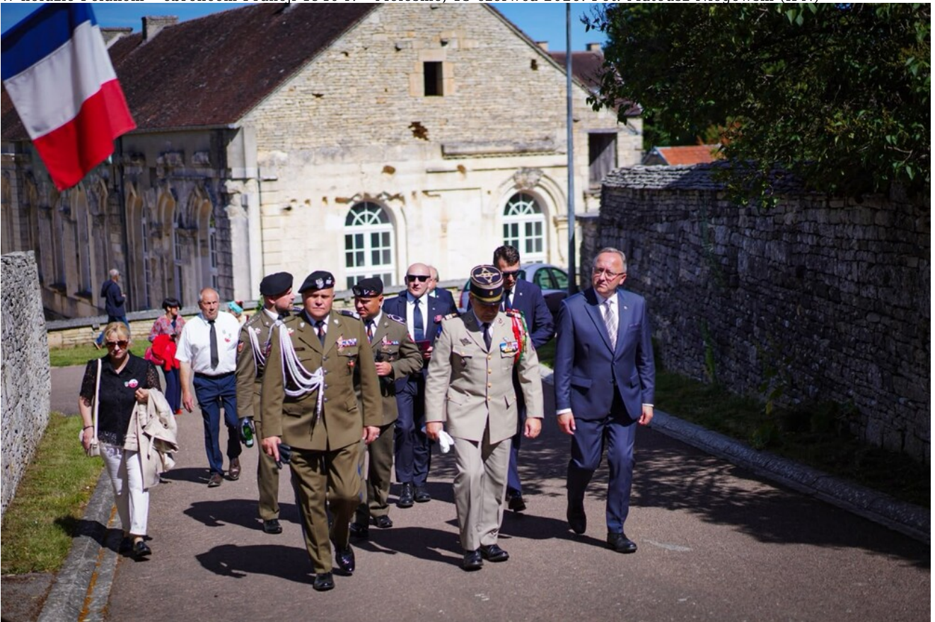
W hołdzie Polakom - obrońcom Francji 1940 r. - Molesme, 13 czerwca 2026.