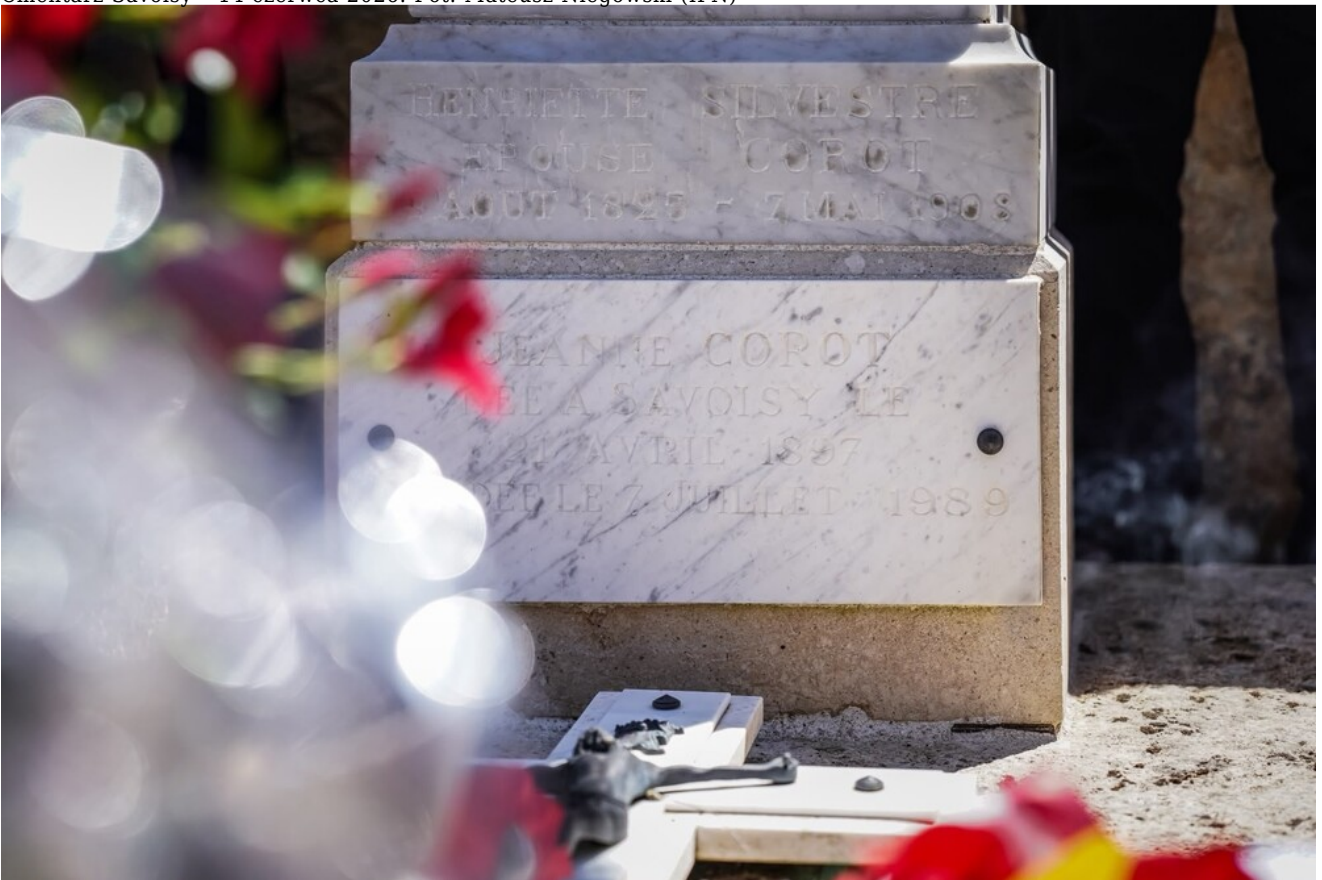
Cmentarz Savoisy - 14 czerwca 2026.