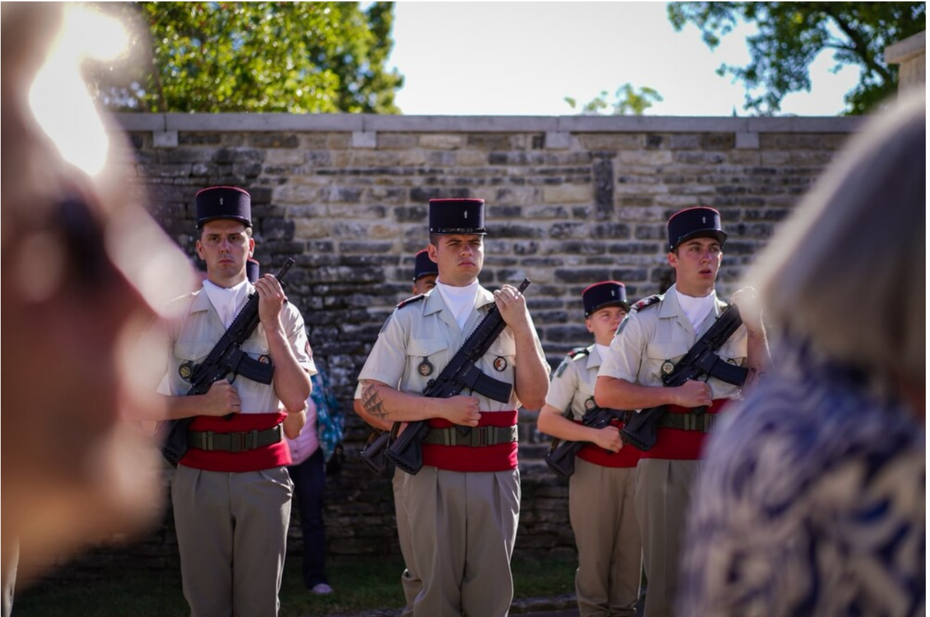
W hołdzie Polakom - obrońcom Francji 1940 r. - Molesme, 13 czerwca 2026.