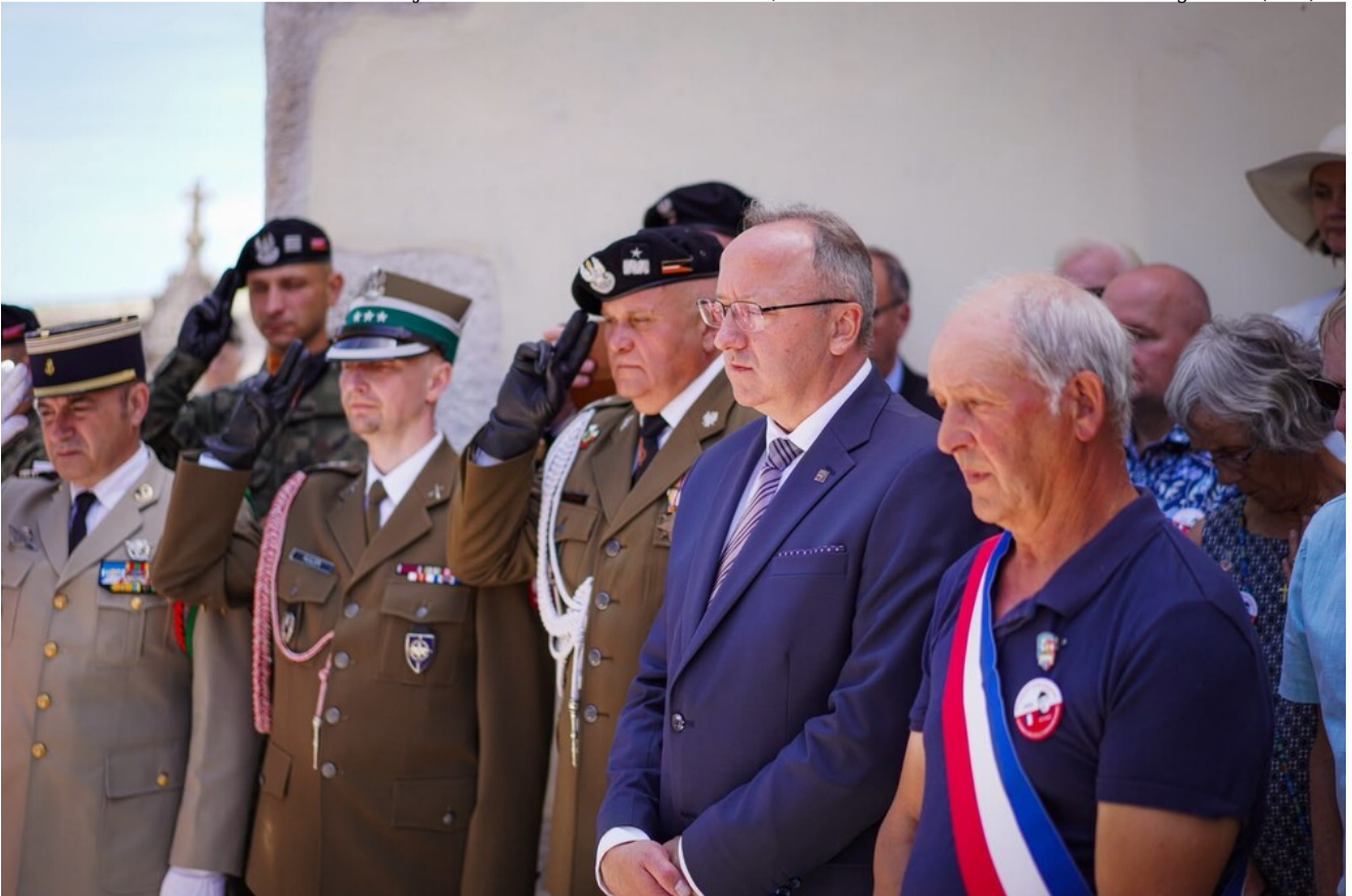
W hołdzie Polakom - obrońcom Francji 1940 r. - Fontaines-les-Sèches, 13 czerwca 2026.