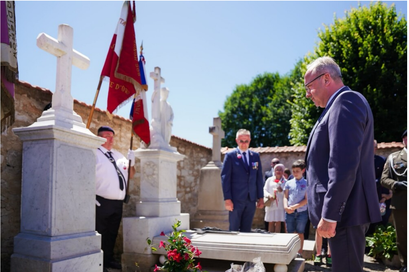
Cmentarz Savoisy - 14 czerwca 2026.