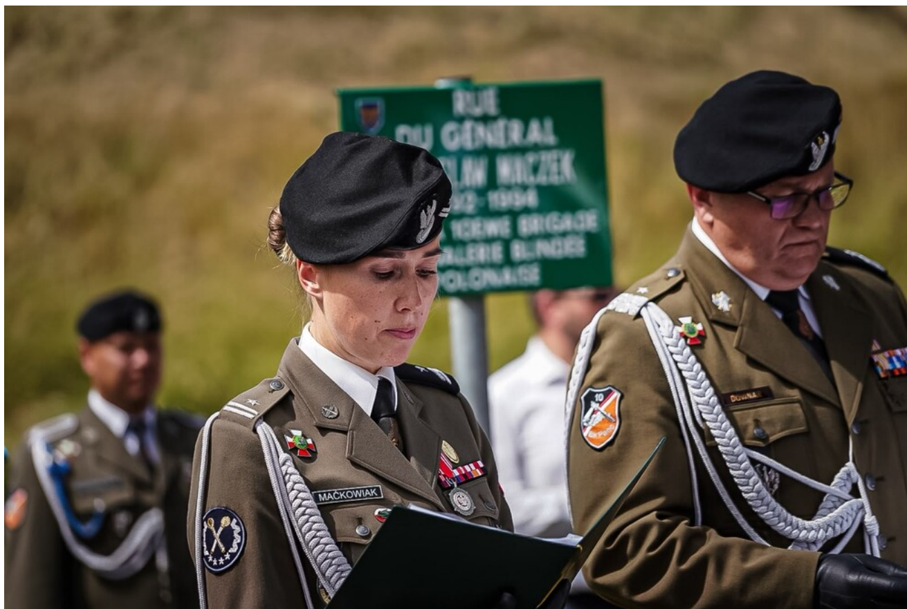
General Stanisław Maczek patronem ulicy w Montbard - 13 czerwca 2026.